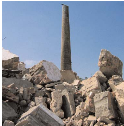
Chimenea de Verdier antes de ser demolida

La plataforma en defensa del Patrimonio Histórico-Artístico de La Palma del Condado (Huelva) se constituía en junio de 2007. El previsible derribo de la Chimenea de Verdier, torre de destilación de alcoholes de las históricas Bodegas Pichardo, y una de las más antiguas de Andalucía, desencadenaba un proceso de protesta encabezado por este movimiento ciudadano que culminaba dos meses después con la inevitable destrucción de la torre. Este elemento de la arquitectura industrial de La Palma suponía un obstáculo al plan de ejecución de una promoción de viviendas en la localidad. La Plataforma denunció entonces que tan singular elemento no estuviera protegido por el Plan General de Ordenación Urbana del municipio.