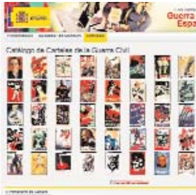
Catálogo Carteles de la Guerra Civil Española en PARES en http://pares.mcu.es

El Ministerio de Cultura acaba de poner a disposición del público un total de 19 millones de imágenes y 1,7 millones de documentos procedentes de los principales archivos españoles y que constituyen una parte sustancial del patrimonio documental. Están disponibles a través del portal PARES (Portal de Archivos Españoles) donde se podrán consultar las 24 horas del día sin ningún tipo de restricción. Desde el Archivo de Indias hasta el de Simancas pasando por el Histórico Nacional o los provinciales, se pueden encontrar digitalizados documentos tan interesantes como el Tratado de Tordesillas o los referentes a la Guerra Civil española. El usuario puede acceder por el sistema de búsqueda sencilla y avanzada, o bien a partir del Inventario Dinámico de Archivos, que informa sobre los documentos de cada archivo que son accesibles a través de PARES.