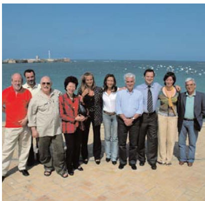
➤ Socios del proyecto Archeomed

Durante los meses de mayo y junio el Centro de Arqueología Subacuática del Instituto Andaluz del Patrimonio Histórico va a colaborar en el desarrollo de las dos actividades que la Dirección General de Bienes Culturales de la Consejería de Cultura tiene previsto realizar en el marco del proyecto europeo Archeomed (Interreg III B Medocc).