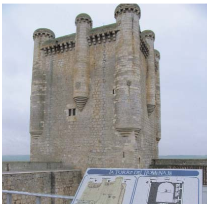
➤ Castillo de Torrelobatón

Después de la rehabilitación y puesta en valor del castillo de Torrelobatón, en Valladolid, acometida por la Fundación del Patrimonio Histórico de Castilla y León, en colaboración con la Fundación Villalar-Castilla y León y el Ayuntamiento de Torrelobatón, que supuso la rehabilitación y adaptación del adarve y su acceso, los cubos, el patio de armas y la torre del homenaje; y la instalación del Centro de Interpretación Histórica, más de diez mil personas han visitado el Centro de Interpretación del Movimiento Comunero en su primer año abierto al público.