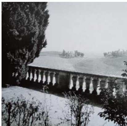
Entorno el Jardín de Forestier, un paisaje protegido donde planean construir hoteles

La Plataforma Ciudadana Forestier de Castilleja de Guzmán, apoyándose en los objetivos del Decreto 162/2005 de 5 de julio, por el que se declara Bien de Interés Cultural, con la categoría de Monumento, la antigua Hacienda Divina Pastora, su jardín y la torre contrapeso, ha presentado una alegación para que no se incluya en el Plan de Ordenación del Territorio de la Aglomeración Urbana de Sevilla la propuesta de implantación de edificaciones de uso hotelero que ocuparían un espacio de 36 000 m 2 del entorno protegido de dicho bien.