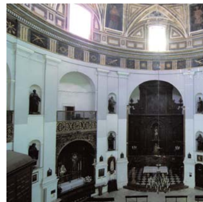
Interior de la Iglesia del Santo Cristo de Málaga

El IAPH continúa la colaboración iniciada con la Fundación Caja Madrid, a través de su Programa de Conservación del Patrimonio Histórico Español, con un proyecto de intervención que tiene por objeto la conservación y valoración del programa iconográfico de la Iglesia del Santo Cristo de la Salud de Málaga, dado su mal estado de conservación y la aparición de nuevas pinturas murales.