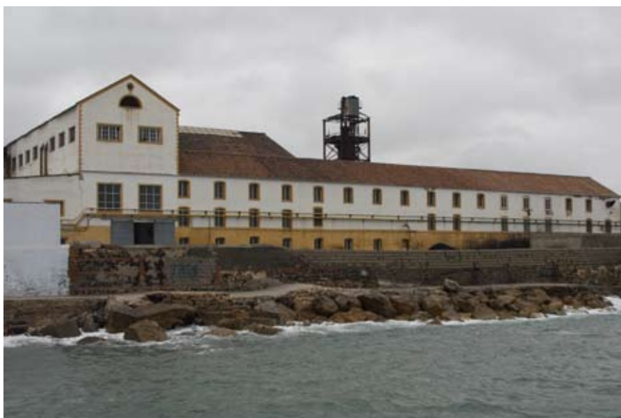
Azucarera de Guadalfeo.

La Azucarera de Guadalfeo, situada en el anejo salobreño de La Caleta (Granada), fue declarada el pasado octubre por el Consejo de Gobierno de la Junta de Andalucía como Lugar de Interés Etnológico, convirtiéndose junto a su entorno en espacio protegido. Se trata de la última fábrica de azúcar que funcionó en Europa, tras realizar su última zafra en el año 2006. Con la inscripción de la Azucarera de Guadalfeo serán 13 los Lugares de Interés Etnológico presentes en el Catálogo General del Patrimonio Histórico Andaluz (CGPHA), desde que se recogiera esta figura jurídica hace casi veinte años con la ley de patrimonio andaluza de 1991.