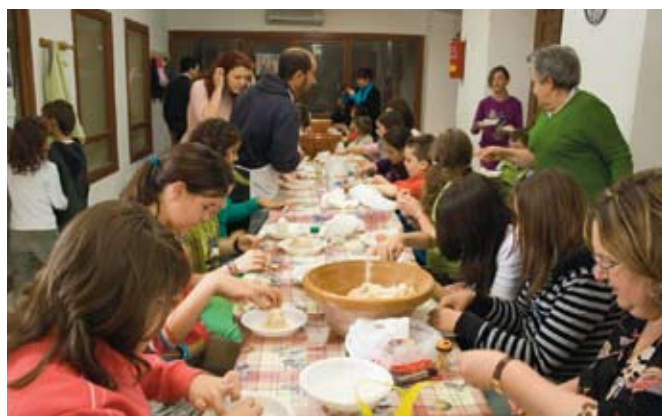
Elaboración de hornazo en Priego de Córdoba, Subbética Cordobesa.