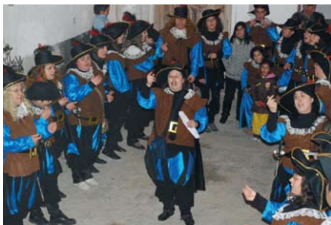
Comparsa de los Carnavales de Ohanes. Alpujarra Almeriense (Almería).