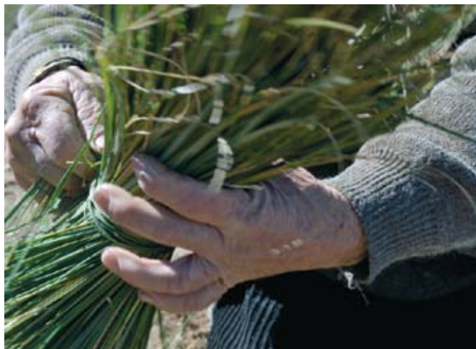
Recogiendo esparto, La Axarquía (Málaga).