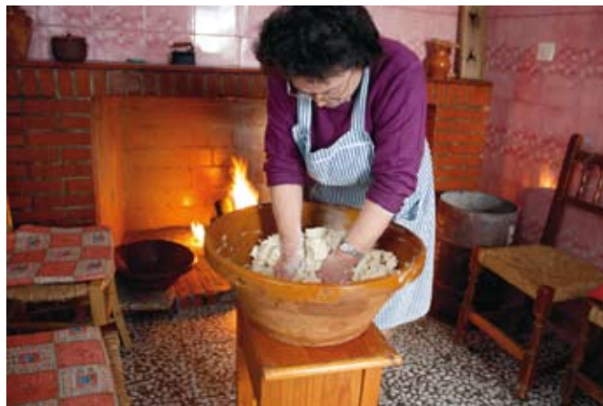
Elaboración de buñuelos en Martín de la Jara, Sierra Sur de Sevilla.

g) detectar zonas de especial interés y valores patrimoniales así como los factores de riesgo que afectan a dicho patrimonio.