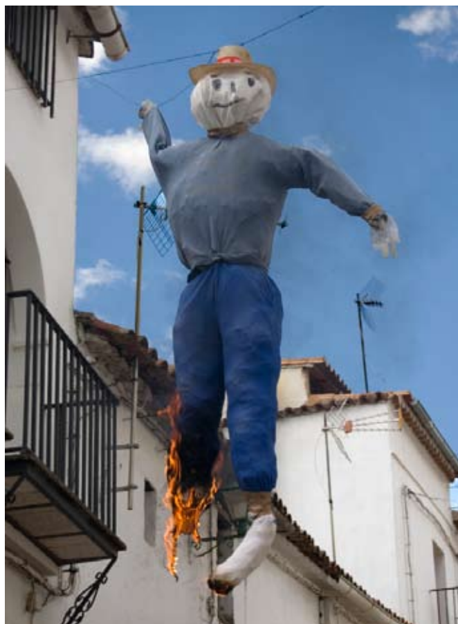
Quema de Judas. Semana Santa de Linares de la Sierra (Huelva).