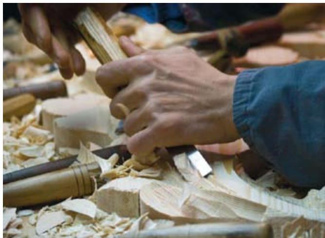
Talla y carpintería. Baza (Granada).

patrimonio inmaterial 5 con la Convención para la Salvaguardia del Patrimonio Cultural Inmaterial definiéndolo como: "los usos, representaciones, expresiones, conocimientos y técnicas -junto con los instrumentos, objetos, artefactos y espacios culturales que les son inherentes- que las comunidades, los grupos y en algunos casos los individuos reconozcan como parte integrante de su patrimonio cultural. Este patrimonio cultural inmaterial, que se transmite de generación en generación, es recreado constantemente por las comunidades y grupos en función de su entorno, su interacción con la naturaleza y su historia, infundiéndoles un sentimiento de identidad y continuidad y contribuyendo así a promover el respeto de la diversidad cultural y la creatividad humana" (art. 2.1).