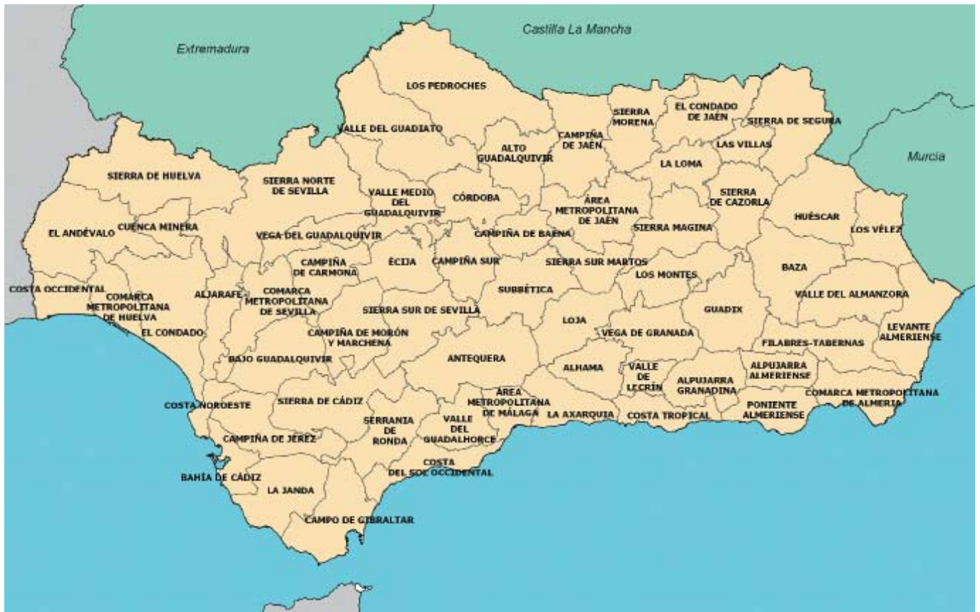
Comarcas Culturales de Andalucía.

Actualmente se está trabajando en la fase Fase 1 2 de registro, en 22 comarcas andaluzas, localizadas fundamentalmente en zonas de sierra, divididas en 11 áreas asignadas a un equipo de once especialistas en Antropología y patrimonio etnológico.