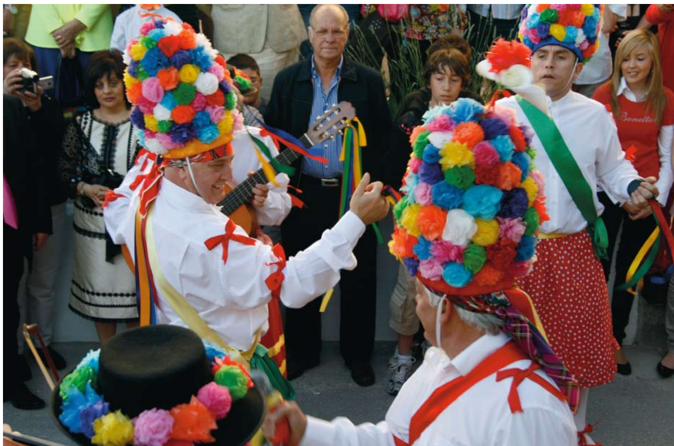
Danzantes de San Isidro en Fuente Tójar, Subbética Cordobesa (Córdoba).