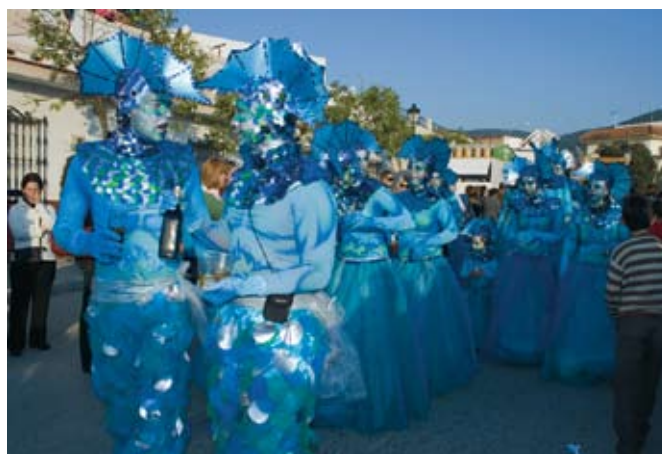
Carnaval de Puerto Serrano. Sierra de Cádiz (Cádiz).

la manera en la que participan y hacen posible la expresión, el ritual o la existencia de un determinado oficio o saber hacer, como artífices necesarios y fundamentales. Se registrarán las entrevistas y cuestionarios en profundidad que se les realice para obtener información oral.