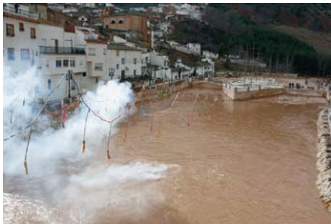
Fiesta de San Blas en La Puerta de Segura. Sierra de Segura (Jaén).