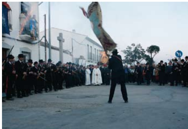
Romería de la Virgen de Luna. Pozoblanco. Valle de los Pedroches (Córdoba).