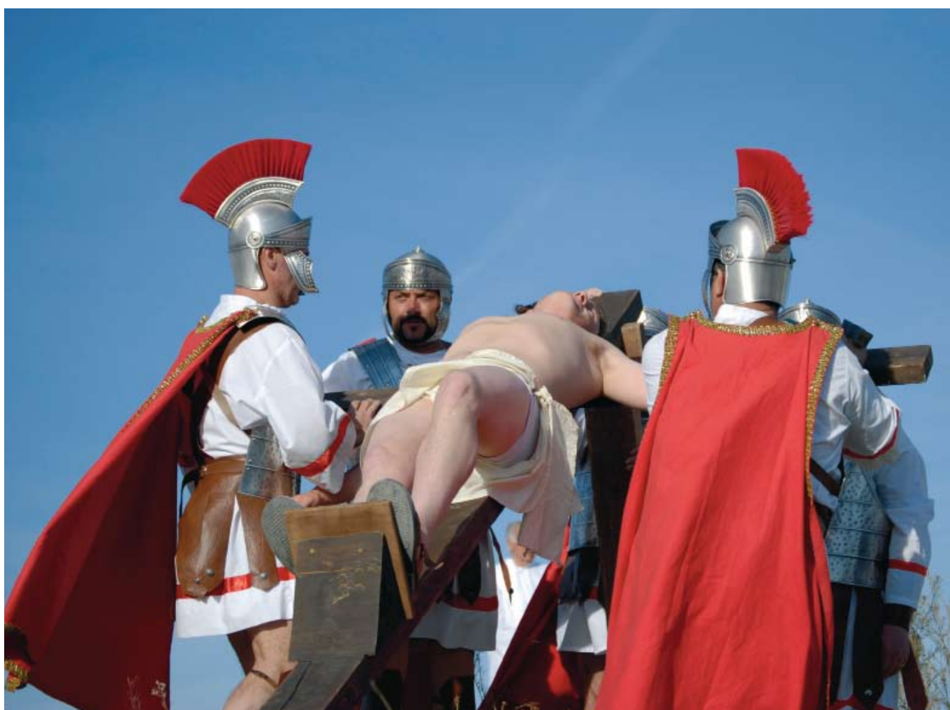
Semana Santa viviente de Cuevas del Campo, Granada.