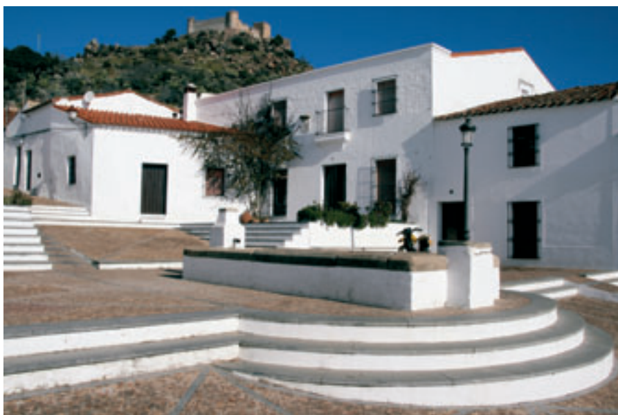
Plaza de la Misericordia. Burguillos del Cerro (Badajoz).

registro que cuenta con 4 156 elementos que sumados a la 2 040 del preinventario, hace que dispongamos en estos momentos de un total de 6 196 y de un archivo fotográfico de 107 057 imágenes.