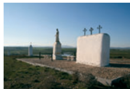
Calvario. Ahillones (Badajoz).