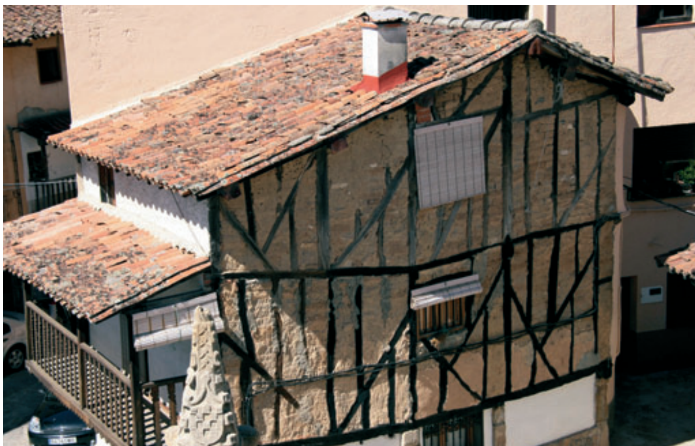
Detalle vivienda. Valverde de la Vera (Cáceres).

El trabajo realizado se convierte en un resorte fundamental de la administración autonómica para la gestión del patrimonio en aras de intervenciones, rehabilitaciones o musealizaciones adecuadas. El balance total del trabajo de campo ha generado un