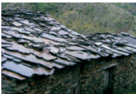
Hilera de viviendas. Fragosa, Nuñomoral (Cáceres).