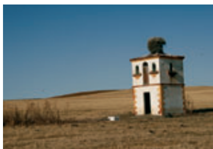
Palomar. Valencia del Ventoso (Badajoz).