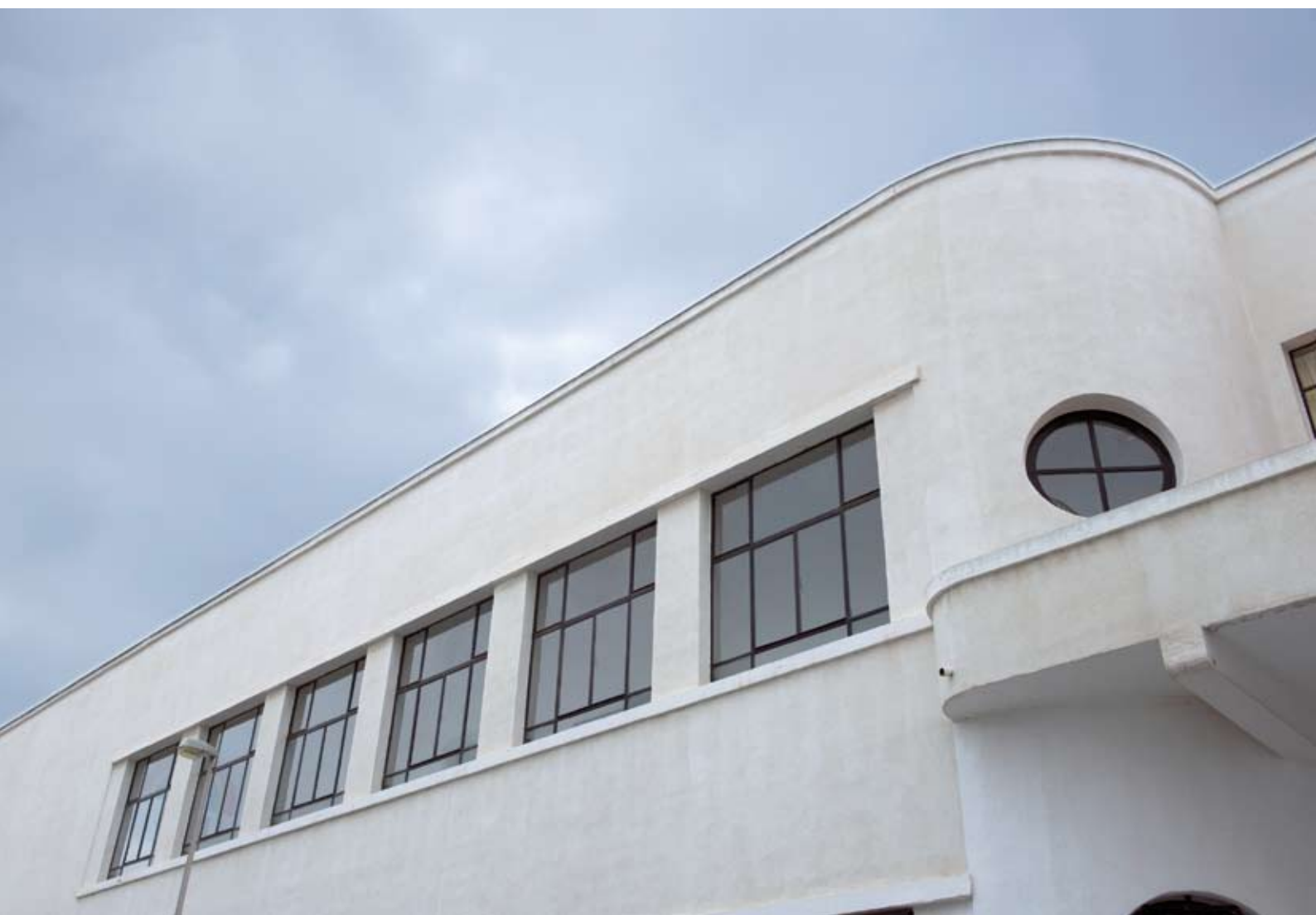
Vista exterior de la galería del colegio Lope de Vega.