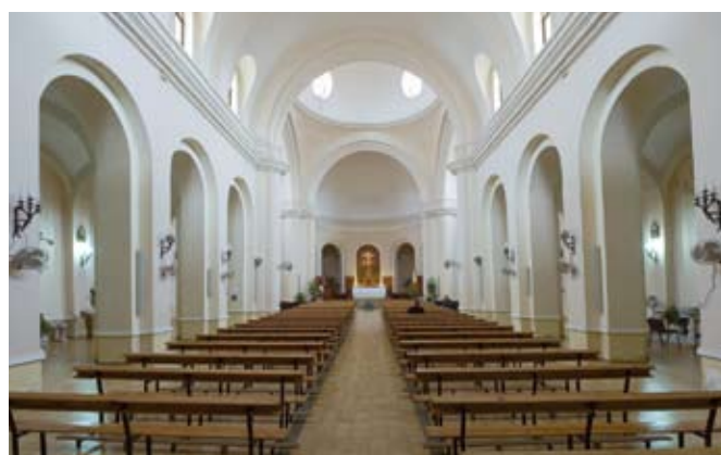
Arcos de la nave principal de la Iglesia de San Antonio de Padua.