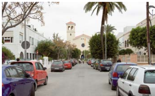
Vista de la Iglesia San Antonio de Padua desde la calle Castilla.

Esto se hace extensivo a la cuidada volumetría de los distintos tipos de viviendas desde el proyecto, que procuraban la ruptura de la calle corredor, la reducción de altura en las esquinas merced a la creación de porches abiertos a los jardines, así como terrazas