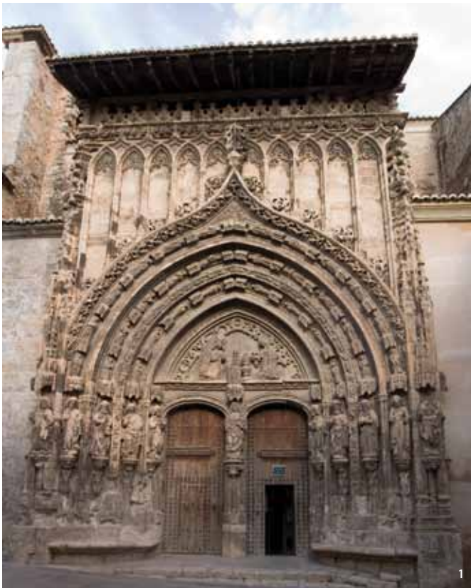
1. Portada de la Iglesia de Santa María, Requena (Valencia).

La fotogrametría arquitectónica de objeto cercano a partir de imagen y de láser escáner es la herramienta de medición indirecta más