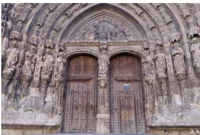
3. Vistas del modelo fotorrealístico 3D: a) vista lateral: b) vista inferior.