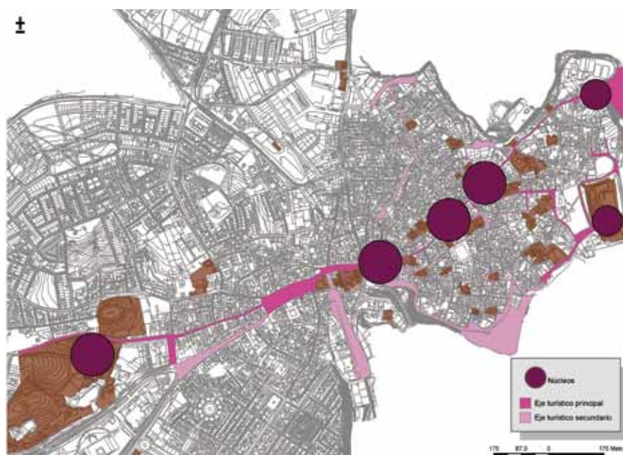
Núcleos y ejes turísticos de Carmona.

se tiene que trabajar con planteamientos de concertación y complementariedad, apuntándose como acciones relevantes: fijar con claridad los niveles y prioridades de intervención, adecuar el patrimonio y sus entornos, impulsar convenios de cooperación, aproximar la gestión cultural y la turística, reforzar los contenidos así como la funcionalidad de un centro de interpretación de la ciudad y del territorio.