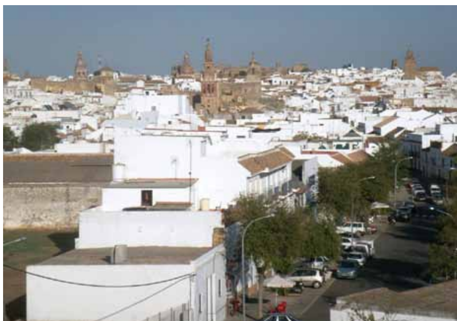
Vista general de Carmona desde la necrópolis romana.

2ª. Análisis y diagnóstico de la funcionalidad turística de los recursos patrimoniales. Se organiza en cuatro apartados: elementos patrimoniales, espacios urbanos, paisajes y recursos de patrimonio inmaterial. En cuanto a los primeros, se analizan las características y problemáticas básicas (titularidad, estado de conservación, posibilidades de visita, niveles de funcionalidad turística, dificultades de puesta en valor, etc.) y, a continuación, las problemáticas prioritarias según niveles de funcionalidad turística. Los espacios urbanos se caracte-