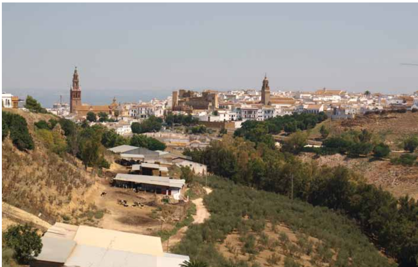
Vista de Carmona desde la cornisa sur de los Alcores.

El estudio realizado se aborda desde un marco de colaboración entre el Ayuntamiento de Carmona (áreas de Turismo y Cultura), el Instituto Andaluz del Patrimonio Histórico, como impulsor del proyecto, y el equipo del Grupo de Investigación Turismo, Patrimonio y Desarrollo de la Universidad Complutense de Madrid como responsable científico. El trabajo persigue responder a las demandas y necesidades del sector turístico y contribuir en la recuperación funcional del patrimonio cultural, partiendo de estrategias de complementariedad y equilibrio. Se ha