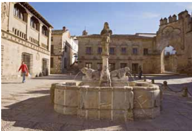
Plaza del Pópulo (Baeza).

No obstante, es durante el Renacimiento cuando Úbeda y Baeza logran su mayor singularidad como ciudades. Así en Baeza se desarrolla una importante y numerosa arquitectura civil, mientras en Úbeda se aprecia un profundo desequilibrio entre la cantidad y calidad de la arquitectura señorial en forma de residencias y palacios y la parquedad de las construcciones públicas: ayuntamiento y pósito. Baeza convierte su ciudad intramuros en un gran centro eclesiástico y educativo con la catedral, la residencia del obispo, el seminario, el colegio de la Compañía de Jesús y la universidad a los que se une el palacio de Jabalquinto; mientras que Úbeda desarrolla sobresalientemente la arquitectura señorial en forma de residencias y palacios como los de Francisco de Cobos, Juan Vázquez de Molina, Deán Ortega o el del marqués de Mancera, o la sacra Capilla del Salvador.