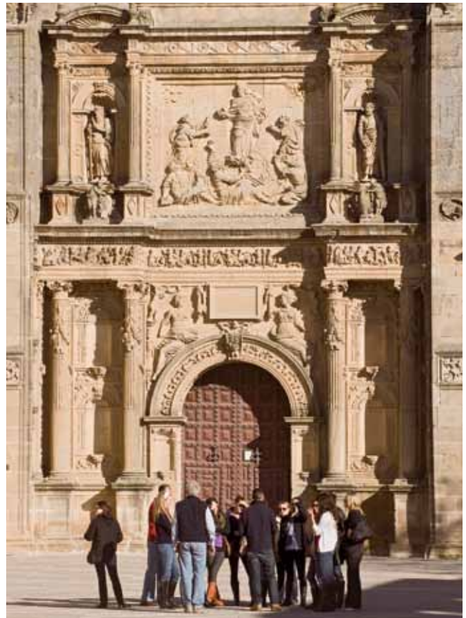
Iglesia del Salvador (Úbeda)

Además del VUE, todo sitio candidato a patrimonio mundial debe al menos cumplir con uno de los diez criterios de inscripción, los seis primeros corresponden a los bienes culturales y los cuatro restantes a los bienes naturales. Los criterios de inscripción en el caso de Úbeda y Baeza fueron el (II) y (IV); es decir, atestiguar un intercambio de valores humanos considerable, durante un periodo concreto o en el área cultural del mundo determinada, en los ámbitos de la arquitectura o de la tecnología, las artes monumentales, la planificación urbana o la creación de paisajes (criterio II), y ser un ejemplo sobresaliente de un tipo de construcción, de conjunto arquitectónico o tecnológico, o de paisaje que ilustre