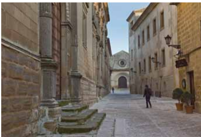
Calle Beato Ávila en Baeza