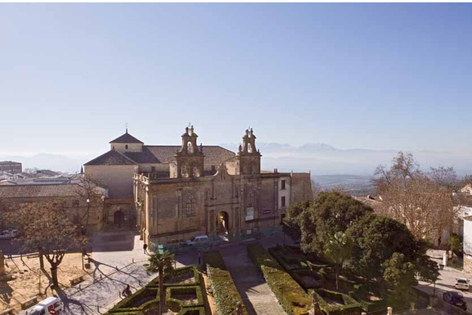
Plaza Vázquez Molina de Úbeda.