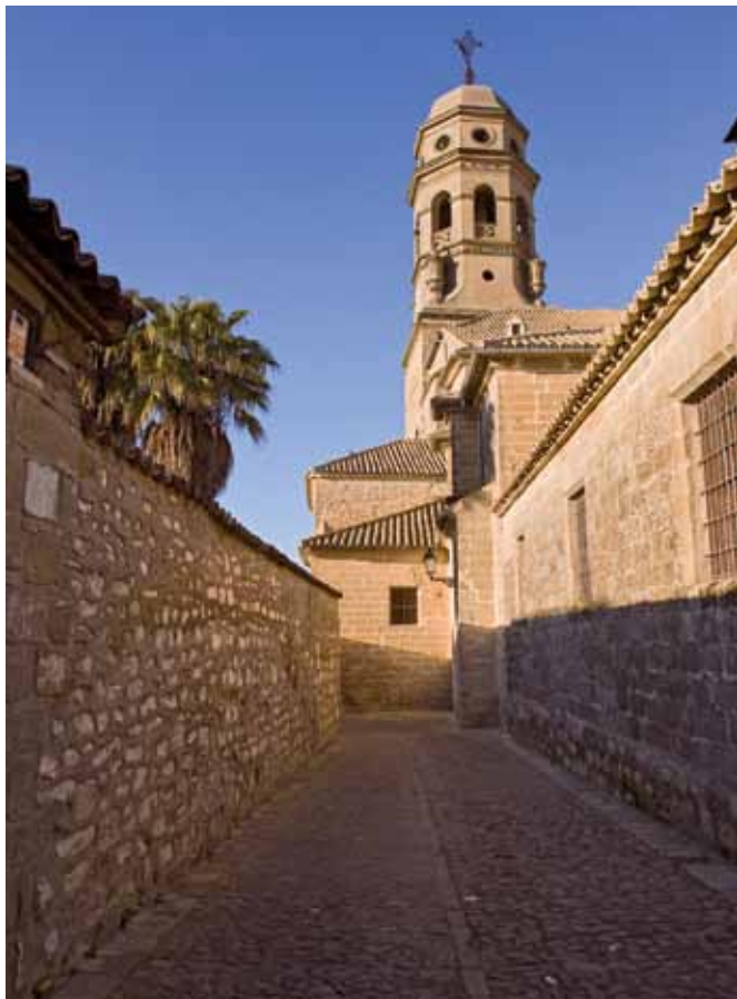
Catedral de Baeza