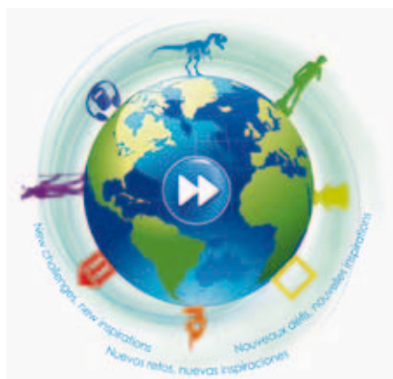
Detalle del cartel oficial de difusión del Día Internacional de los Museos 2012

En 2012, el tema del Día Internacional de los Museos será "Museos en un mundo cambiante. Nuevos retos, nuevas inspiraciones". Finalidad: interrogarse en cuanto al papel de los museos en una nueva sociedad donde constantemente nacen nuevos medios de comunicación, y descubrir o redescubrir cómo los museos se interesan en el futuro en términos de desarrollo sostenible.