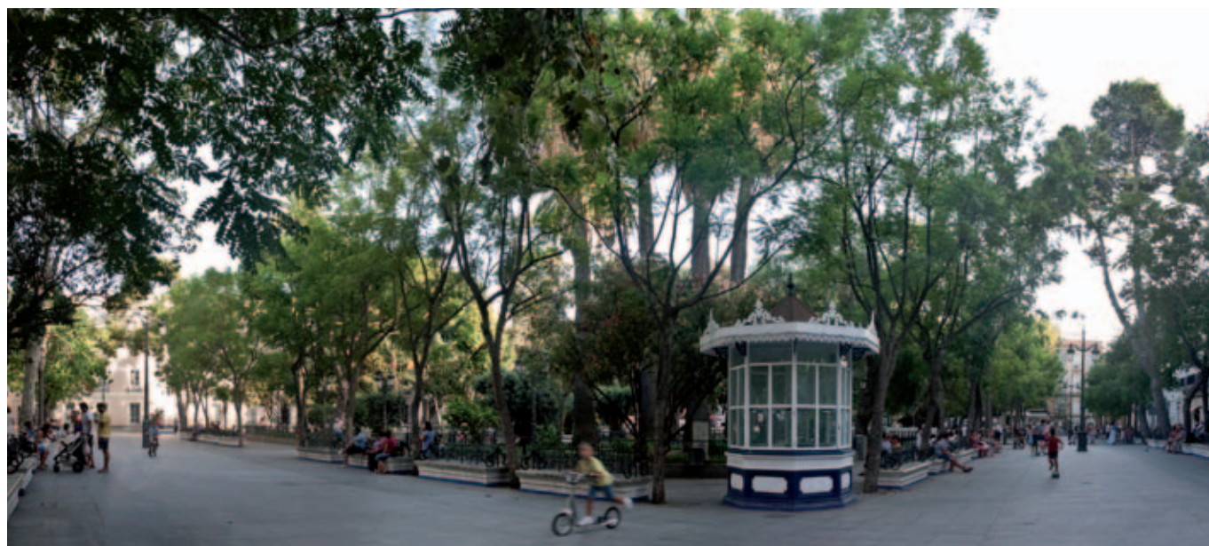
Plaza de Mina, jardín de interés cultural ubicado en Cádiz.

Olga Viñuales Meléndez Juan Antonio Pedrajas Pineda Consejería de Cultura