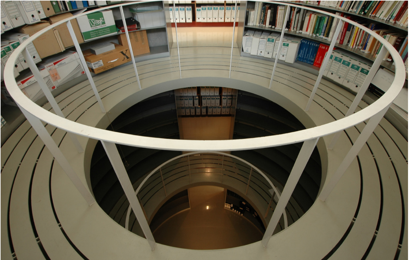
Interior del archivo del IAPH

Para la formación en línea se ha utilizado una plataforma, Moodle, como escenario de enseñanza-aprendizaje, empleando contenidos elaborados de forma didáctica, con esquemas, resúmenes y ejemplificaciones para su mayor comprensión y claridad. El curso tenía un doble enfoque: una parte teórica, en la que el alumnado debía leer los contenidos de los módulos, participar en los foros de debate, realizar las actividades y cuestionarios; y otra parte práctica, con la realización de un proyecto final individual tutorizado por el profesorado del curso: