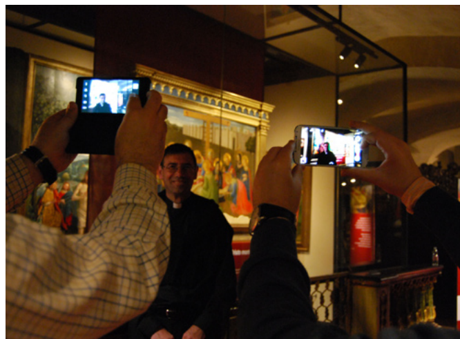
Lamentación sobre Cristo muerto de Fra Angélico. Exposición temporal del museo Diocesano de Turín (abril-junio de 2015)

En este proceso es esencial incluir a todas las partes interesadas en el diálogo acerca de este tema. Esto significa que se debería involucrar junto a la industria de los derechos de autor también a otras partes interesadas, por ejemplo instituciones de patrimonio como los