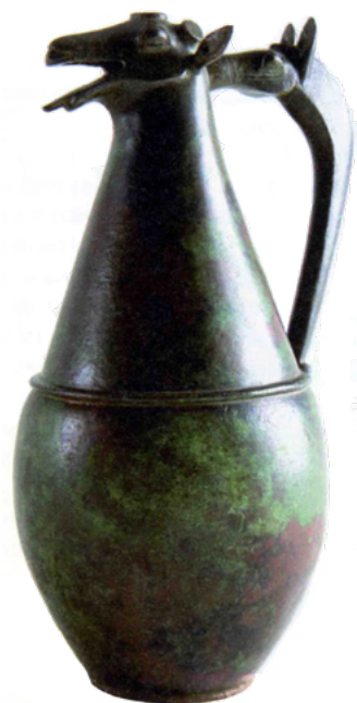
Ajuar de la tumba 18 de la Joya