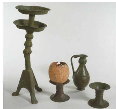
Ajuar de la tumba 17 de La Joya