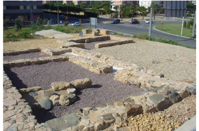
A la derecha, puesta en valor de la villa romana de La Almagra

en este aspecto, pues salvo los restos del conocido Muro de San Pedro, conservado por iniciativa privada, nada se había conservado en la ciudad hasta ese momento, lo que ha supuesto la destrucción de una muestra significativa de restos para comprender la evolución histórica de la ciudad. En los últimos años han sido varias las iniciativas orientadas hacia la conservación y difusión de restos, como son los casos de la calle Arquitecto Pérez Carasa, plaza de San Pedro, antiguo Colegio Francés, villa de La Almagra y Parque Moret. A pesar de ello, creemos que es todavía una asignatura pendiente que la ciudad en su conjunto debe superar con una apuesta más decidida a la hora de tomar decisiones sobre la integración de restos.