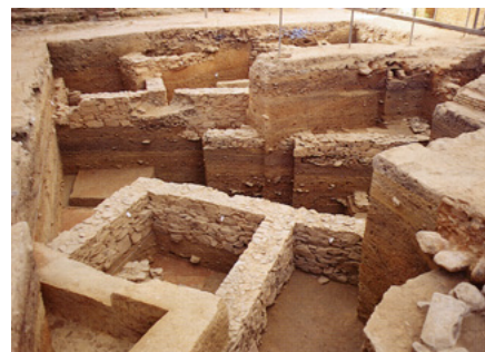
Restos protohistóricos hallados en la C/ Puerto, 12 | fuente RUFETE TOMICO; GARCÍA SANZ, 1995

Desde el punto de vista de la metodología aplicada, la primera cuestión a señalar, en consecuencia con lo anteriormente expuesto, es el hecho de que