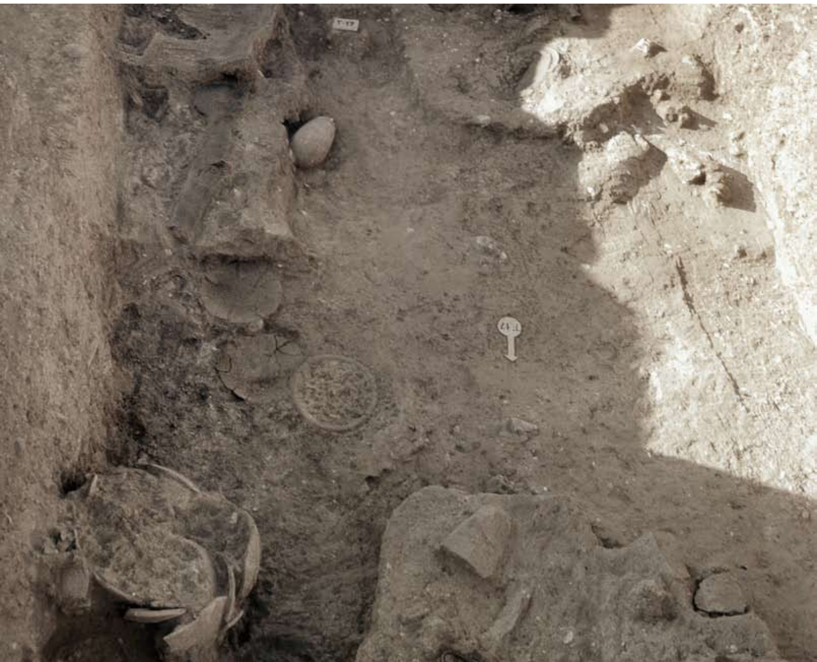
Excavación de la tumba 17 de La Joya