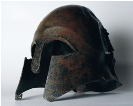
Casco corintio de la ría de Huelva