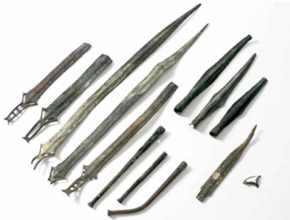
Bronces encontrados en la ría de Huelva