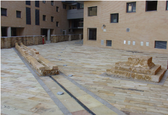
A la izquierda, puesta en valor de la necrópolis del Colegio Francés