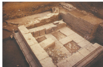
Basamento romano. Convento de las Agustinas | fuente FERNÁNDEZ JURADO; GARCÍA SANZ; RUFETE TOMICO, 1997