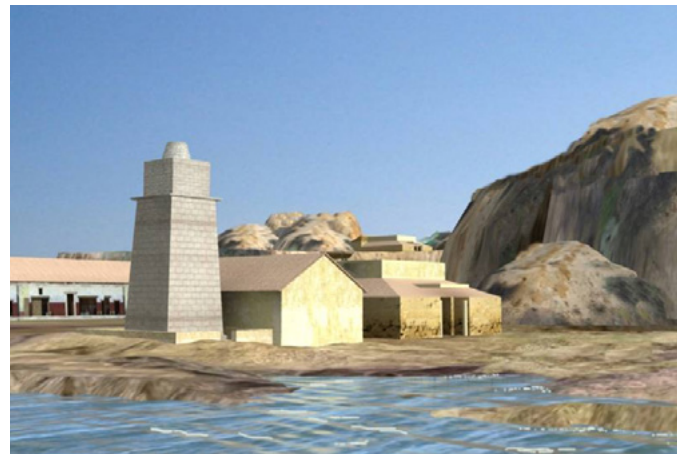
Arriba a la izquierda, necrópolis romana del Colegio Francés