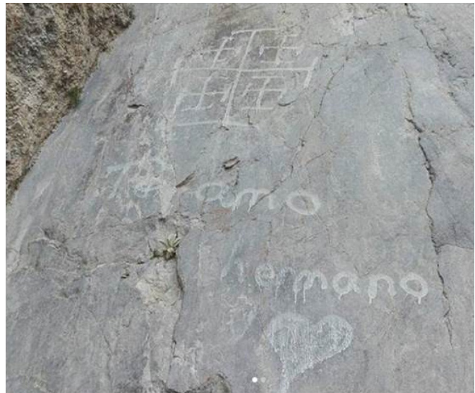
Pintadas y grafitis sobre el plano de La falla de Nigüelas (Granada), que es uno de los LIG de relevancia internacional en España

Se han recibido incidencias destacables en los LIG granadinos del yacimiento paleontológico de Cúllar-Baza y la falla de Padul-Nigüelas, que además es monumento natural. En la primera, su padrino, por segundo año consecutivo, ha informado de la dejadez administrativa que sufre y la necesidad de aplicar medidas urgentes preci-