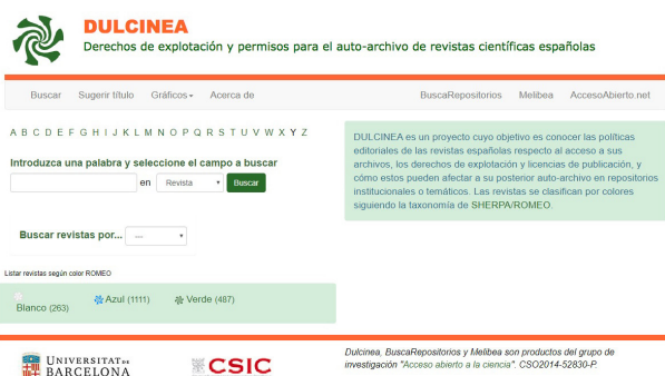
Portal del proyecto Dulcinea

sión en abierto de las publicaciones. La comprobación de qué versión (editorial o postprint ) permite la editorial, se realiza comprobando en Sherpa o Dulcinea y, si es necesario, contactando con la editorial. Normalmente se realiza desde el servicio de biblioteca o resolviendo dudas de los autores, en caso de que la política de la institución se decante por el autoarchivo.