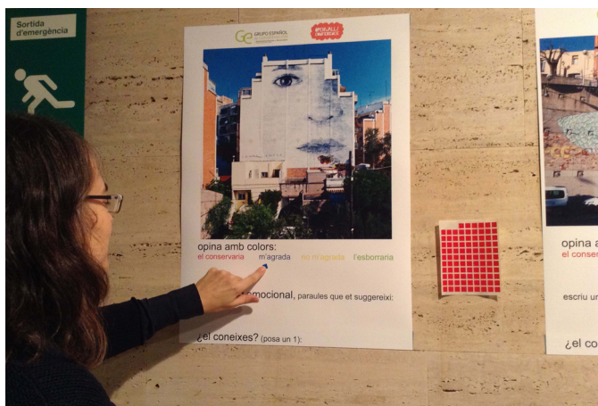
Votación del público asistente al festival Open Walls 2015 (CCCB, Barcelona) sobre algunos murales urbanos en Cataluña (abajo obra de J.R. Gerada, actualmente muy degradada)

• Úbeda García, M.I. (2016) Propuesta de un modelo de registro para el análisis y documentación de obras de arte urbano. Ge-conservación , n.º 10, pp. 169-179. Disponible en: https://ge-iic.com/ojs/index.php/revista/article/view/410 [Consulta: 09/04/2021]