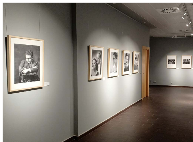
Sala de exposiciones Jalón Ángel

El premio consiste en 1.000 €, una estatuilla emblemática en bronce y un diploma para el ganador de cada categoría. Además, el jurado, formado por profesio-