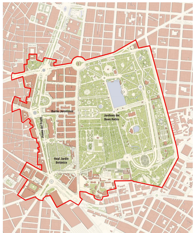
Ayuntamiento de Madrid, febrero 2020. Límite “Paisaje de la Luz: Paseo del Prado y Buen Retiro, paisaje de las Artes y las Ciencias” para expediente de candidatura a Lista del Patrimonio Mundial de la Unesco | plano Ayuntamiento de Madrid

2020, sobre el expediente de la candidatura en esta fase de evaluación, ICOMOS exponía: “la explicación de la idea unificadora de crear espacios urbanos verdes en dos etapas diferentes de la historia: desde el final del Renacimiento hasta la Ilustración y la propia Ilustración”. Recoge, en este argumento del Estado parte a la hora de justificar el criterio IV, un tema de imperiosa actualidad