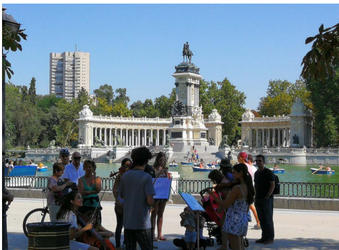
Lago del parque del Retiro, 2018