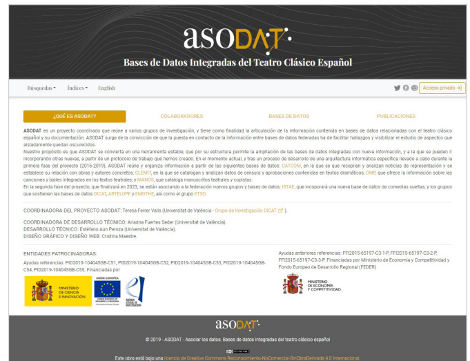
Página de inicio de ASODAT

La magnitud del patrimonio conservado en relación con el teatro clásico español es un hecho bien conocido entre los estudiosos de los siglos XVI y XVII. Este patrimonio no solo se sustenta en textos dramáticos impresos y manuscritos, sino también en documentos de diverso tipo, que dan cuenta de la intensa actividad que se generó en torno a este fenómeno cultural (noticias de representación, contratos de formación o de traslado de compañías, conciertos con los arrendadores de los corrales o con los organizadores del Corpus, libros de cuentas de palacio, compraventa de comedias, testamentos, inventarios, etc.). Se trata de un patrimonio literario y documental de primer orden que para ser comprendido en toda su complejidad necesita ser abordado en conjunto. La incorporación de las nuevas tecnologías al ámbito de las Humanidades ha creado nuevos horizontes de investigación y ha hecho posible poner en relación datos de una manera organizada, permitiendo conexiones entre ellos que de otro modo sería difícil establecer. En esta dirección, desde la década de 1990, se iniciaron varios proyectos en la Universidad de Valencia que han tenido por objeto la creación de bases de datos, a partir de información relacionada con el teatro español y su práctica escénica. Así surgieron las bases de datos DICAT, que recoge la actividad de alrededor de 5.000 profesionales del teatro, ARTELOPE, base de datos de argumentos y motivos del teatro de Lope de Vega, que incluye también edicio-