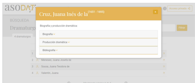
Resultado de búsqueda por autor

La búsqueda por títulos evidencia de manera clara los beneficios de la asociación, pues permite la consulta en un solo registro de una síntesis de la información relacionada y contenida en todas o en algunas de las diferentes bases de datos federadas, y brinda la posibilidad de acceder a toda ella o seleccionar aquella que interese. A día de hoy, los registros de títulos publicados alcanzan las 3.510 obras, que se corresponden con 5.708 variantes de título. La búsqueda, por ejemplo, por el título El perro del hortelano nos permite saber si esta obra puede encontrarse citada por otros títulos (en este caso, por los de Amar por ver amar y La condesa de Belflor ); a qué autores ha sido adjudicada (en este caso, a Lope de Vega y, en alguna ocasión, a Moreto) y qué resultados ofrecen los estudios métricos y estilométricos sobre