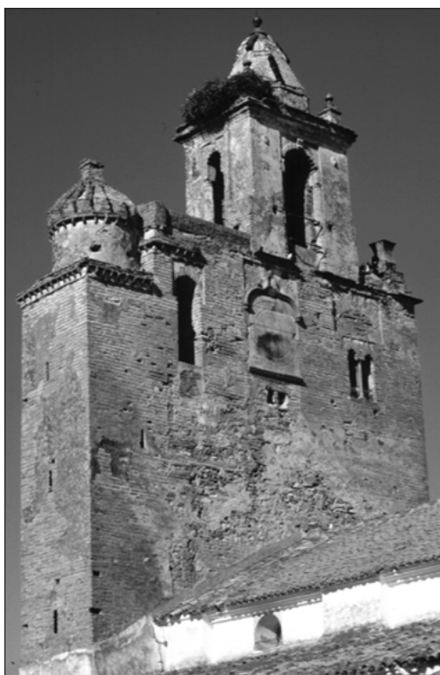
Iglesia de Ntra. Sra. de las Nieves de Alanís

La Iglesia Parroquial de Nuestra Señora de las Nieves de Alanís, presenta un estructura primitiva gótico-mudéjar del S. XIV, como demuestran las bóvedas del presbiterio, las dos portadas y la torre fachada de los pies del templo. Durante el S. XVI se efectuaron en ella algunas remodelaciones, teniendo como resultado el levantamiento de la Capilla de los Melgarejos. En el XVIII fue cuando se produjeron las principales alteraciones, sobre todo las realizadas tras el terremoto de Lisboa de 1755 con gran acierto, conformando una armónica simbiosis entre ambos estilos que permite considerarla como uno de los templos más singulares de la Sierra Norte sevillana. Las obras fueron realizadas por el maestro alarife José Candil, siguiendo los informes de 1757 del Maestro Mayor del Arzobispado Pedro de San Martín, informándose dos años después la finalización de las mismas por Pedro de Silva. Estas obras consistie-