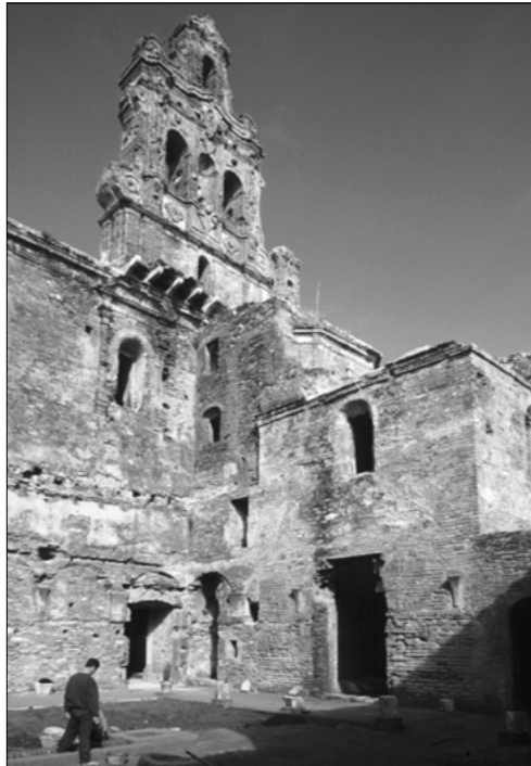
Espadaña de la Iglesia de la Cartuja de Cazalla de la Sierra

Ubicada en la ladera del monte, queda abrazada por las vías principales de la población, configurando sus espacios públicos de mayor significación en un en-