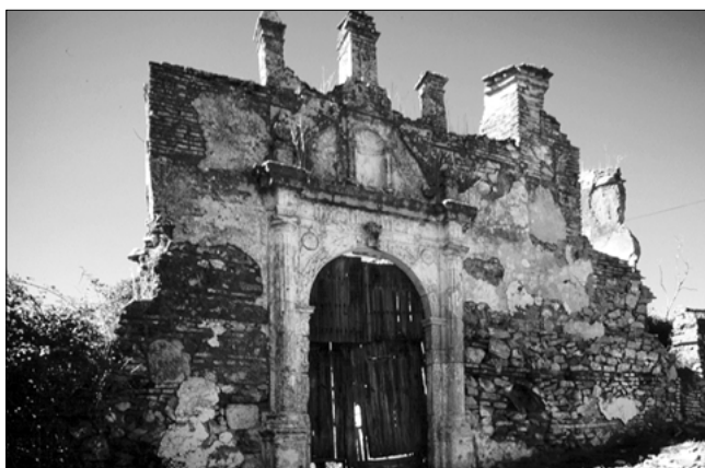
Fachada fortificada de la Ermita de la Hiedra. Constantina

La Ermita de la Hiedra de Constantina fue originalmente una fortificación militar de época medieval posteriormente transformada para uso religioso. Es uno de los ejemplos más significativos de la arquitectura defensiva en la zona junto a su recinto defensivo y formando parte del conjunto de fortificaciones del Cerro del Castillo, el del Almendro y el denominado "Firrix", del cinturón defensivo de Constantina. En la actualidad se encuentra afectada por dos declaraciones como Monumento: la del mencionado Decreto de 22 de abril de 1949 y por la declaración como Monumento Histórico Nacional por Real Decreto de 23 de febrero de 1983.