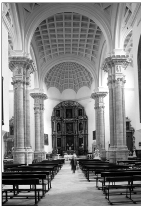
Bóvedas renacentistas de la Iglesia de Ntra. Sra. de la Consolación de Cazalla de la Sierra

auge económico y al alza de la población con un lenguaje renacentista que respetó la traza original. No hay noticias documentales acerca de los maestros que realizaron esta intervención comenzada en 1538, aunque, por sus características y calidad técnica, puede relacionarse con intervenciones dirigidas por los Maestros Mayores de la Catedral Hispalense Diego de Riaño y Martín Gaínza. En este edificio, la superposición de estilos permite apreciar tres fases superpuestas: la mudéjar, mantenida en los pies y la cabecera, que responde al tipo generalizado de las iglesias medievales de la Sierra Norte de tres naves, con torre-fachada y ábside poligonal; las muestras de estilo renacentista, apreciadas fundamentalmente en las reformas del interior que transforman totalmente la primitiva construcción medieval en la que destacan los soportes con sus remates derivados de los empleados en la Sacristía Mayor de la Catedral Hispalense y el sistema de cubiertas de bóvedas vaídas con casetones, pudiéndose considerar uno de los mejores ejemplos del renacimiento andaluz por su extraordinaria factura. En el siglo XVIII, este templo sufre una tercera transformación realizada por Pedro Francisco López, siendo una intervención que se limitó al enmascaramiento de las primitivas cubiertas del tramo de los pies y al levantamiento de las portadas laterales barrocas.