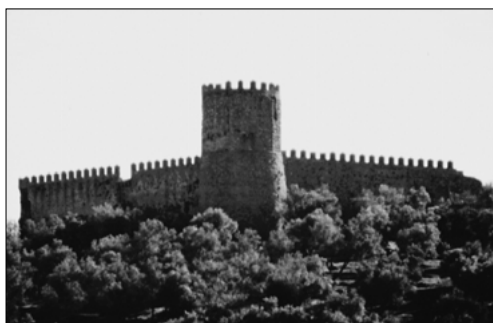
Castillo de Alanís

Los castillos en la Sierra Norte de Sevilla son de gran importancia para comprender el proceso secular de la Reconquista en el Reino de Sevilla. Integrados en la llamada "frontera Norte de Sevilla", formaban una banda de fortalezas de gran protagonismo político y militar que se extendía por la frontera con Portugal al Noroeste y por todo el norte del alfoz de la Sierra Norte en la Sevilla de la Baja Edad Media. La influencia que el medio físico ejerció sobre su localización estuvo marcada por las condiciones geográficas que a su vez orientaron las vías de comunicación y los asentamientos urbanos. Estos castillos