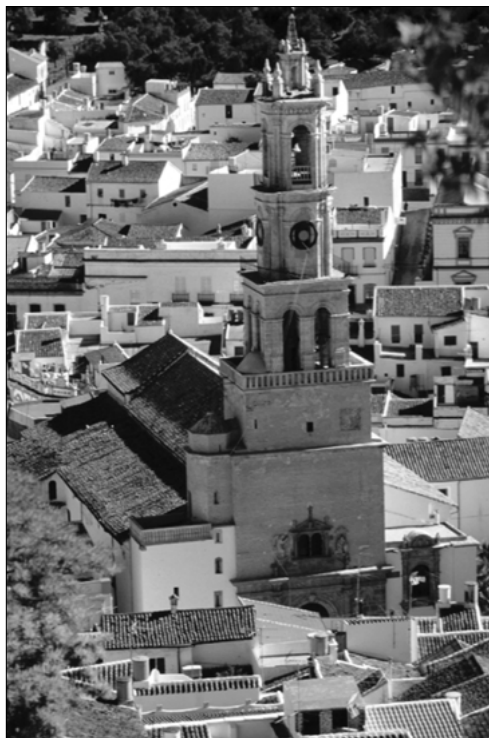
Torre-fachada de la Iglesia de la Encarnación de Constantina

torno de calidad estética notable, característica que ha obligado a la propuesta de delimitación de su entorno de protección. Asimismo, se pretende vincular al inmueble los siguientes bienes muebles como consustanciales a su historia: la máquina del retablo de la Inmaculada Concepción, obra barroca anónima del XVIII; la cajonera de la Sacristía, de principios del XVIII y estilo barroco; la Reja de la Capilla de San José, obra barroca del siglo XVII; la Pila Bautismal, labrada en mármol de estilo barroco y fechada en 1693 y el aguamanil del pasillo a la Sacristía, pieza renacentista ejecutada en el mismo material.