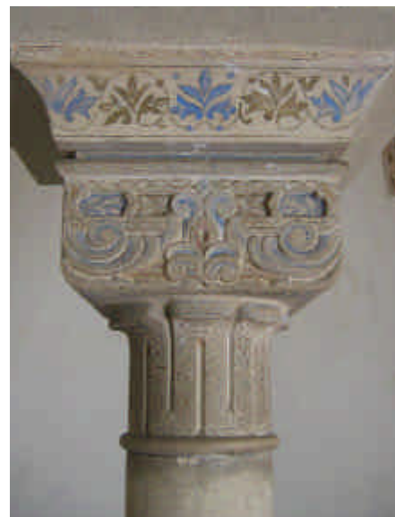
X Capitel. Sala del Patio de los Naranjos. Alcazaba de Málaga / ANTONIO MARTÍN PRADAS

El Legado Andalusi tiene como ideas clave recuperar y difundir la civilización hispano-musulmana y lograr su reconocimiento como parte de nuestro acervo cultural