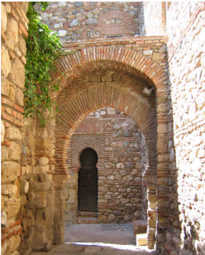
W Camino superior de la Alcazaba. Málaga forma parte del Itinerario Cultural de los Almorávides y Almohades

J Ruta de Almohades y Almorávides: Esta ha sido la última en materializarse, surca el más completo y sugerente repertorio de paisajes, espacios protegidos y parques naturales. Abarca 29 municipios, desde el municipio de Tarifa situado en la provincia de Cádiz, pasando posteriormente por la Axarquía malagueña y llegando hasta Granada. Es la mejor forma de descubrir la herencia de los Almorávides y Almohades, dinastías que dejaron su impronta en numerosos vestigios arquitectónicos en la zona.