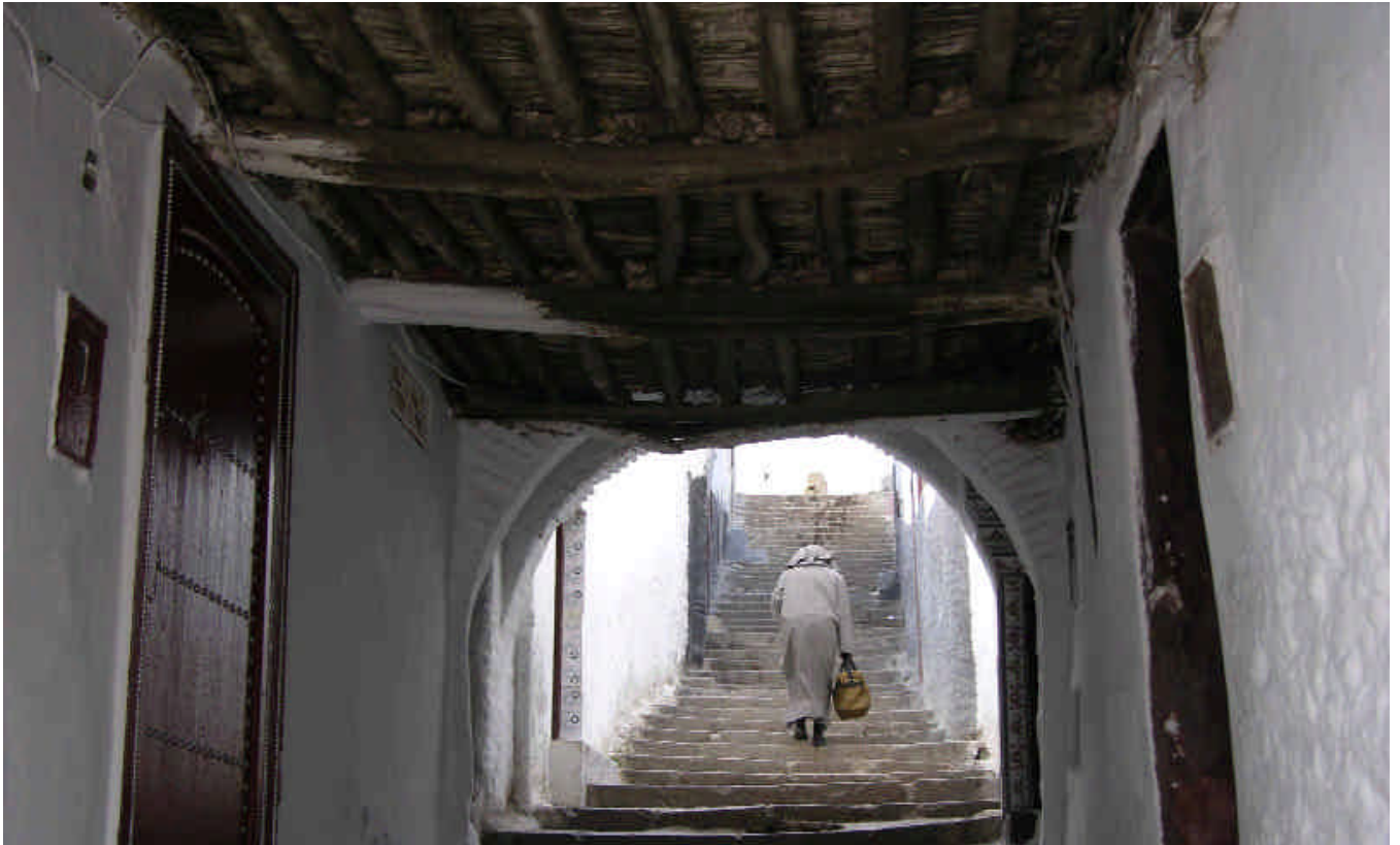
W Tetuán (Marruecos), ciudad con un urbanismo particularmente sinuoso donde se alternan calles cubiertas con otras al aire libre, integrada en el Itinerario Cultural de los Almorávides y Almohades / VÍCTOR FERNÁNDEZ SALINAS

No sólo catalogamos los monumentos, las influencias arquitectónicas y las ciudades, sino que queremos dar a conocer relaciones comerciales, culturales y sociales