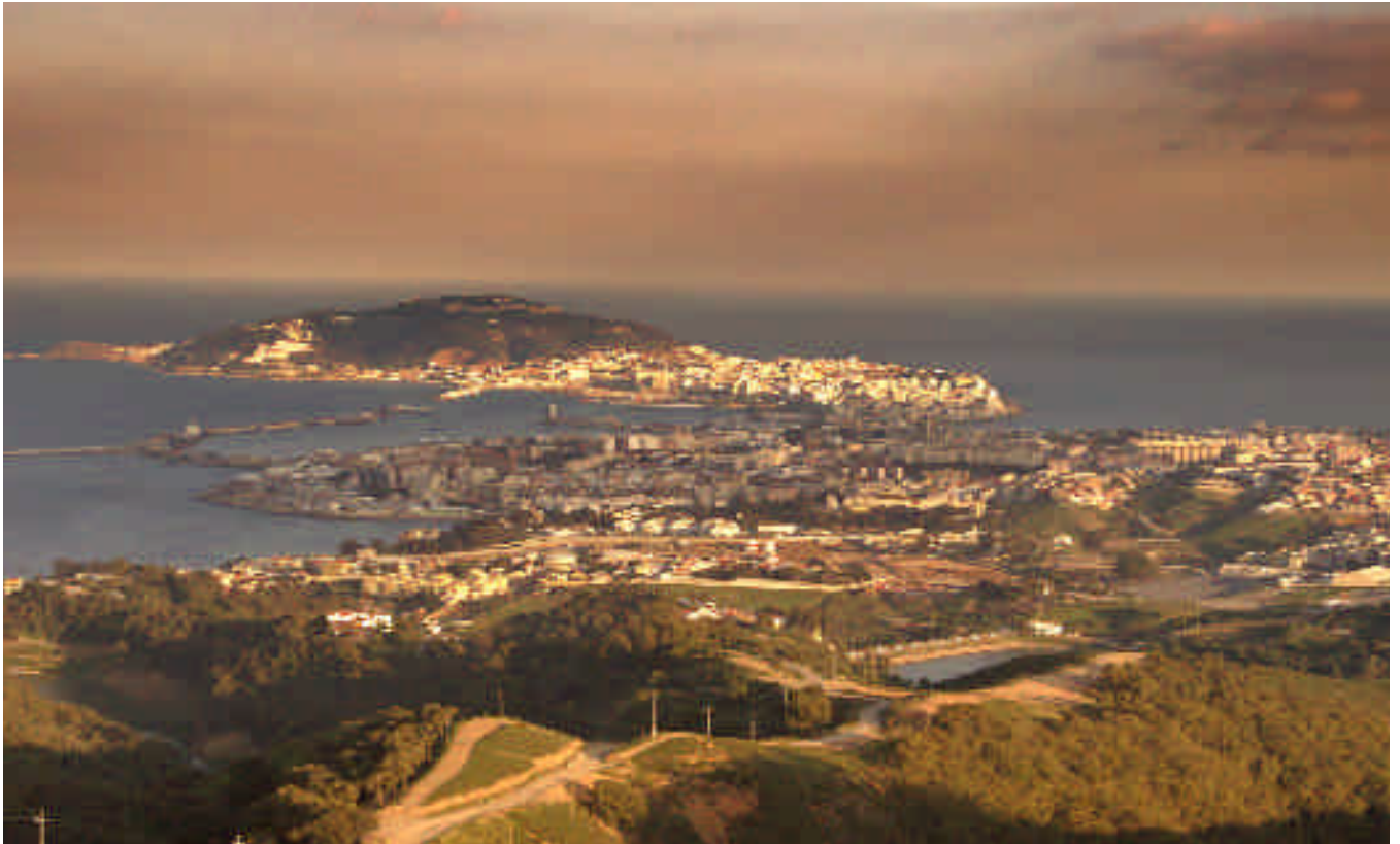
W Vista general de Ceuta, una de las ciudades del Itinerario Cultural de los Almorávides y Almohades en el continente africano