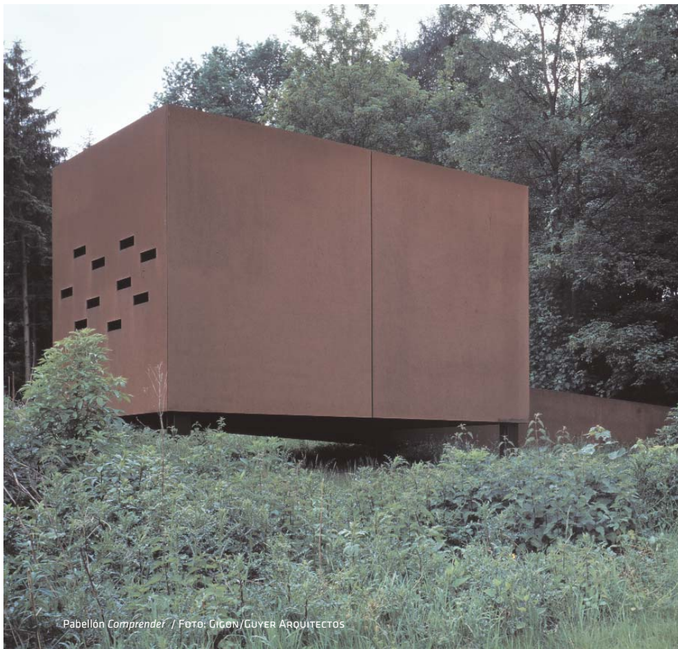
Pabellón Comprender / Foto: GIGON/GUYER ARQUITECTOS