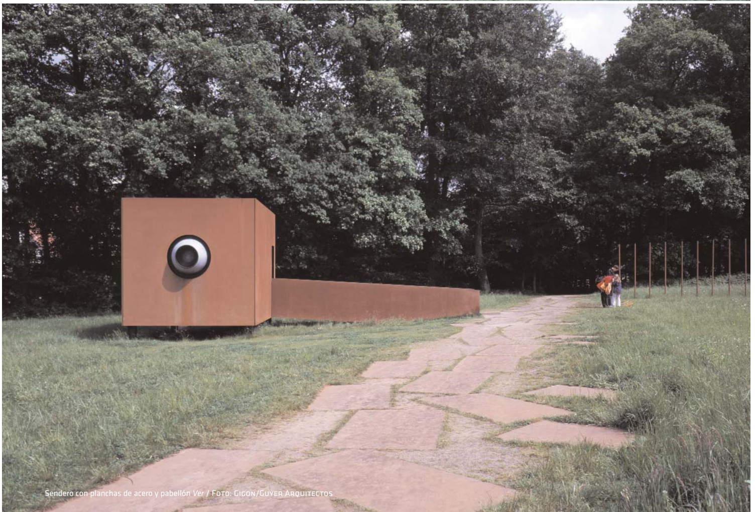
Sendero con planchas de acero y pabellón Ver