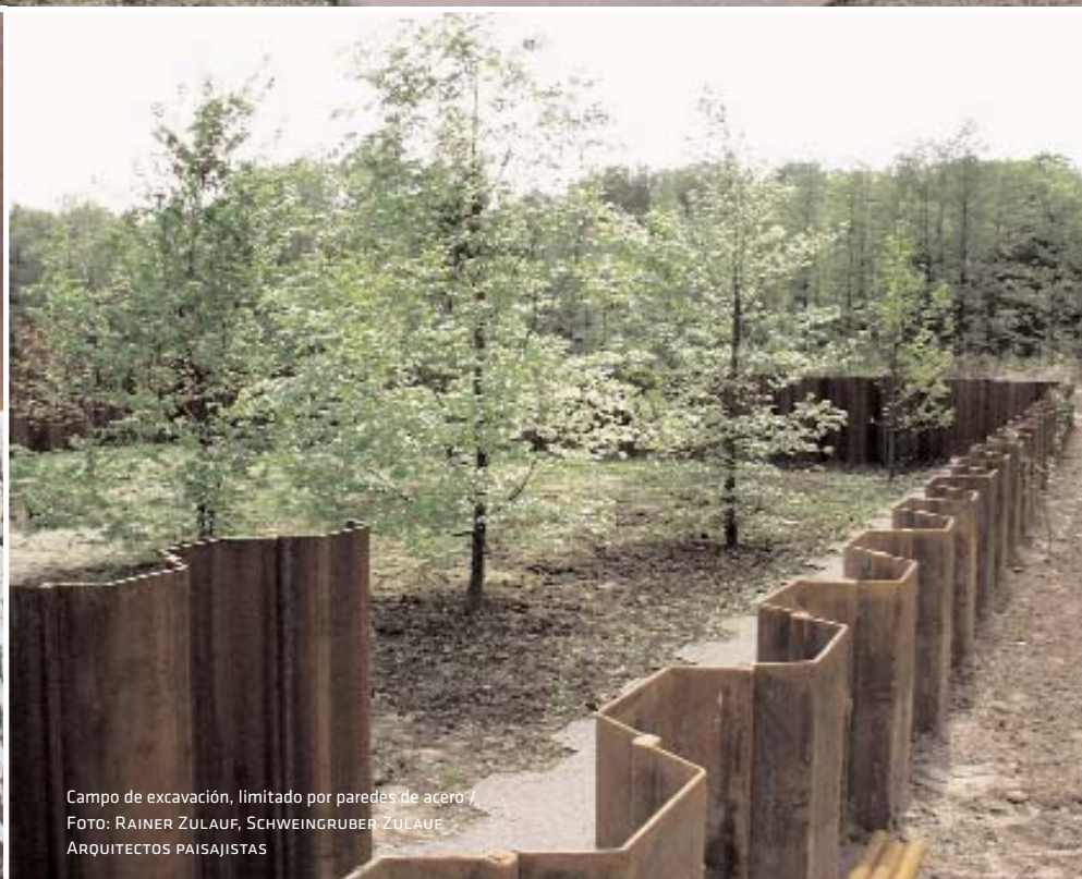
Campo de excavación, limitado por paredes de acero