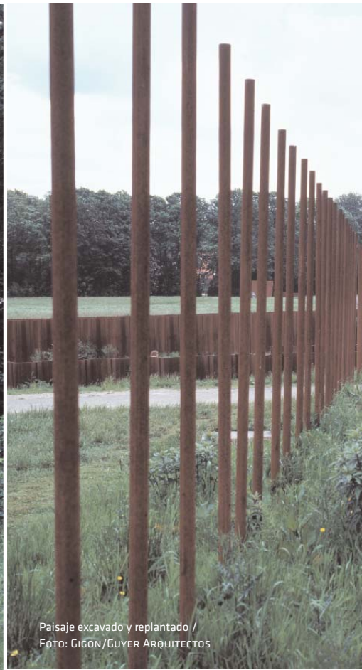
Paisaje excavado y replantado