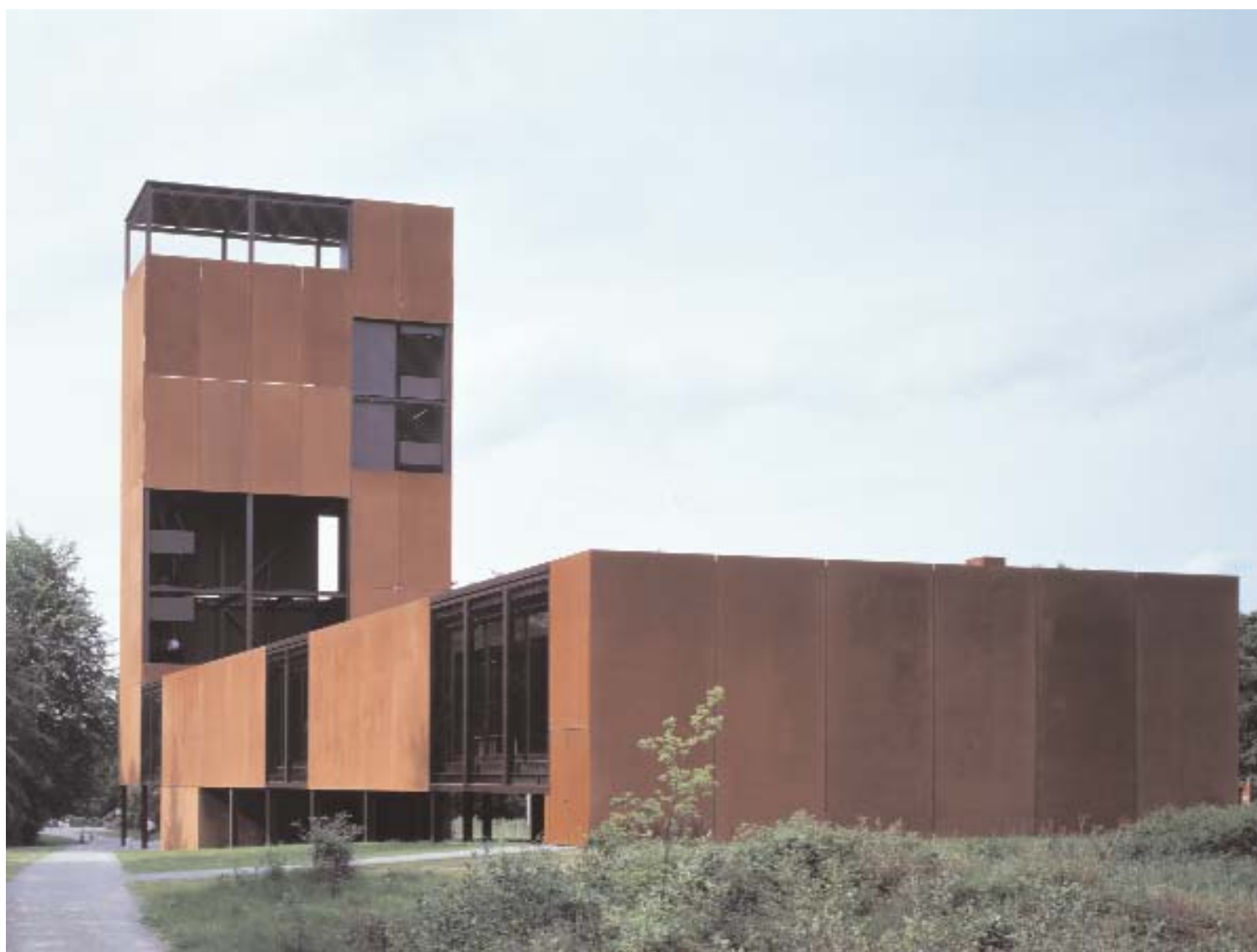
📍 Exterior del museo / Foto: GIGON/CUYER ARQUITECTOS