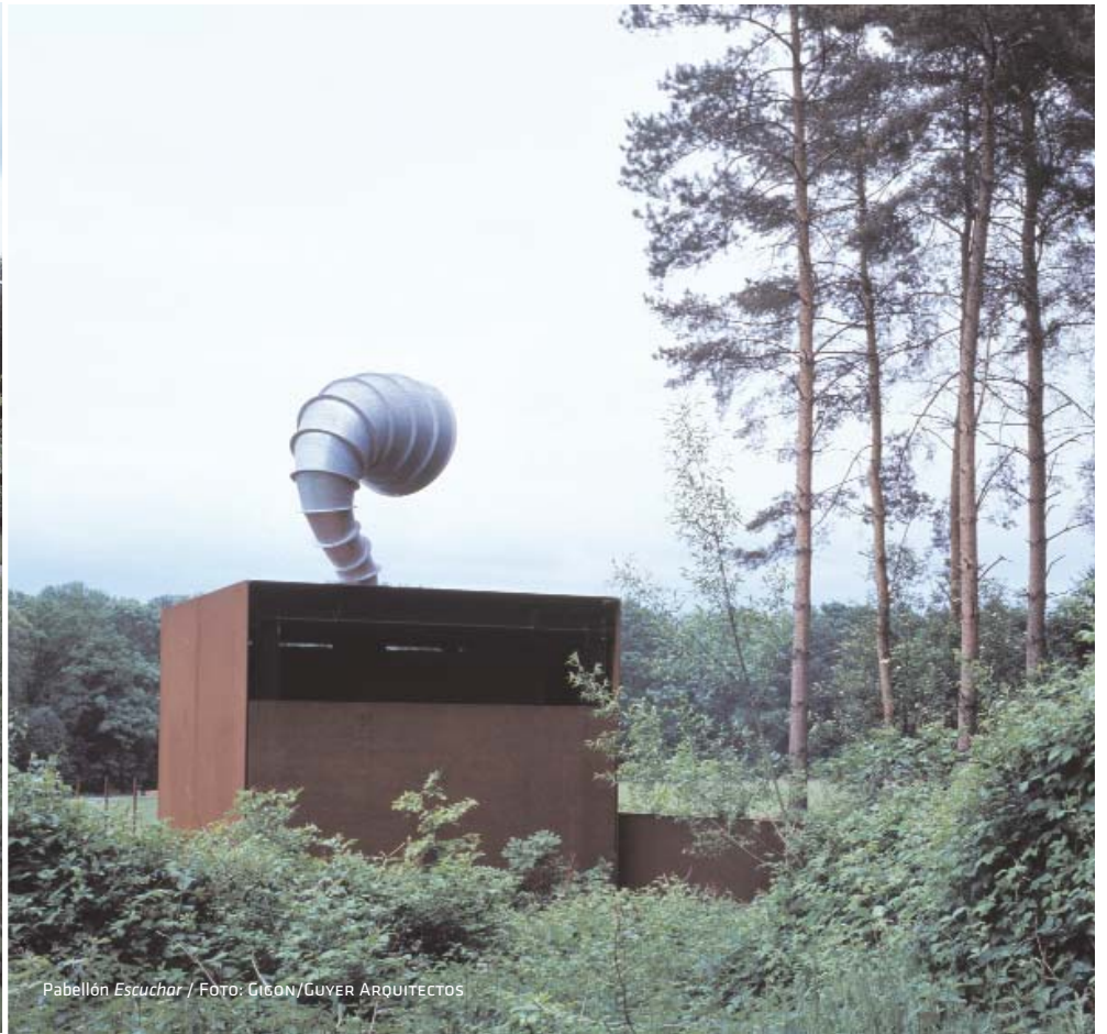
Pabellón Escuchar / FOTO: GIGÓN/GUYER ARQUITECTOS