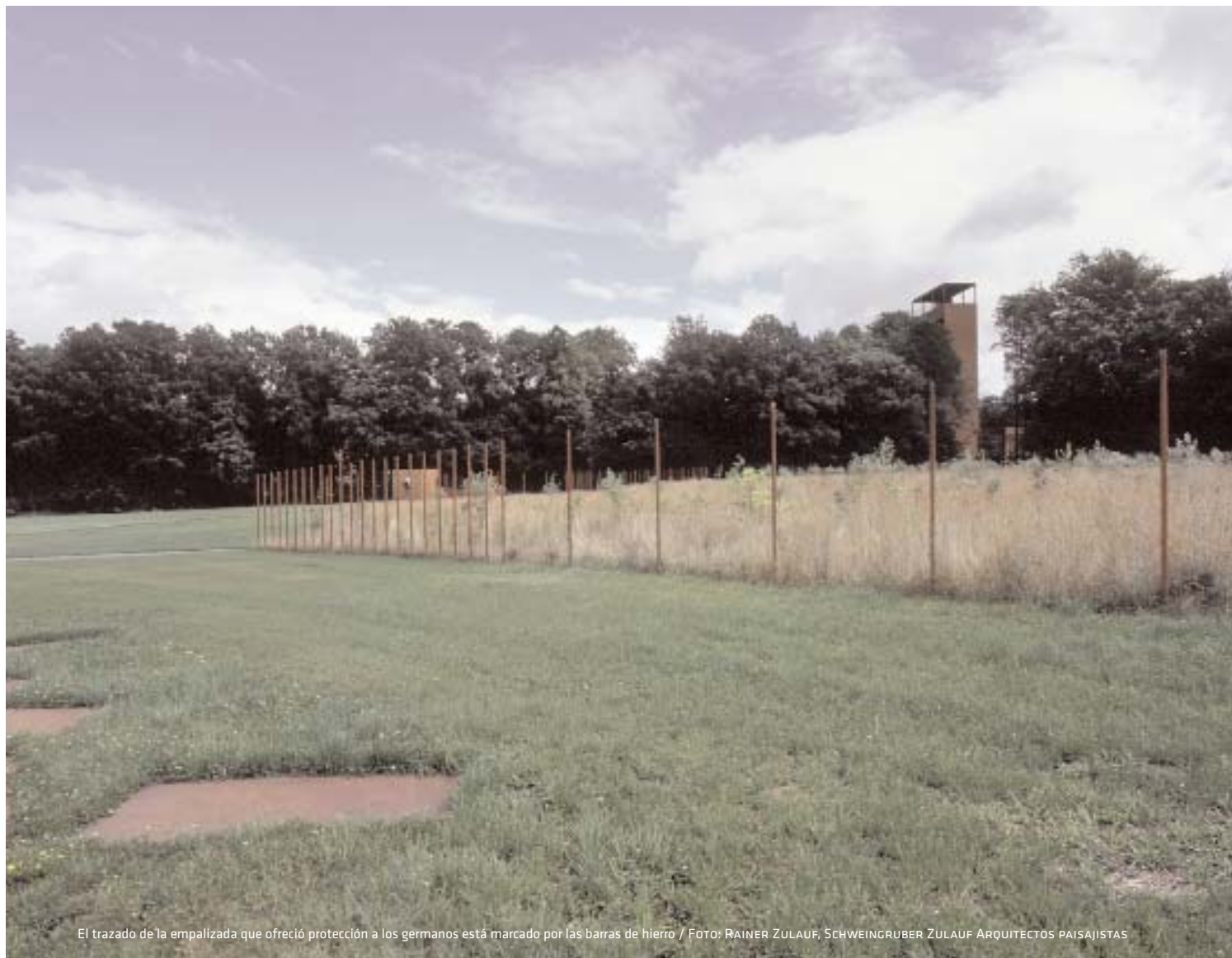
El trazado de la empalizada que ofreció protección a los germanos está marcado por las barras de hierro