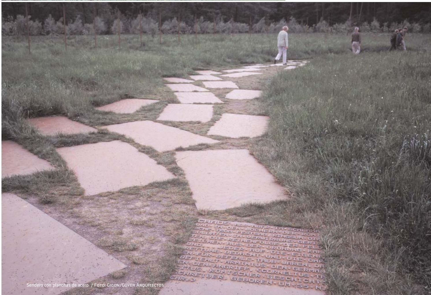
Sendero con planchas de acero

CHARLES ALS REBER IM SCHLEIMM UND IN DEN LÜCHERN DER RUMM SOLCHTEN IN VERWIRRUNGSUM DIE TEN DIE REIHENFOLGENDER GERI ZEICHEN AUS DER ORDNUNG FELD UND JEDER DER ORDNUNG KAI RETTUNG BEACHT AUF DIE EIGENE BEFÜR BEFEHLE TAUB UND DIE OHN EN DEN ANGRIFF CORNELIUS GERMAN SITUS RÖMISCHER GESCHICHTE SCHREIBER GEBOREN UM 55 N CHR Y