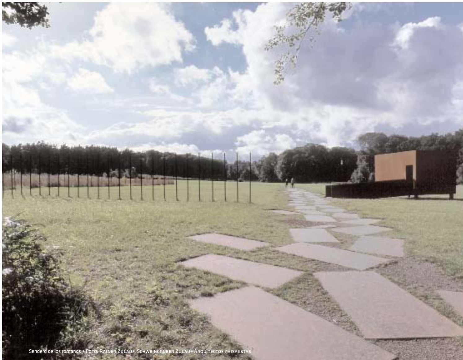
Sendero de los romanos / FOTO: RAINER ZULAUF, SCHWEINGRUBER ZULAUF ARQUITECTOS PAISAJISTAS