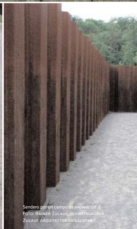
Sendero por un campo de excavación / FOTO: RAINER ZULAUF, SCHWEINGRUBER ZULAUF ARQUITECTOS PAISAJISTAS