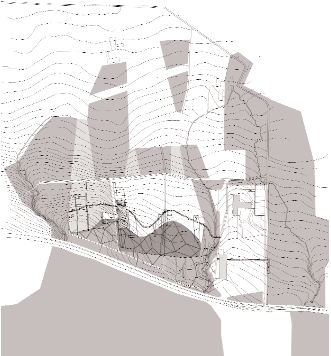
④ Esquema conceptual de la intervención / PLANO: SCHWEINGRUBER ZULAUF LANDSCHAFTSARCHITEKTEN