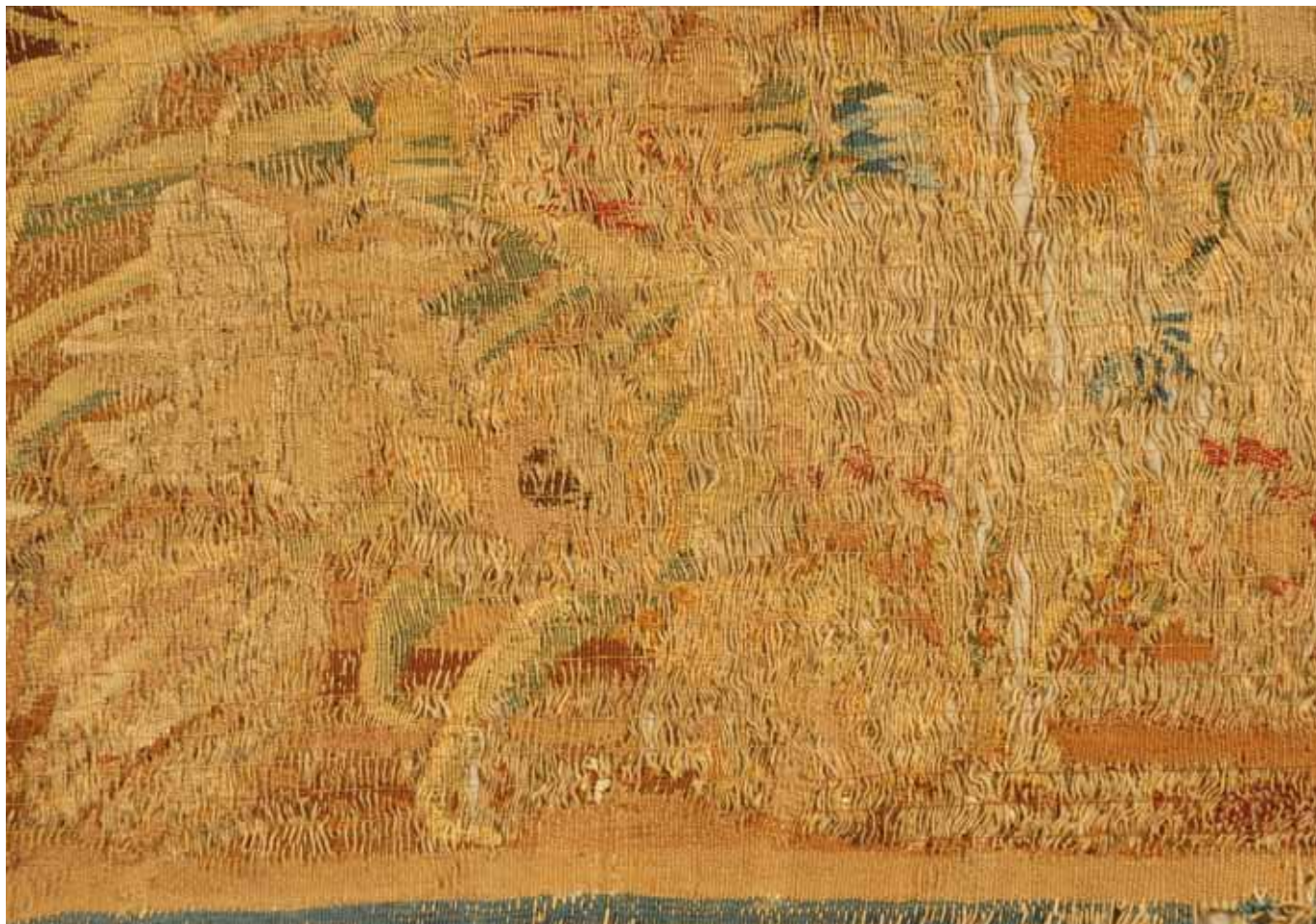
Detalle de consolidación mediante puntos de restauración.

maestro Franz Van den Hecke (1620–1684) o de su taller, como se ha explicado anteriormente.