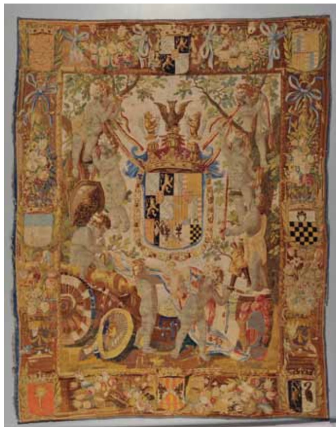
Sexto tapiz, general reverso.

largo, por 5 cm de ancho. Ésta, a su vez, llevaba unido un cordón fijado mediante puntadas discontinuas, en cuyos huecos sin fijar iban introducidos los clavos del que pendía el tapiz.