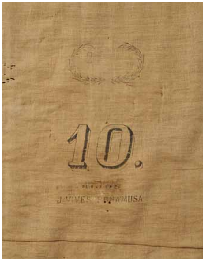
Detalles de impresión en el forro.