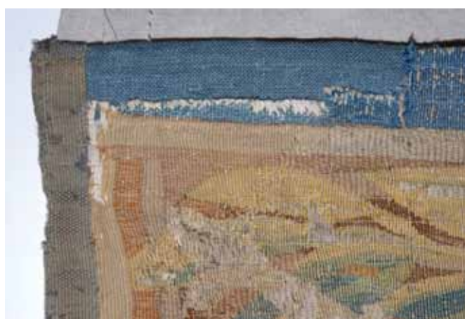
Reconstrucción del borde.

La intervención se limitó al margen de la pérdida, sin falsear y adoptado un claro carácter diferenciador