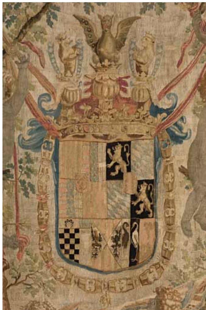
Escudo central del tapiz heráldico.

composición de tejidos establecidos de la siguiente forma: una banda en la parte superior, dos laterales y una en la parte inferior comprendida entre estas dos, todas ellas enmarcando el borde del tapiz. En el centro se apreciaba otra banda longitudinal que no cubría por completo toda la superficie del mismo, sino que dejaba al descubierto el reverso mediante dos bandas longitudinales a ambos lados.