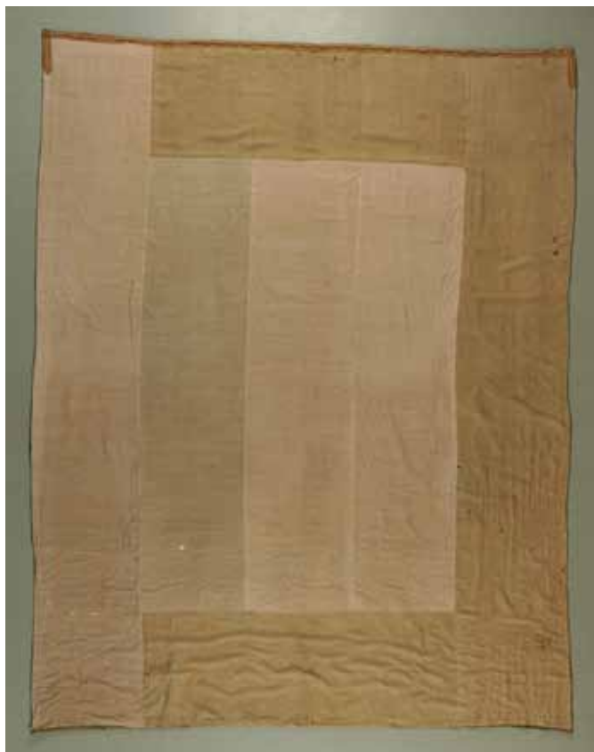
Forro sexto tapiz, general.