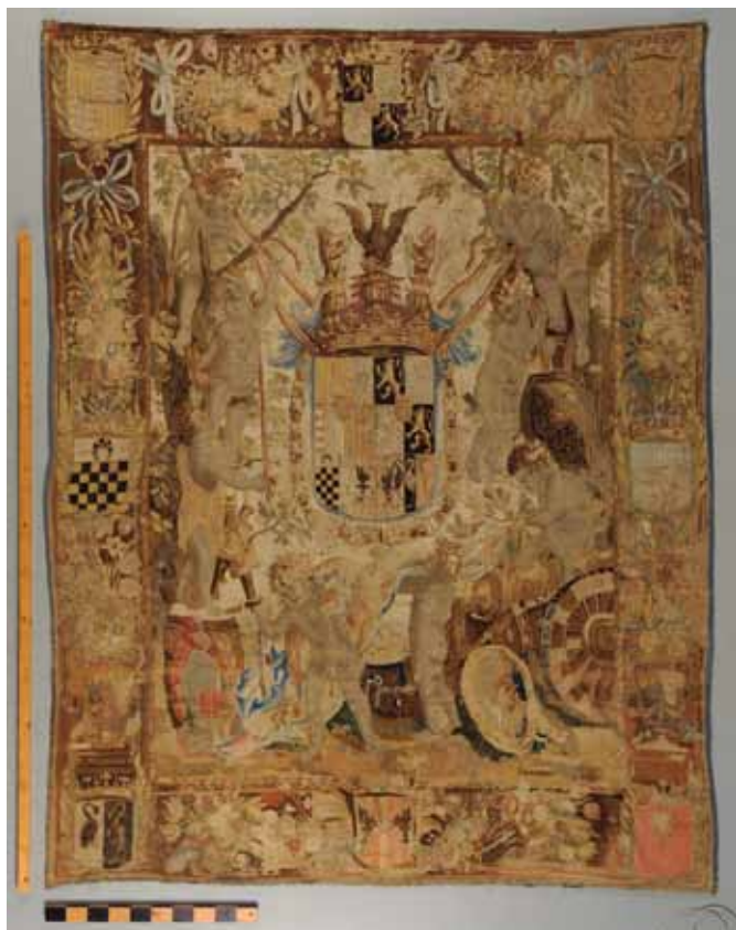
Sexto tapiz, general anverso.