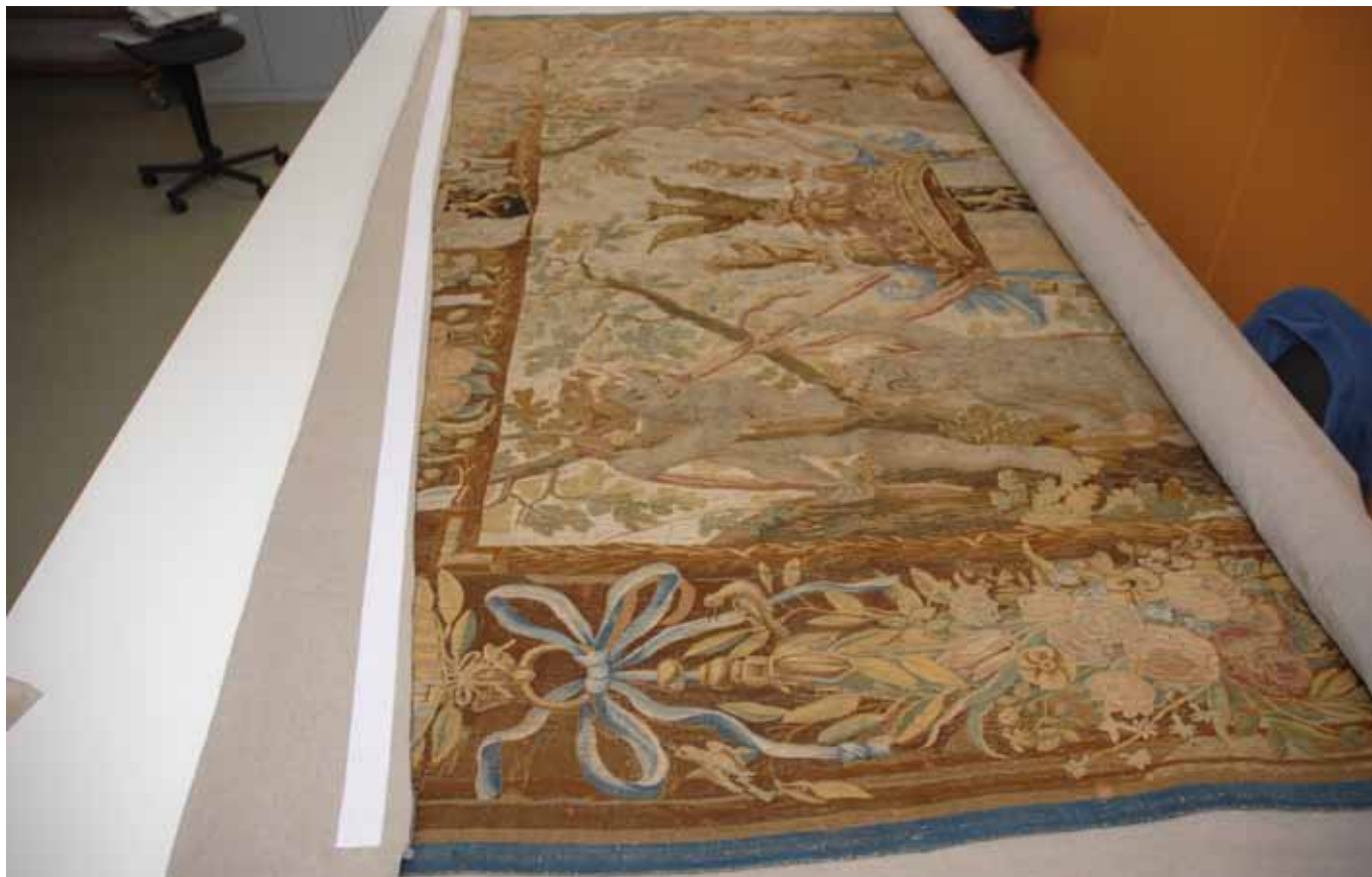
Montaje del nuevo sistema de colgadura mediante velcros.

soportes de papel secante. Una vez fueron secados, se comprobó si el hilo ha dejado restos de colorante en el papel o no. A pesar de que es una de las limpiezas más efectivas y con mejores resultados, se tuvo que descartar, debido al desteñido de algunos de los colorantes de hilos pertenecientes a intervenciones anteriores.