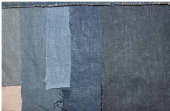
Pruebas de tinción.