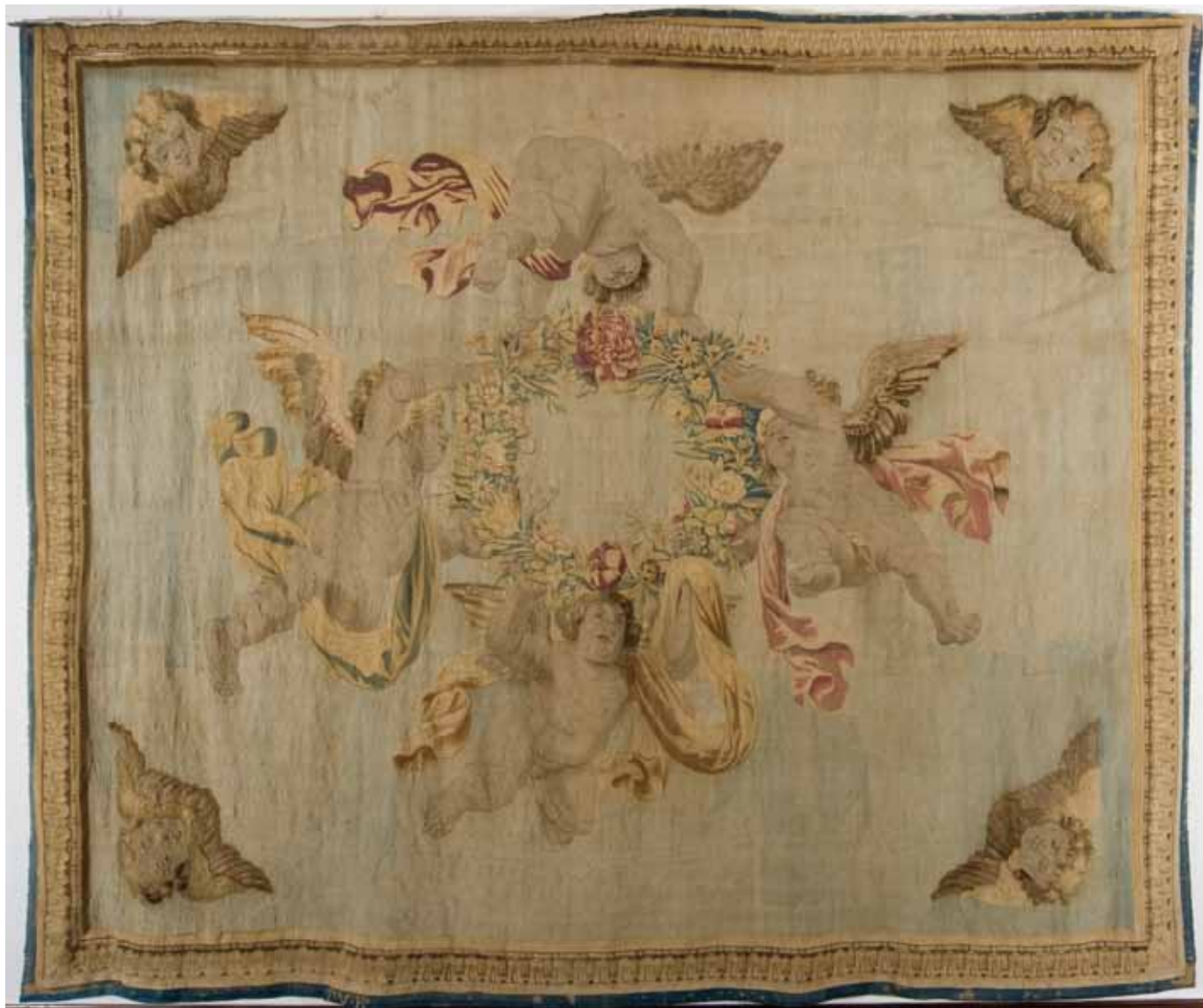
Tapiz Gloria de Ángeles .