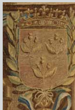
Escudos de las casas de Luna, Bravante-Baviera-Moncada y Cardona, respectivamente.