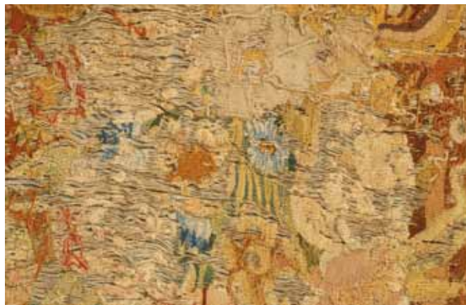
Eliminación de intervenciones anteriores.