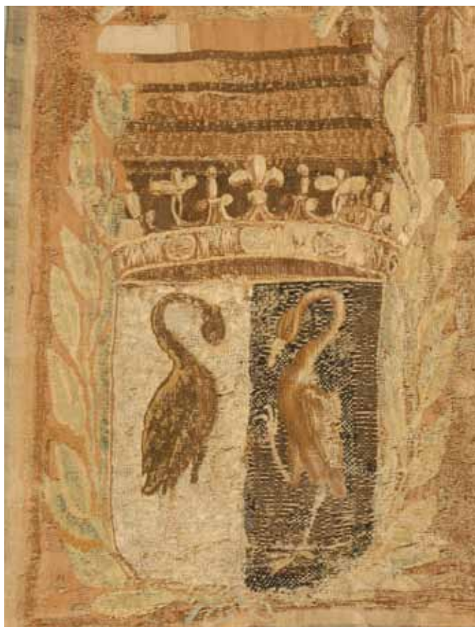
Desgaste superficial de trama, detalles.