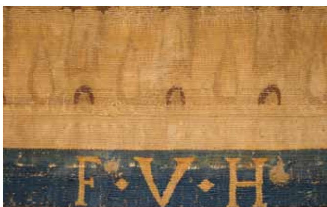
Iniciales o monogramas.

El monograma F.V.H. en el orillo azul ultramar de la parte inferior izquierda del tapiz Gloria de ángeles permite confirmar que la autoría de la serie corresponde al maestro Franz Van den Hecke, dadas las similitudes morfológicas y estilísticas de este tapiz con las otras cinco piezas