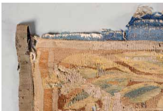
Modificación del borde.