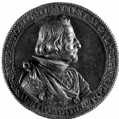
Retrato del VII duque de Montalto.

Así mismo presenta una ancha bordura o cenefa a modo de marco decorativo muy ornamentado compuesto por diversos motivos vegetales, florales, pájaros, jarrones, frutas, palmas, hojas de laurel, borlones con flecos, etcétera. Entre todo ello ocho escudos ducales (Aragón-Colicano, Bravante-Baviera y Moncada, Cardona,