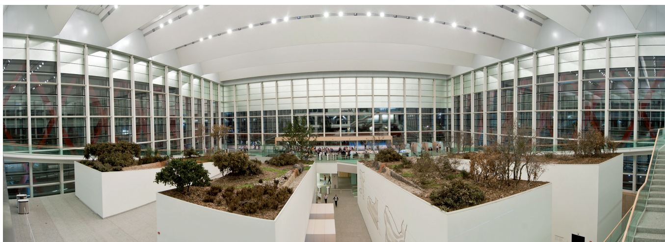
Visión panorámica interior, paisajismo y Atapuerca.

de vidrio forma las cuatro fachadas y la cubierta permite la luz cenital, dotando al espacio de una acusada luminosidad y facilitando su eficiencia energética.