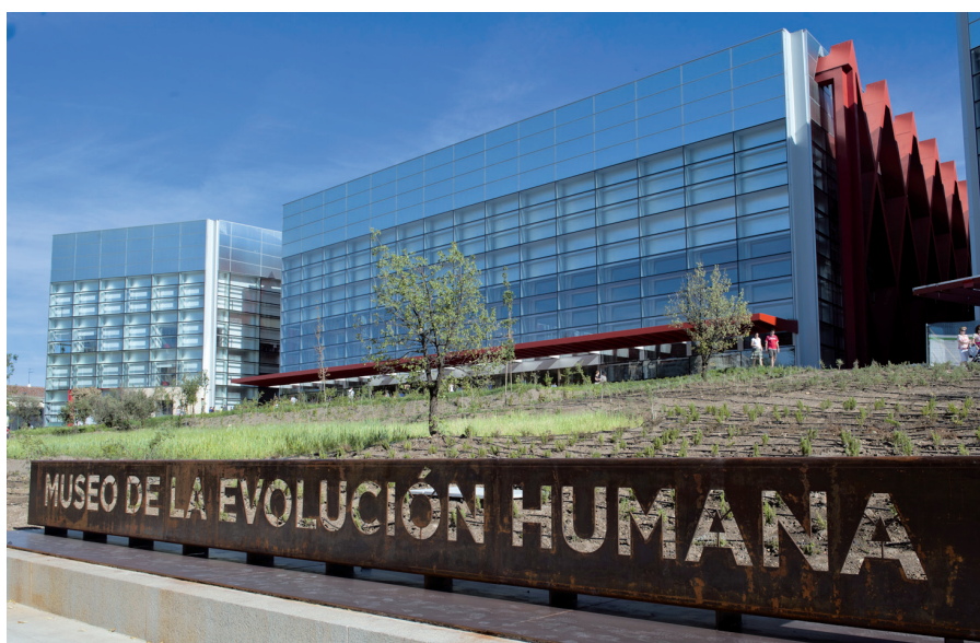
Vista exterior diurna.

El Museo es un prisma de 60 m de frente, 30 de altura y 90 de fondo. Una doble piel