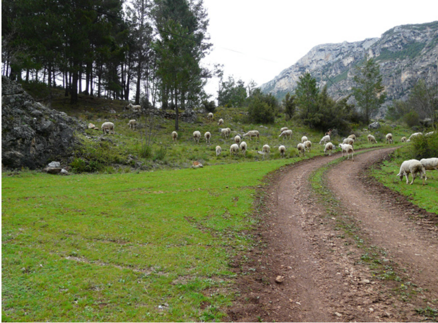
Ganado ovino pastando en el valle del Segura

por estrictas razones meteorológicas tenía que estar desplazándose continuamente a lo largo del año.