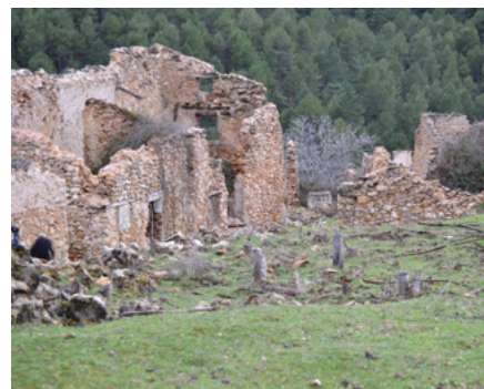
Hábitat abandonado en la Sierra

En este contexto de armonización de intereses es en el que cobra todo su significado cualquier propuesta de análisis y evaluación del patrimonio rural acumulado durante siglos en estas sierras. Ante todo porque constituye una parte esencial de las señas de identidad comarcales que no puede permanecer en el olvido por más tiempo mientras asistimos impasibles a su deterioro y destrucción. Pero también porque esa fracción patrimonial puede convertirse en un activo fundamental de desarrollo a través de programas encaminados a su divulgación. A nuestro modo de ver, ésta es una de las acciones prioritarias que deberían incorporarse con urgencia a las nuevas propuestas de relanzamiento socioeconómico del espacio protegido.