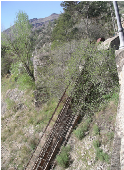
Estado actual del elevador de madera del pantano del Tranco