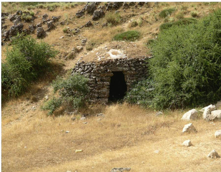
Chozo en la zona de cumbres de la sierra de Segura

consideración sobre la naturaleza jurídica de las tierras susceptibles de roturación y puesta en cultivo, buena parte de las cuales sólo eran capaces de soportar un sistema de agricultura itinerante con largos periodos de descanso del terrazgo entre un ciclo y otro de cosechas, tal y como explicaba muy bien Juan Navarro a mediados del siglo XIX (NAVARRO REVERTER, 1868).