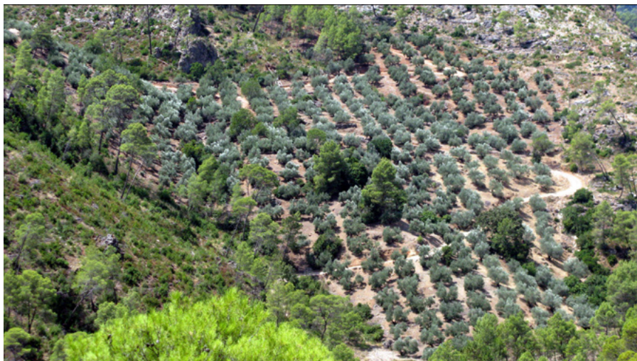
Avance del olivar en las porciones más escabrosas del territorio serrano

Por esa razón consideramos hoy especialmente pertinente el establecimiento de una línea de investigación enfocada expresamente al estudio tipológico y funcional de los distintos elementos patrimoniales asociados a la explotación extensiva de la ganadería, que desde nuestro punto de vista no debería circunscribirse a las sierras de Segura y Cazorla sino comprender también el pastadero de extremo que para éstos y otros muchos ganaderos peninsulares representó la porción jiennense de Sierra Morena. Elementos tan genuinos como el hábitat de pastores y ganados, tanto en los pastaderos como a lo largo de las vías pecuarias, descansaderos, abrevaderos, etc., permanecen en un olvido incomprensible que no debe permitirse por más tiempo.