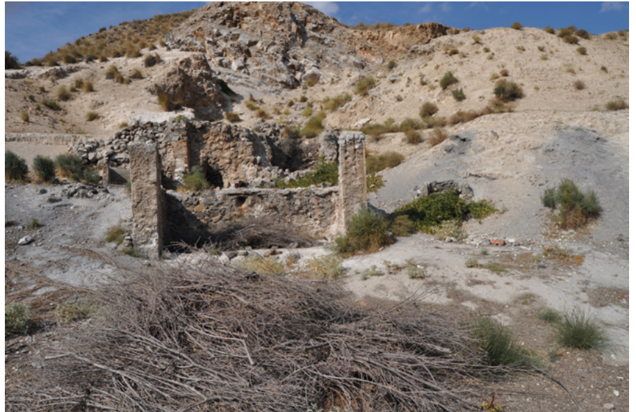
Calera abandonada en la sierra de Cazorla

así como de su distribución en el tiempo o los cambiantes puntos de origen y destino de las maderadas.