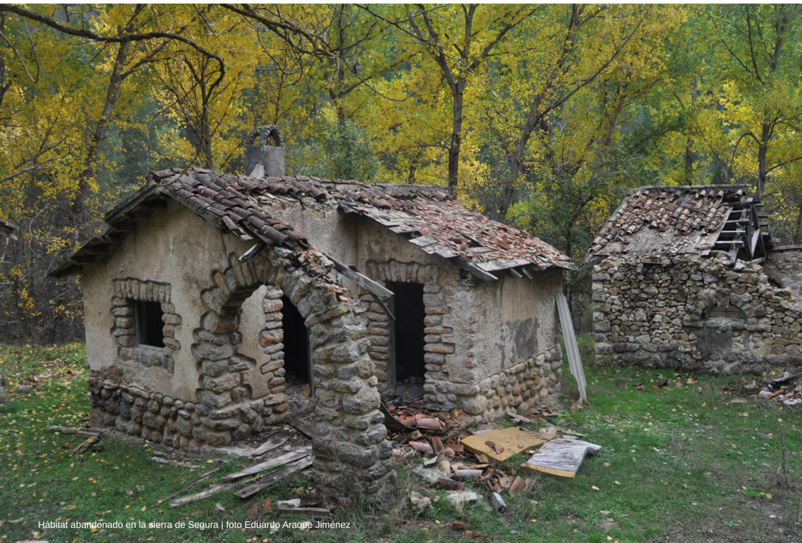
Hábitat abandonado en la sierra de Segura