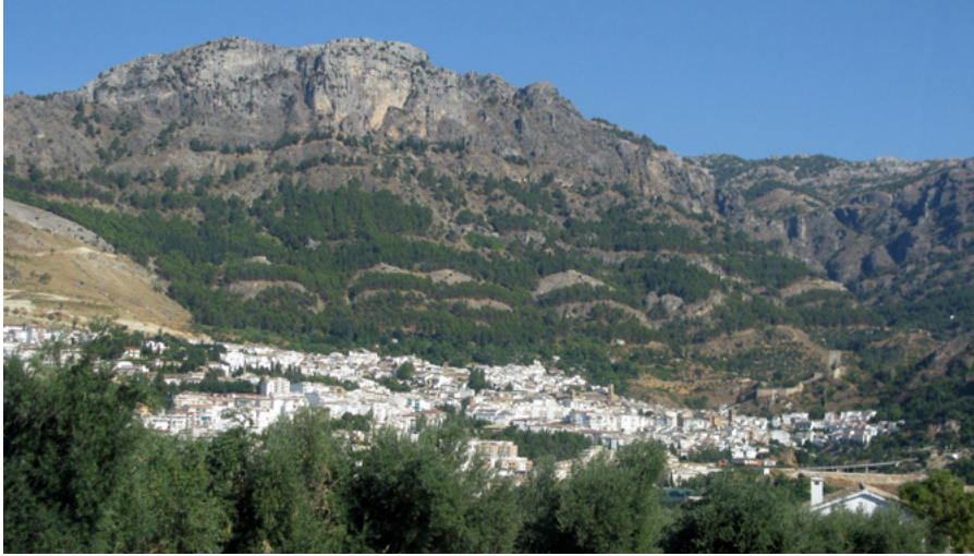
Ciudad de Cazorla, capital comarcal de la sierra de su nombre

quedaron vinculados exclusivamente a los aprovechamientos agrícolas y ganaderos.