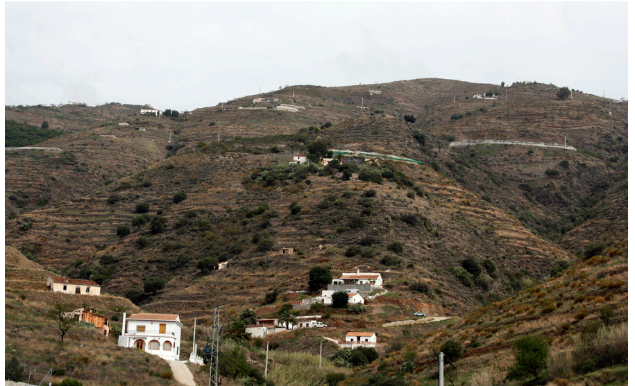
Entorno de Salobreña

necesario conocer esa dinámica que tiene sus períodos históricos más o menos perfilados. En época medieval, por tanto andalusí, la organización del territorio determinaba la existencia de áreas bien definidas agrícolaemente, con tierras irrigadas, bien aterrazadas en el entorno de los barrancos que se alimentaban de fuentes, bien en el llano, con una pendiente mucho menor. El dominio del monte mediterráneo en el medio natural era importante, como lo era la vegetación de ribera.