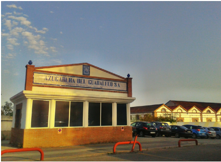
Azucarera del Guadalfeo

Así pues, el valor comercial del territorio no se puede separar de la capacidad productiva que en época nazarí fue incrementada por elementos del propio núcleo con fines mercantiles e incluso por el propio sultán granadino (MALPICA CUELLO, 2009). La agricultura existe y da lugar al comercio, para, más tarde, ya en el período nazarí y aun antes, incidir este en ella, pero sin romperla de manera irreconocible, sino en un equilibrio a veces inestable.