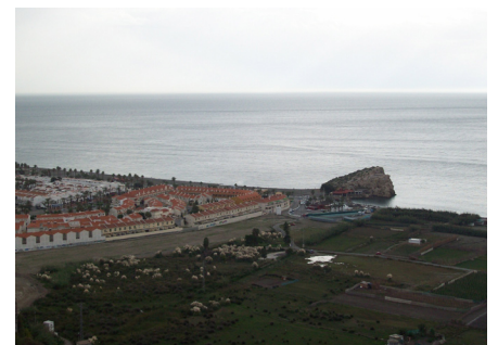
Playa de Salobreña