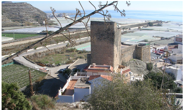
Torre del Diablo. Gualchos-Castell de Ferro (izquierda)