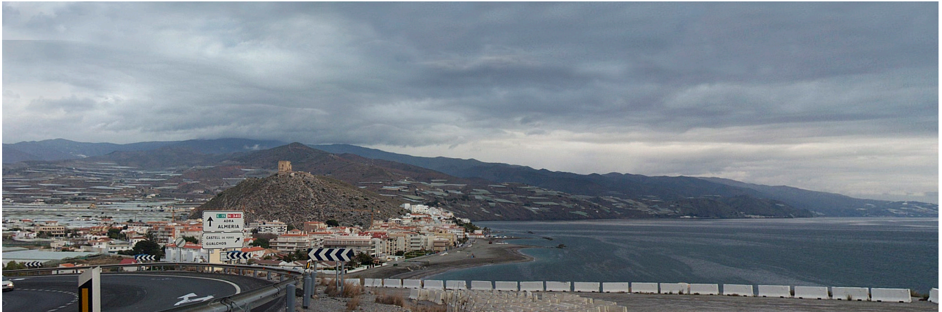
Castell de Ferro

está presente, desde antiguo y por necesidad de escapar de las inundaciones, en las colinas que sirven de contacto con la llanura y en las elevaciones en las que la composición litológica lo permitía.