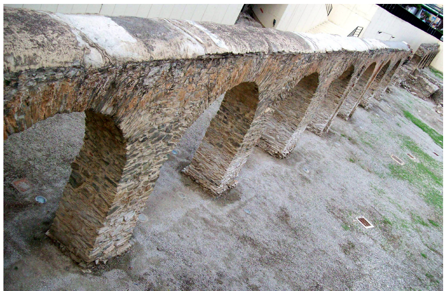
Acueducto romano de Almuñécar

La importancia patrimonial de la costa creció progresivamente de manera notable y ofrece un cuadro de primera magnitud. Sin embargo, la crisis de