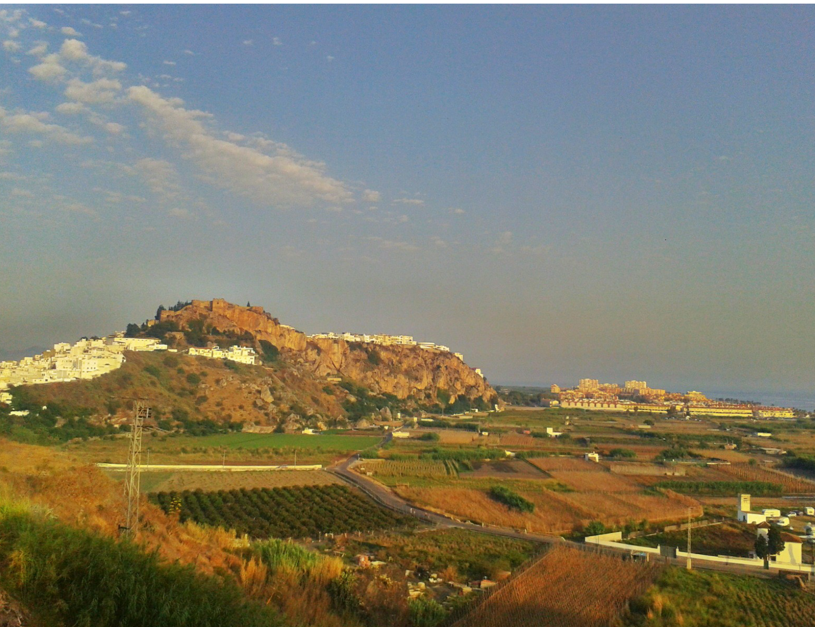
Castillo de Salobreña