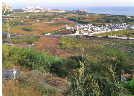
Vega de Salobreña

Contamos asimismo, ya en el espacio malagueño, con el camino que forma el valle del Guadalhorce. Es un eje de comunicación entre la depresión de Antequera y la costa situada inmediatamente al oeste de Málaga. Organiza la Algarbía, llamada así por estar a poniente de la ciudad, contigua a ella.