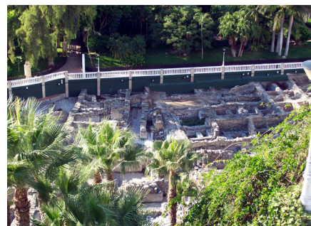
Factoría de salazones de Almuñécar

Este esquema de relación se desarrolló en época romana hasta procederse a una integración plena. El valor de las tierras interiores se fue desarrollando al compás del avance de la penetración romana. No solo se identifican explotaciones agrícolas de mayor o menor extensión, sino también asentamientos en relación con la minería en puntos de la montaña