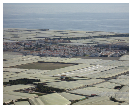
Carchuna. La agricultura marca el ritmo de crecimiento económico de este pueblo y tiene su punto de inflexión en el desarrollo de la agricultura intensiva bajo plástico