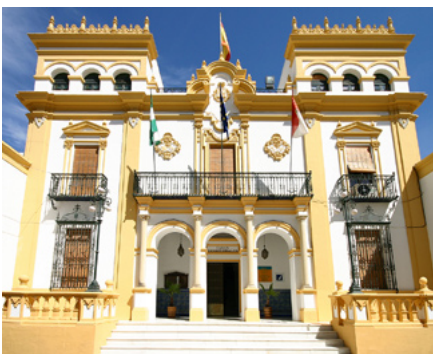
Exterior del edificio del Archivo Municipal de La Palma del Condado