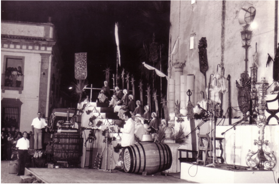
Acto de la XIII Fiesta de la Vendimia del Condado, sábado 22 de septiembre de 1973