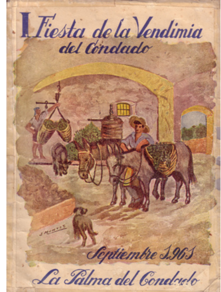
Libro de la I Fiesta de la Vendimia del Condado. Expediente del programa de festejos de la Real Feria de Ganados y Fiesta de la Vendimia. Septiembre de 1961. Leg. 661