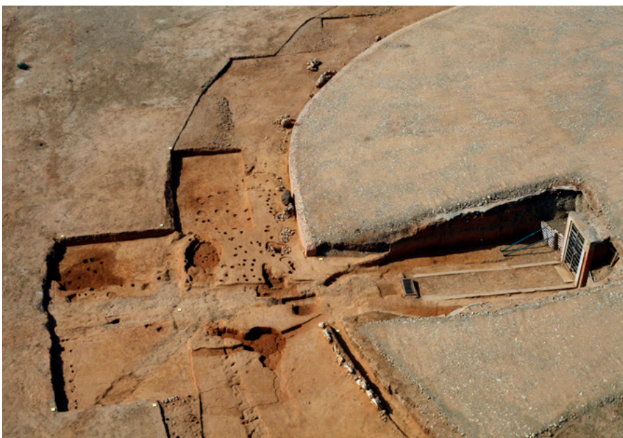
3. Conjunto de estructuras neolíticas localizadas en el área externa de acceso al dolmen

Las excavaciones en los espacios externos y el atrio han posibilitado conocer la existencia de estructuras de cronología Neolítica previas al dolmen (imagen 3). Se ha constatado la presencia de fosas de cimentación y bloques de piedra que podrían corresponderse con un círculo de 60 m de diámetro compuesto por piedras de distintas materias primas y formas: bloques, menhires y estelas-menhires de grauvaca, calcarenitas y conglomerados ferruginosos de tamaños diversos, distribuidos equidistantemente. Al exterior de este círculo de piedras se ha registrado un conjunto de estructuras: