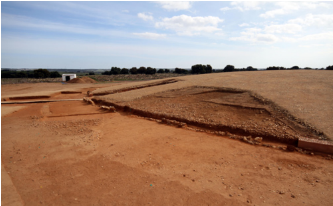
6. Detalle del sector noroeste del túmulo, anillo peristáltico y deambulador