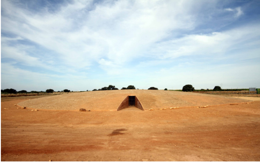
13. Dolmen de Soto tras su restauración. Vista del túmulo, deambulatorio y área de acceso