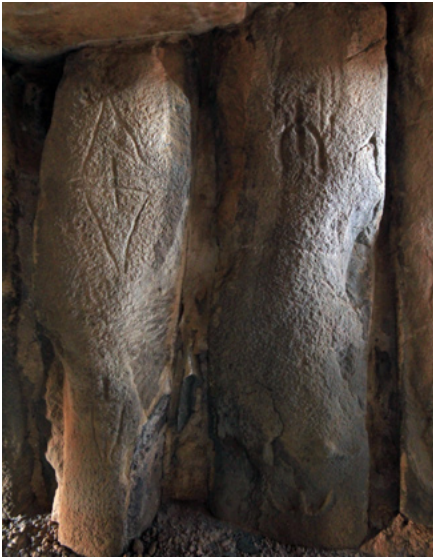
10. Ortostatos 20 (estela con grabados de armas) y 21 (estela antropomorfa) de la pared sur de la estructura megalítica