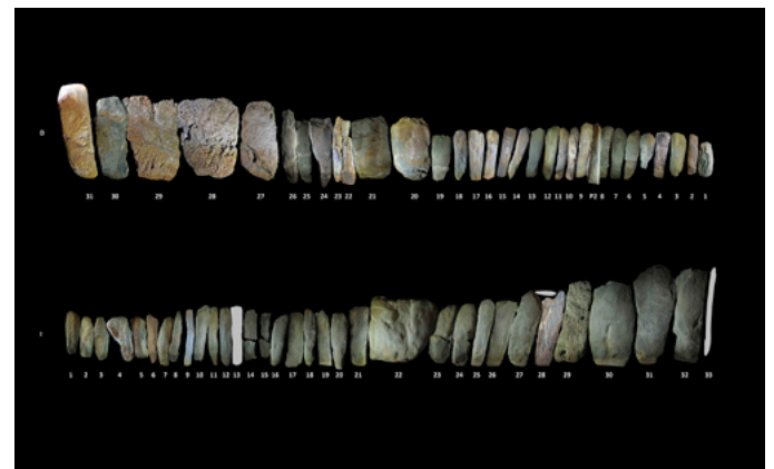
9. Alzados fotogramétricos de las paredes de la estructura megalítica