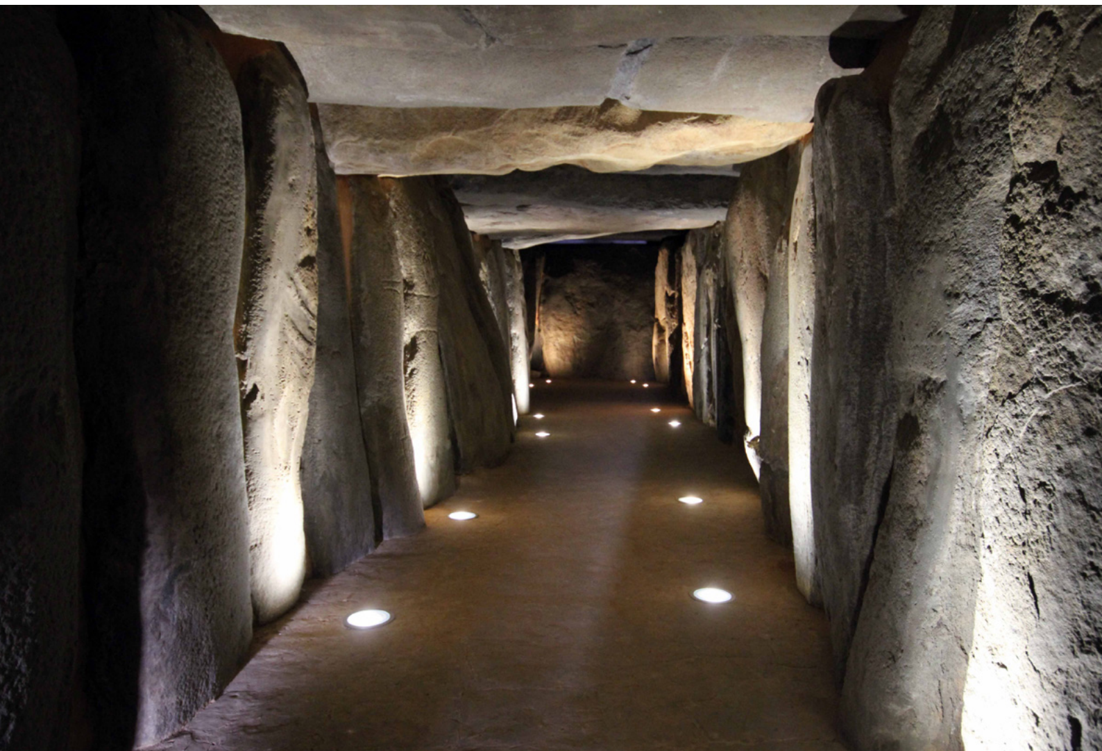
Galería megalítica tras su restauración. Vista desde la cabecera | foto José Antonio Linares Catela y Coronada Mora Molina, de todas las imágenes que ilustran este artículo, si no se indica lo contrario