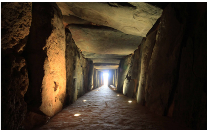
8. Vista de la gran cámara megalítica tras su restauración desde la cabecera