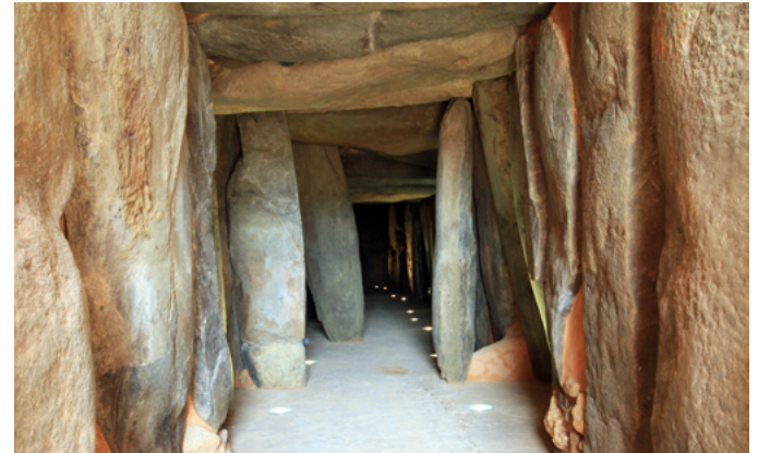
7. Galería megalítica desde el acceso tras su restauración