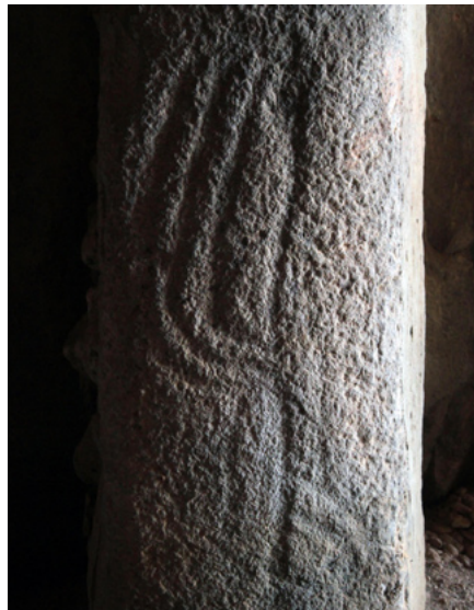
12. Grabado antropomorfo del ortostato 26 de la pared norte