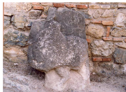
Relieve ibero-romano de monumento funerario (relieve acualmente conservados en el Museo de Málaga)

Las laderas del monte donde se alzan las ruinas de la ciudad de Lacipo no ofrecen en todos sus lados la suficiente pendiente y dificultad de accesibilidad para una defensa natural lo que ha obligado a la construcción en varias zonas de un recinto amurallado de evidente carácter defensivo, bien adaptado al terreno y formado en la parte más antigua por grandes bloques de caliza unidos en seco, escuadrados y rudamente careados. En el caso del lado meridional, sobre aquella muralla ciclópea se construyó en época imperial otra de mampostería de la que queda un gran lienzo de algo más de 3 metros de altura y unos 7 de longitud. Al pie de la ladera suroriental quedan