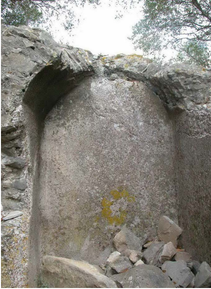
Detalle de las cisternas situadas junto a la ciudad