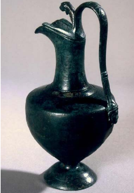
Praefericulum en bronce hallado en Lacipo