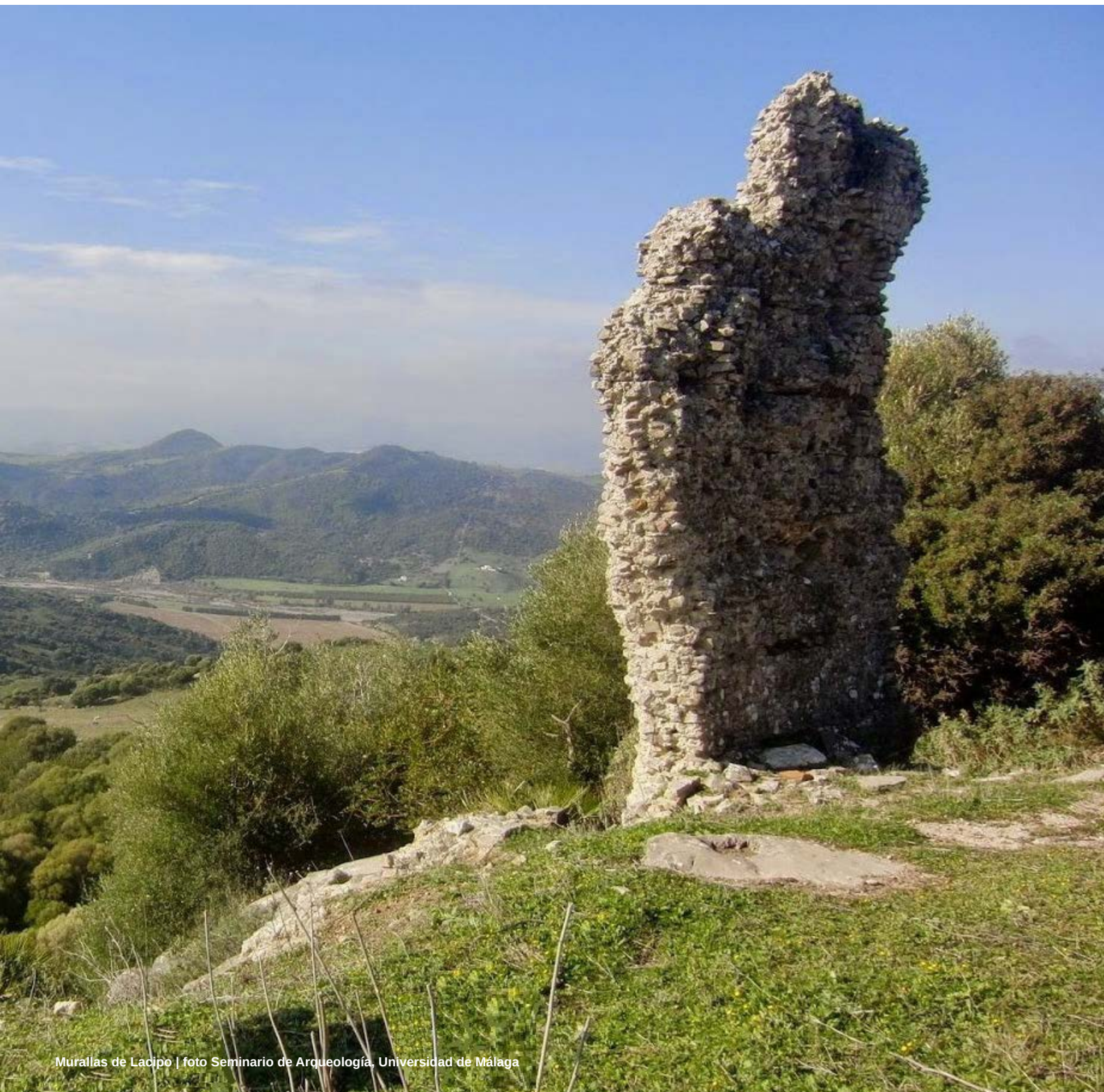
Murallas de Ládipo