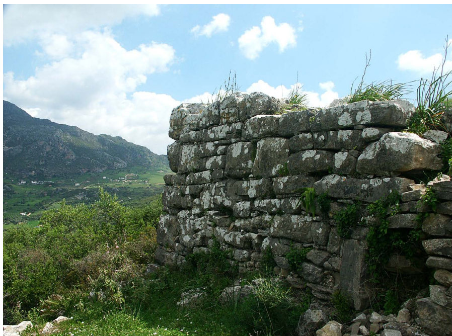
Murallas de Lacipo

Ms. Biblioteca Nacional. Madrid núm. 10.451. Ed. facs. Universidad de Málaga, Málaga, 1992.