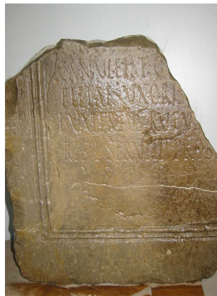
Pedestal con un epígrafe referido a una mujer de la gens Canuleia. Siglo I d. de C., actualmente en el Museo Municipal de San Roque, Cádiz

Entre las inscripciones latinas de esta ciudad antigua un grupo corresponde a dedicaciones públicas realizadas por la familia local de los Marcios; en una, Caio Marcio December testimonia que ha gastado setecientos cincuenta denarios en la estatua de la Fortuna Augusta que ha mandado colocar como agradecimiento a la curia por su elección como sevir y por haberle eximido del pago de la summa honoraria; otra de estas inscripciones daba cuenta de que Caio Marcio Cefalón al ser elegido por los duoviros locales como flamen del culto imperial donó cuatro mil sestercios; otro tercer epí-