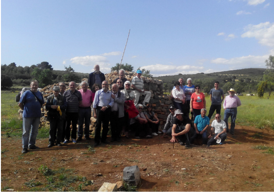
Visita técnica con las comunidades en Altura (Castellón, comunidad Valenciana) dentro del proyecto Patrimonio

5. Gobernanza y participación. Sin duda el protagonismo del proceso es de las propias comunidades locales, que demandan esta mediación de la academia, que es capaz de co-crear un espacio de intercambio de ideas y procedimientos sin que exista un actor destacado. Al implementar además metodologías participativas y abiertas se fomenta una cultura deliberativa y democrática, también escasa en la ordenación del territorio y particularmente en el campo del patrimonio, donde los técnicos y las administraciones no se caracterizan precisamente por preguntar demasiado. De esta forma se favorecen nuevos órganos asamblearios locales y acciones en que la ciudadanía es el agente protagonista.