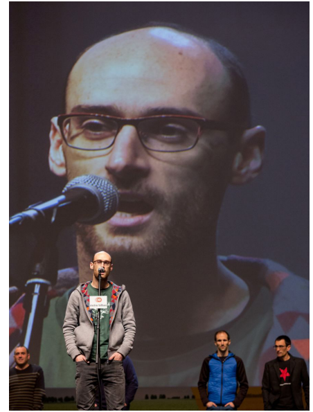
A la izquierda, 2013ko Bertsolari Txapelketa