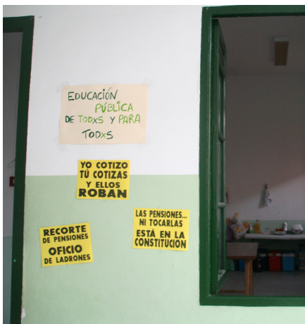
Carteles reivindicativos junto a la cocina del Centro Social Rey Heredia; a la derecha, ambiente de barrio en el patio del antiguo colegio

Como ejemplo, el conserje del edificio, que se encarga de su apertura, cierre, vigilancia, información a los usuarios, etc., era una persona excluida socialmente, un sin techo, antes de desarrollar aquí su actividad. Desde Rey Heredia se le planteó la posibilidad de encargarse de estas funciones a cambio de alojamiento y manutención. Vive en un espacio adaptado en el mismo centro y utiliza el servicio del comedor social para su manutención básica. Gracias a su nueva función su rol social ha cambiado radicalmente, al abandonar el contexto de exclusión previo y desempeñar ahora una importante labor social y de ayuda a otras personas. Podemos imaginar el efecto que esto puede tener en la autoestima de un ser humano.