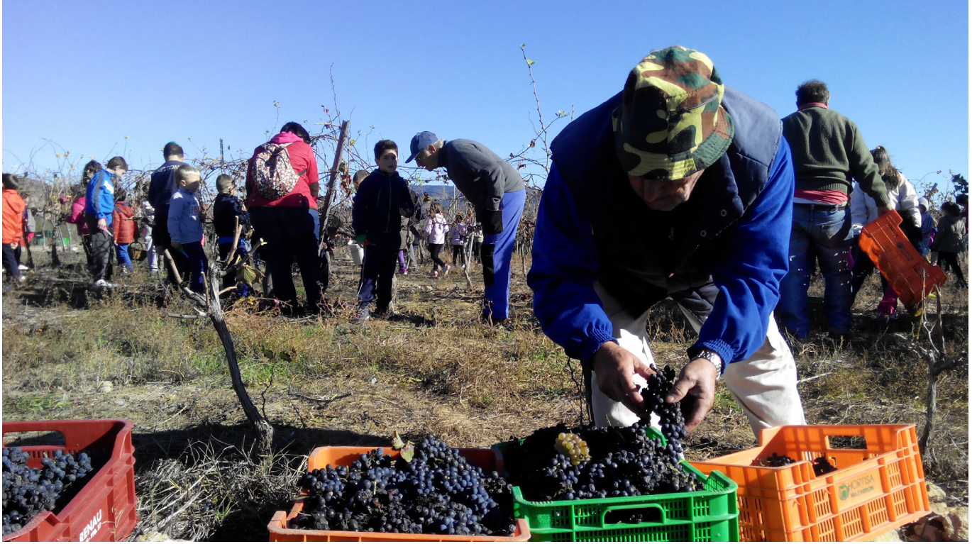
Fiesta del vino. Viver. Octubre de 2015. Proyecto de Educación Patrimonial. Grupo de recuperación de la cultura de Viver y CEIP Historiador Diago

de forma disgregada y horizontal, muy diferente a las formas jerárquicas y concentradas de difusión del conocimiento académico, productoras de modelos y discursos unidireccionales. Y llegamos así a otra novedad importante de esta metodología, y es que los procesos no se estandarizan ni normalizan, se respeta la diferencia y este aspecto es fundamental para que las innovaciones no se vean limitadas.