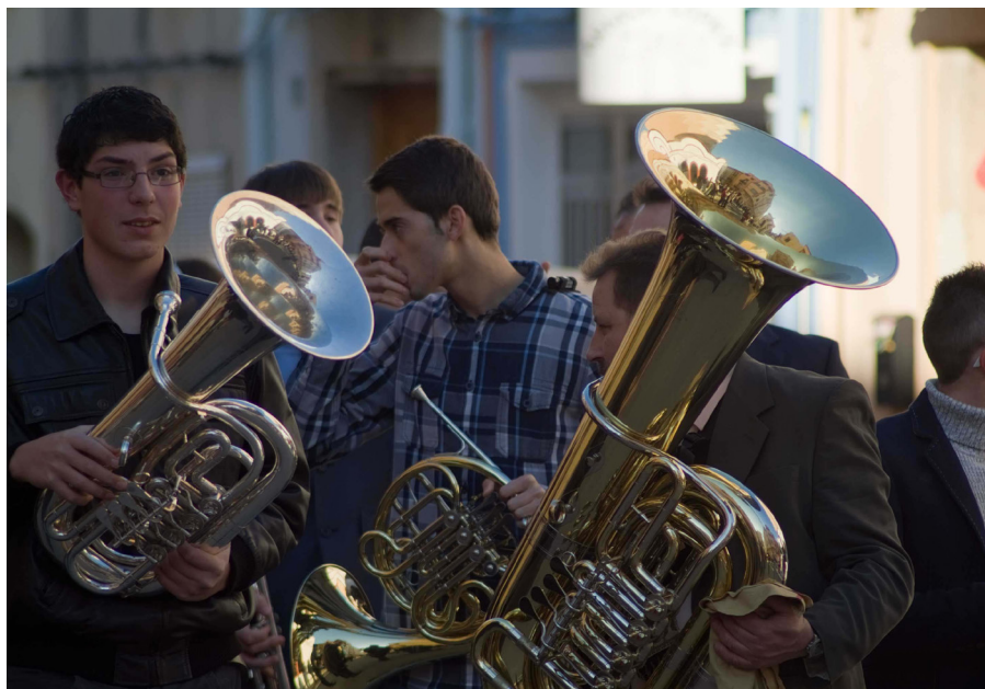
La-Re-Mi Festa de la roba bruta. Actividad Sincronies. Projectes d'intervenció artística

prometer a las partes a través de la negociación de convenios o fórmulas que permitan establecer acuerdos estables entre ellas. En segundo lugar, la universidad, como institución pública, asume esa labor de reconocimiento apoyando las propuestas y actuaciones de los colectivos como contramedida, dotándolos así de una mayor legitimidad y un nuevo rol público en su contexto más local. Es clave mantener abiertos canales para poder analizar las dificultades lo antes posible mediante visitas exprés, reuniones de crisis y la adecuación de los proyectos a partir de sus circunstancias, como así lo hace el personal técnico de Patrimoni, que siempre forma parte del proceso de diseño y planificación de los colectivos tratando de construir espacios de carácter horizontal y participativo para una resolución colegiada de conflictos. Se aprovechan también los encuentros programados del proyecto (jornadas, preparación de publicaciones, visitas técnicas, un encuentro anual de la red de grupos locales, etc.), para donde se definen, tratan y trabajan estos problemas y su resolución mediante el diseño de herramientas específicas, muy a menudo de forma experimental y tentativa, que es lo que hace innovador al proyecto.