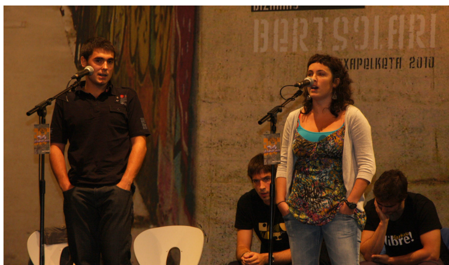
2010eko Bizkaiko Bertsoari Txapelketako

3. Impacto y orientación social. El impacto social alcanza una comunidad muy amplia y variada de usuarios y además a escala suprarregional (todos los territorios de Euskal Herria). Se ha influido notablemente en la mentalidad de las personas que habitan estos territorios en su percepción del bertso, tradicionalmente entendido como práctica exclusiva de hombres rurales, a la que se han incorporado de forma muy efectiva la mujer (varias ediciones recientes del campeonato nacional han tenido una vencedora), con lo que Bertsozale está influyendo de manera muy directa en la implementación de cambios de mentalidad colectivos, como lo es la percepción social de la mujer en una sociedad que ha sido tradicionalmente muy patriarcal.