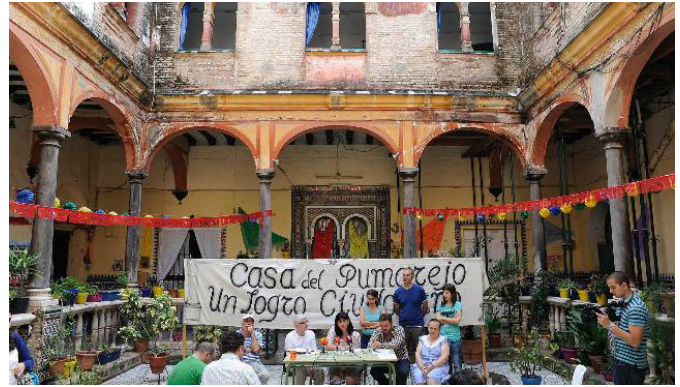
A la derecha, ocupación del colegio Rey Heredia

En definitiva, el Centro Social Rey Heredia puede ser descrito como un dispositivo o tecnología social innovadora y generadora de servicios sociales y comunitarios. Sus impactos alcanzan también la reflexión académica (VELASCO, 2014).