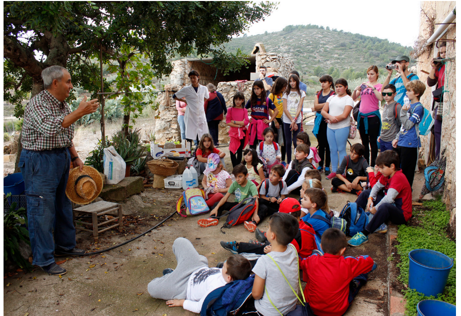
"Textures del meu poble". Costur (octubre 2016). Jornada d'Educació Patrimonial del Grup de Patrimoni de Costur amb l'escola

universidad-grupos (conocimiento experimental), grupos-universidad (conocimiento experiencial) y horizontal, entre grupos.