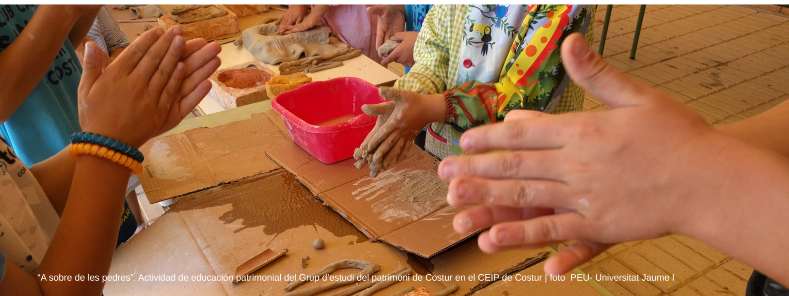
"A sobre de les pedres". Actividad de educación patrimonial del Grup d'estudi del patrimoni de Costur en el CEIP de Costur