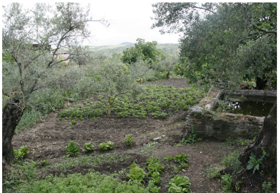
Huerta y alberca, cerca de El Charco