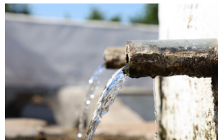
Surtidor de El Pilar