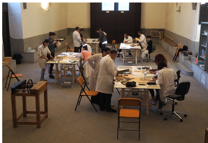
Imágenes del curso organizado por la Fundación en octubre de 2019