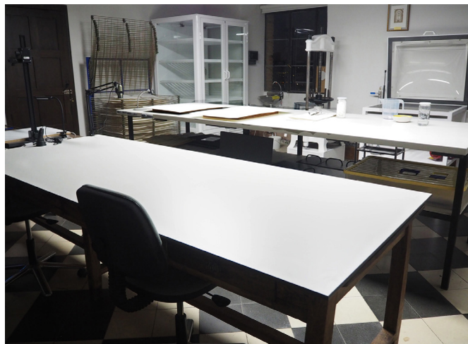
Taller-laboratorio de Restauración de Documento Gráfico

Las actuales instalaciones cuentan con el equipamiento necesario para abordar las intervenciones de gran parte de la documentación, disponiendo de una gran cámara-armario de humectación, mesa de succión y humectación, campana de limpieza de documentos y manipulación de sustancias volátiles, mesa negatoscopio, sistema de ósmosis inversa para la obtención de agua desmineralizada, pistola de vapor, peachímetro, microscopios digi-