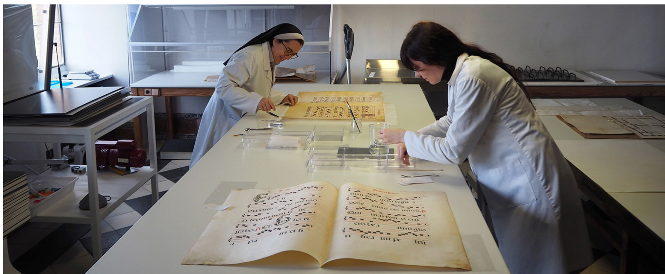
Restauración de un cantoral de la colección del Hospital de Tavera

Url de la contribución < www.iaph.es/revistaph/index.php/revistaph/article/view/4599 >