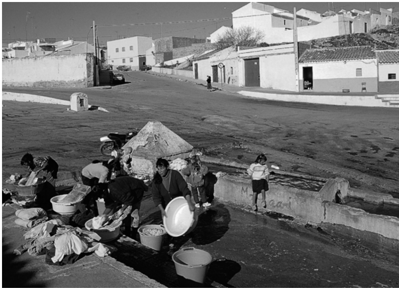
Fig. 2 La fuente vieja. La Puebla de Cazalla.