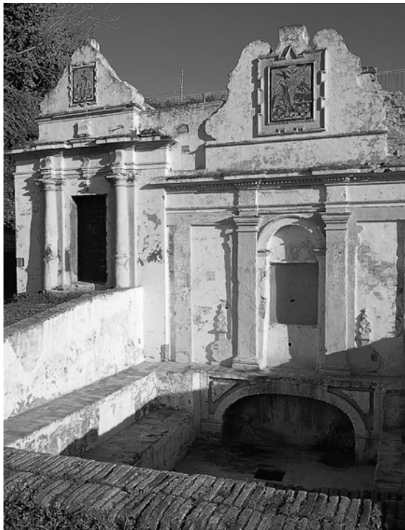
Fig. 3 La fuente vieja de Aznalcollar.

ción del elemento vital, sino que le sirve de símbolo, es ornamento, y espacio de sociabilidad mixta. Permite reunirse a un público diverso, en una misma área, y si ya no es algo obvio, es imprescindible tener en cuenta que facilitaba el encuentro entre hombres y mujeres, en una sociedad en la que la separación de géneros se inscribía en el espacio.