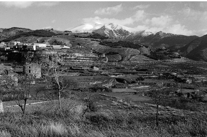
Fig. 6 Fuente de la Coriana. Olivares.