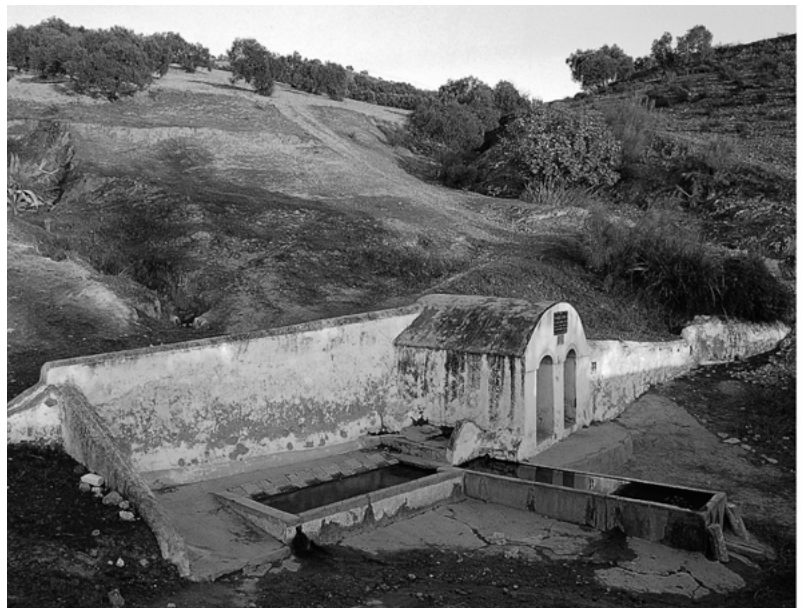
Fig. 4 El Pilar Ancho. Carmona.