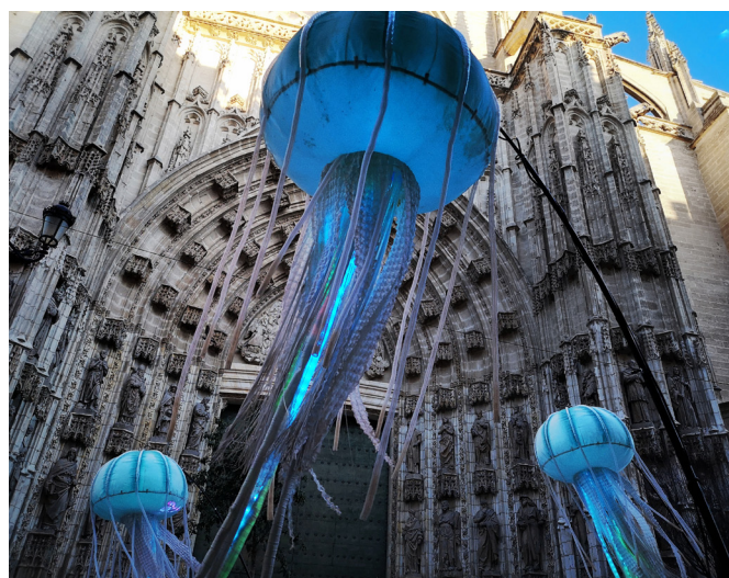
Sociedad líquida

Si bien hay otras referencias a la difusión en artículos anteriores (11.4 y 13.5, entre otros) es el artículo 27 el que se centra en la necesidad de informar y estar informados a través de programas de educación e información. Este año se publica también la Carta del restauro de Cesare Brandi y se celebra la primera gran exposición sobre los tesoros de la tumba de Tutankamón. Itinerante desde 1972 a 1979 por Estados Unidos, antigua URSS, Japón, Francia, Canadá y Alemania, alcanza la cifra de 8 millones de visitantes solo en Estados Unidos. Tal y como señala Beatriz Sanjuán en el Estudio de viabilidad y adecuación como generador de usos para las Reales Atarazanas de Sevilla (2008): “este tipo de exposiciones se convierte en hito social, además de cultural. En mito, en paradigma para la futura política expositiva, que, a partir de entonces, deja de atender a la novedad discursiva para prestar atención sobre la capacidad de cautivar espectadores. Lo cualitativo se sustituye por lo cuantitativo, en el marco de un modelo de exhibición-atención característico de la sociedad comunicativa, posmoderna y global”.