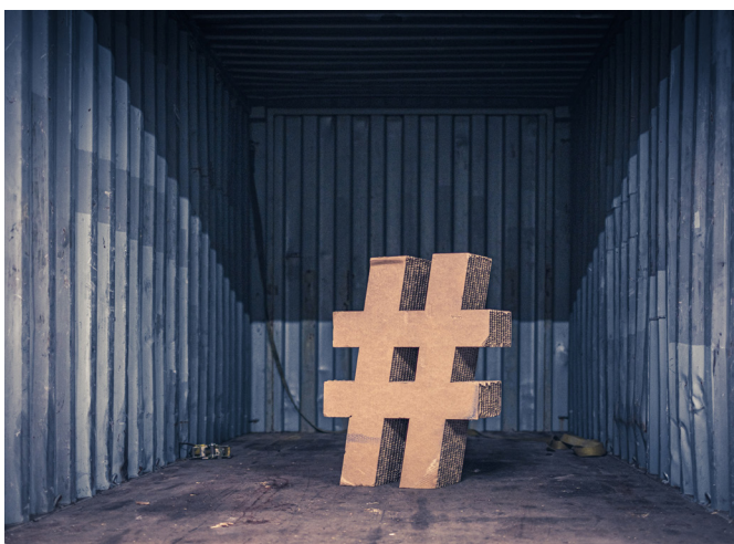
Hashtag