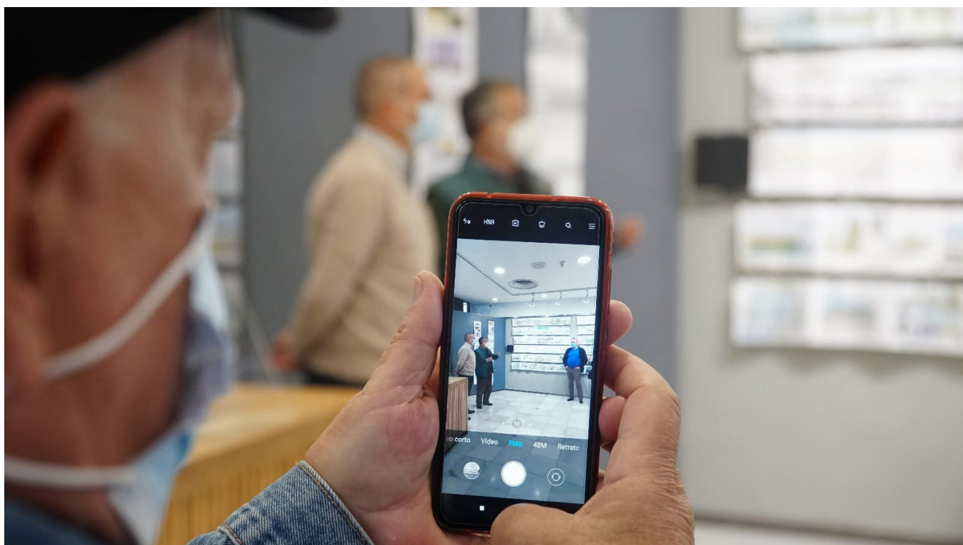
Brechas digitales

logía producida por el norte, con materias primas del sur, una brecha digital que nos habla de ruralidad, género, edad, educación y, en definitiva, que nos evidencia asimetrías.