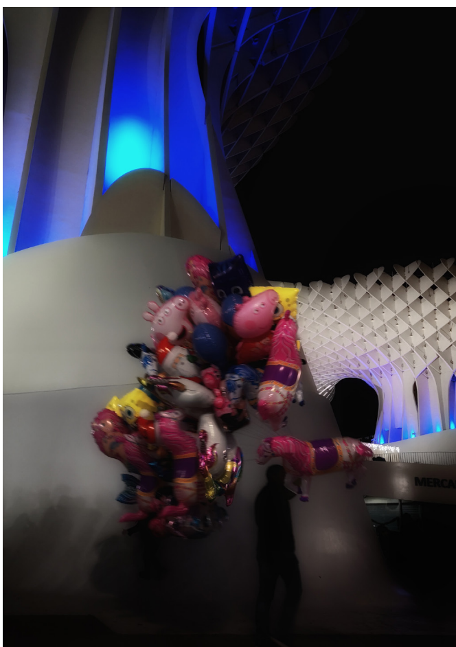
Marketing urbano

cultural y social, con una continua y decisiva función didáctica. En suma, considerarlo como ámbito de múltiples actividades y usos, pero siempre desde la óptica de una aproximación viva a la cultura.”