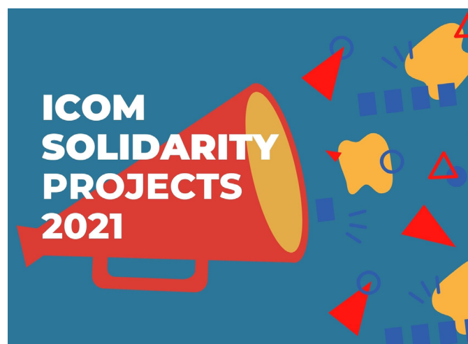
Cartel de la convocatoria 2021

En 2020, entre diversas iniciativas para proporcionar apoyo a su red de museos 1 , fuertemente afectados por las medidas restrictivas que prácticamente paralizaron el sector cultural, la institución lanzó, entre el 12 de octubre y el 13 de diciembre de 2020, una convocatoria de Proyectos de Solidaridad. El objetivo de la misma fue apoyar a los profesionales de los museos de todo el