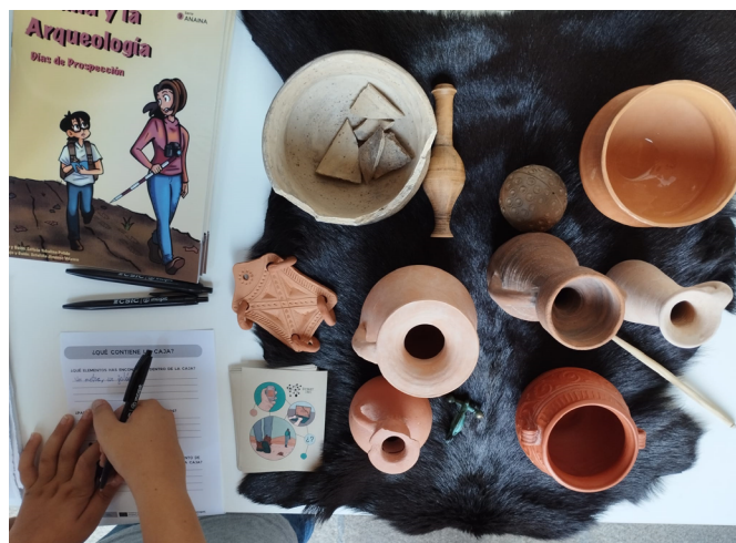
Actividad divulgativa en la que se empleó el cómic como recurso educativo