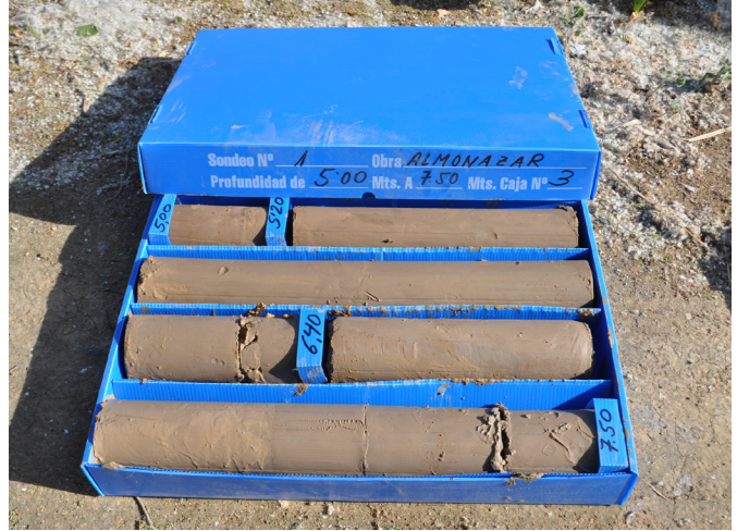
Parte del testigo extraído destinado a su análisis

mediante la limpieza y lectura de perfiles estratigráficos y la realización de excavaciones arqueológicas en extensión. A ello se suma la exhaustiva revisión de las intervenciones realizadas en las últimas décadas en Alcalá del Río o Itálica. A escala regional, se han sistematizado cronoespacialmente las técnicas constructivas con el fin de determinar su origen, evolución, la aparición o desaparición de determinados procedimientos o la transferencia de competencias y conocimientos de carácter técnico-cultural a lo largo de la historia.