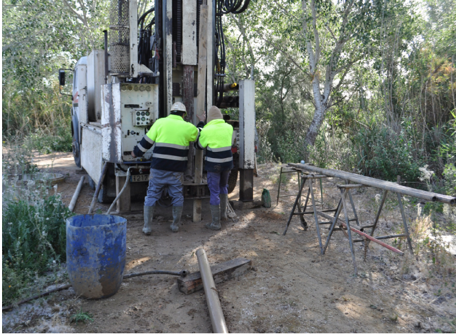
Sondeos geoarqueológicos realizados en la vega del Guadalquivir, en este caso sobre un antiguo canal del río ocupado actualmente por el arroyo Almonazar