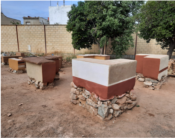
Conjunto de las estructuras-probeta donde se han reproducido muros con distintas dimensiones y características, tipos de aparejos, revestimientos, coronaciones, enlucidos y pinturas