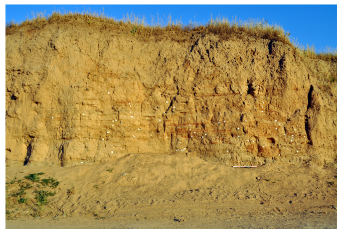
Superposición de estructuras realizadas en tierra registrada en el sector oriental de Cerro Macareno durante la campaña de limpieza de perfiles llevada a cabo en 2017

Entre estos últimos cabría subrayar Cerro Macareno, donde se ha llevado a cabo, además, un análisis específico y diacrónico de las evidencias constructivas in situ