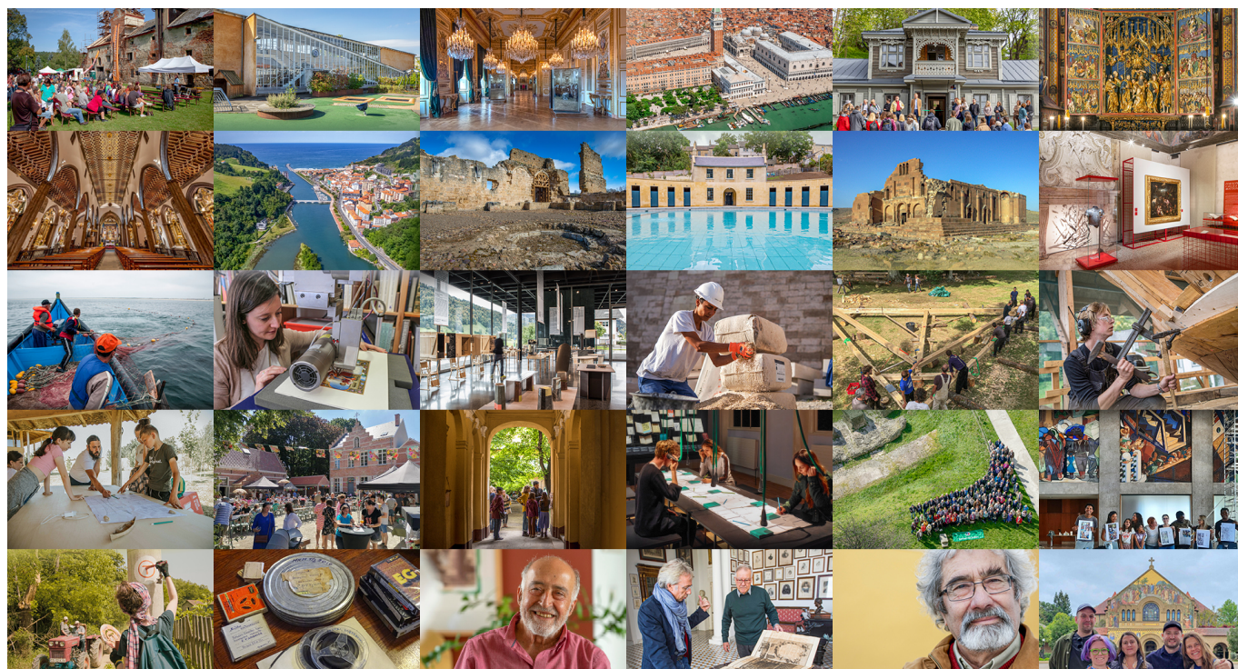
Imágenes de los proyectos premiados en los Premios de Patrimonio Europeos 2023

5. Campeones del patrimonio: para personas u organizaciones influyentes e inspiradoras cuya acción ejemplar demuestre un nivel excepcional de dedicación, impacto y compromiso cívico para la salvaguardia y mejora del patrimonio cultural.