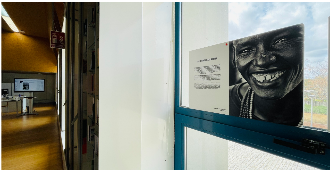
Exposición Mujeres del Mundo en la Biblioteca del IAPH para celebrar el Día Internacional de la mujer

Existen dos tipos de colecciones. El primer tipo agrupa los documentos originados por un proyecto concreto que por la importancia del objeto patrimonial estudiado o por la complejidad del desarrollo técnico-científico ha generado un conjunto documental destacable por sí mismo. Ejemplo de ellos sería la colección del Proyecto Atlas del Patrimonio Inmaterial, la del Proyecto de Conservación del Palacio de San Telmo en Sevilla o la del Proyecto re_HABITAR. El segundo tipo de colecciones agrupan los documentos resultados de un mismo tipo de actuación. El ejemplo más representativo por volumen e índice de consultabilidad es la colección de Actuaciones para la Conservación del Patrimonio Cultural.