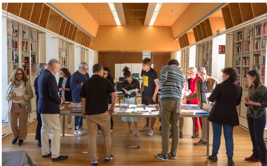
Celebración del Día del libro en la Biblioteca del IAPH

ciarse en fuentes documentales de archivo que garanticen la información y las conclusiones.