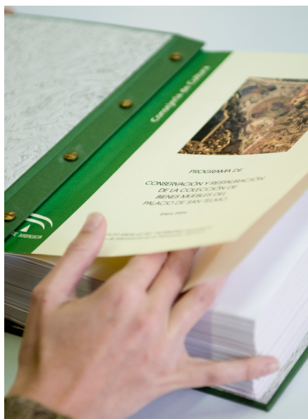
Servicio de consulta del Archivo IAPH | foto Fondo gráfico IAPH

Los documentos de archivo, registros únicos y originales, son producto del desarrollo de las funciones y actividades que realizan las instituciones, organismos y personas. En el caso del IAPH, sus documentos de archivo son los producidos y recibidos por la institución en el desarrollo de sus funciones, en concreto el estudio, la investigación, la conservación, la difusión y la formación en material de patrimonio cultural. Estos documentos se convierten en recursos de información para el estudio del patrimonio cultural, tanto de carácter material (monumentos, esculturas, pinturas...) como inmaterial (rituales festivos, oficios, saberes...), y sirven, por su condición de fuente de información primaria, entre otras cuestiones, para datar, diagnosticar, identificar, proponer tratamientos, instalar y localizar los objetos patrimoniales, como por ejemplo la identificación de pecios de época histórica. Cualquier investigación o trabajo sobre patrimonio cultural, sobre bienes culturales concretos, o sobre aspectos relacionados con los mismos (autoría, escuela artística, cronología, agentes sociales...) deberá sustan-