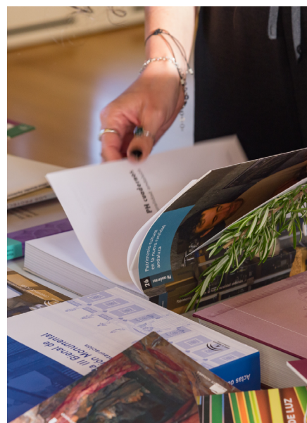
Día del Libro en la Biblioteca del IAPH

¿A qué se puede acceder y cómo en esta comunidad? El Archivo ha organizado los documentos para que, una vez que entramos en ella, las personas puedan navegar y localizar de forma más fácil la información que necesita. Así, los 2.600 recursos documentales que hay disponibles se agrupan siguiendo un criterio temático: documentación, conservación, apoyo a la gestión patrimonial, formación o de divulgación científica. Todas las agrupaciones tienen su propio buscador lo que ayuda a la localización y consulta de la información.