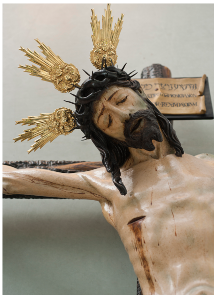
Cristo de la Amargura, Jorge Fernández Alemán (Carmona)