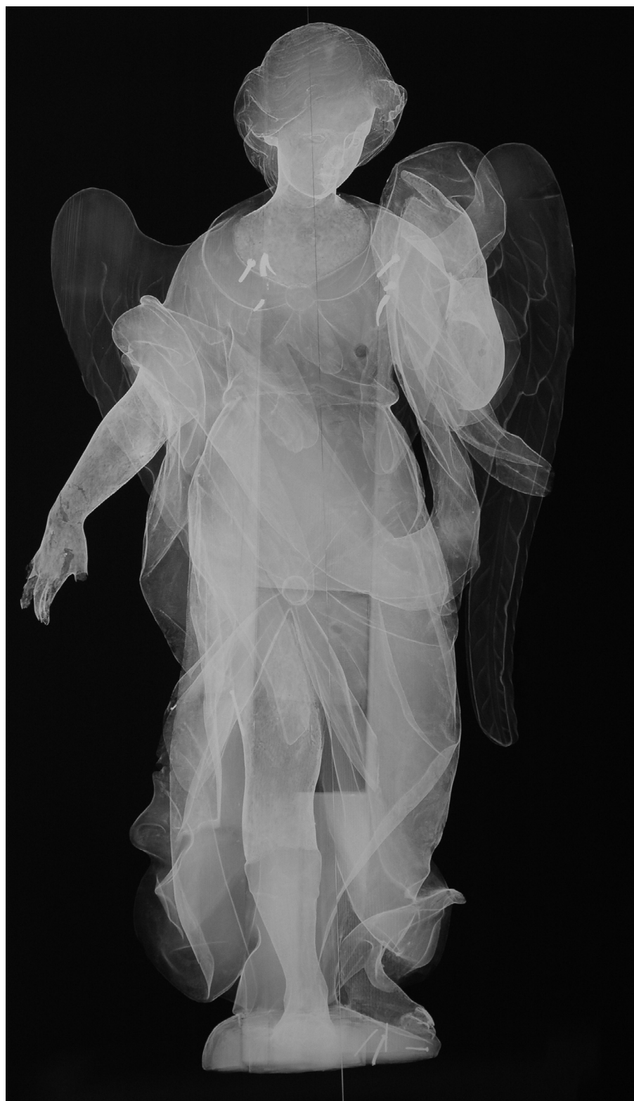
Medios físicos de examen (radiografía) del Ángel pasionario (Sevilla)