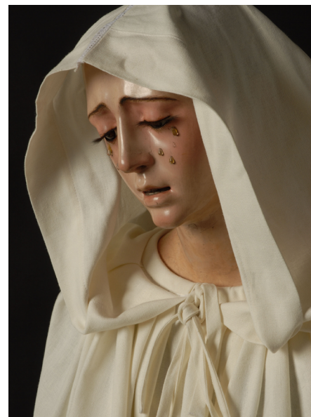
Virgen de la Estrella (Sevilla)