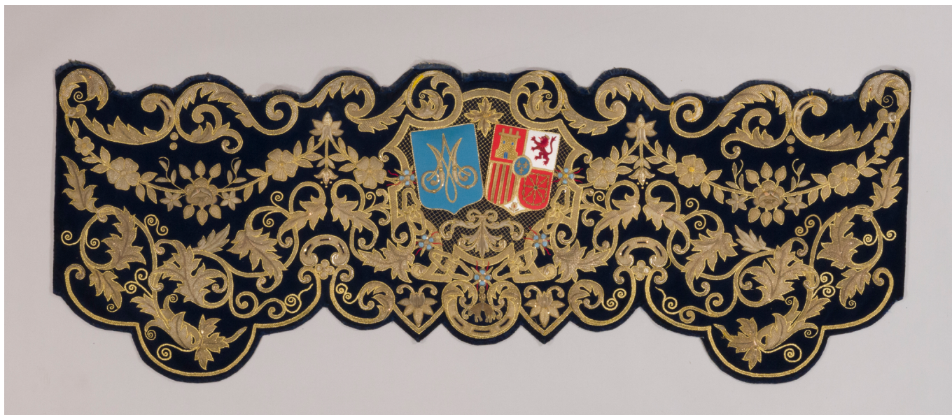
Bambalinas del palio de la Virgen de la Amargura (siglo XX) Huelva

fesional y la crítica general, ajustando los criterios de restauración a modo de chicle que se estira y encoge para adaptarlos de manera oportunista al momento de la intervención”.