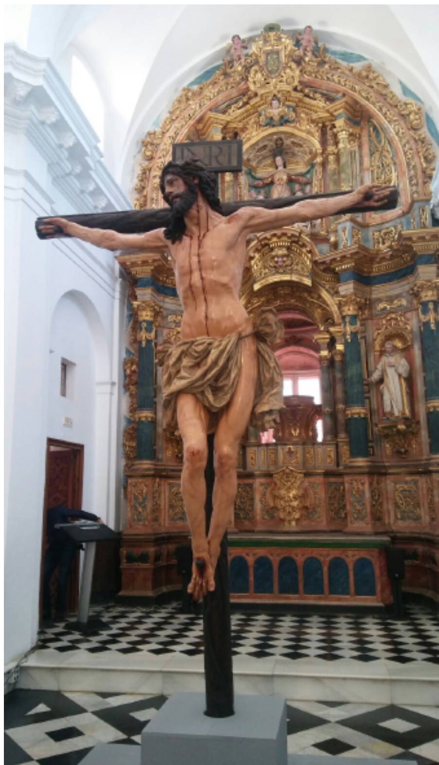
Cristo de la Agonía, de Juan de Mesa. Bergara (Gipuzkoa)