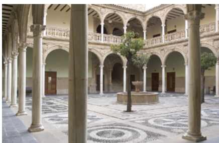
UNIA, sede Antonio Machado en Baeza