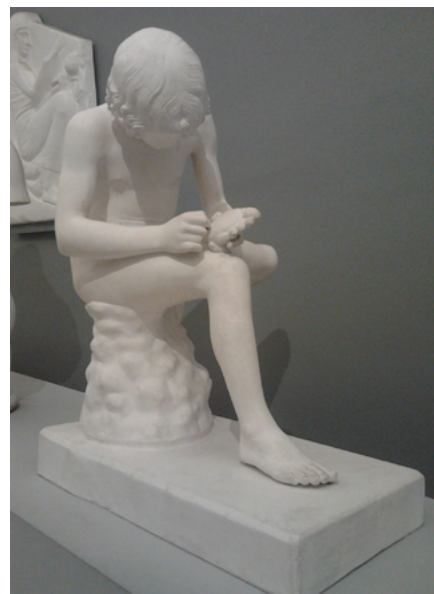
Niño de la espina o Fedele. Copia de yeso realizada entre 1760 y 1799 de la gipsoteca de la Universidad de Sevilla. La original, del siglo I a. de C., se encuentra en los Museos Capitolinos de Roma