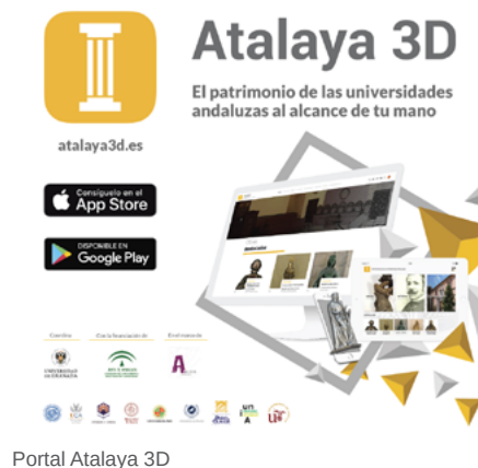
Portal Atalaya 3D

Todas parten de los mismos retos: la necesidad de personal especializado, aunque Sevilla y Granada cuentan con personal técnico para las tareas de gestión, conservación y restauración; un reglamento que facilite su ges-