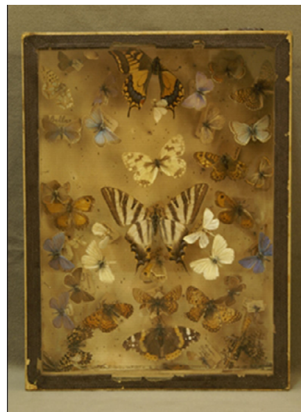
Caja entomológica de lepidópteros (1888-1896). Facultad de Medicina, Universidad de Cádiz

Una de las líneas de coordinación entre las universidades andaluzas ha consistido en la recuperación del patrimonio musical, coordinado por la Universidad de Sevilla con la interacción de las iniciativas culturales de las diez universidades públicas de nuestra Comunidad Autónoma y en estrecha colaboración con la Orquesta Barroca de Sevilla, indiscutible referente en el panorama musical español y Premio Nacional de Música 2011. Este proyecto patrimonial ambicioso y fructífero se inició en 2009 con el objetivo fundamental de recuperar y difundir el patrimonio musical andaluz. Dicho