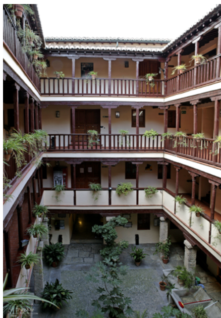
Interior de la Corral de Santiago, residencia universitaria de profesorado e investigadores. Universidad de Granada. Constituye un claro ejemplo de arquitectura doméstica granadina del siglo XVI

El patrimonio cultural universitario se compone de un conjunto múltiple de elementos de diversa tipología que se han ido incorporando a lo largo del período que va desde su fundación, algunas en el siglo XVI, hasta las más recientes en el siglo XX. Estos bienes materiales están formados por los diferentes edificios históricos y contemporáneos que componen sus campus, diseminados por la ciudad, las piezas arqueológicas, los objetos históricos, el legado industrial, las obras de arte, los documentos y los libros, así como las colecciones y conjuntos tecnológicos y científicos, mayormente dispuestos por aquellos objetos que tuvieron una función inicial que se vinculaba a la labor docente o las tareas investigadoras. No obstante, el paso del tiempo y la obsolescencia hicieron que fuesen sustituidos posteriormente por otros equipos más modernos y mejor dotados para esta misión, por lo que con una nueva significación adquieren un nuevo valor patrimonial al establecerse como testigos de la evolución y el progreso del conocimiento. Este patrimo-