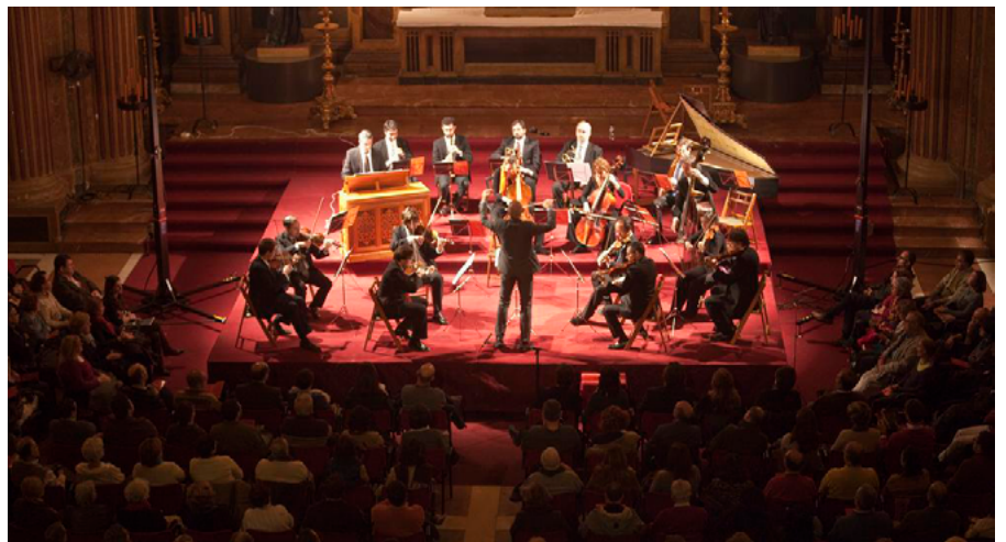
VII Edición Proyecto Atalaya. Concierto Orquesta Barroca de Sevilla en la Iglesia de la Anunciación (Sevilla)

El proyecto pretendía aprovechar las posibilidades que ofrecen las nuevas tecnologías para aplicarlas en la difusión del patrimonio cultural, aquel que atesoran las universidades, muy disperso y poco conocido. Gracias a la generación de este espacio virtual, dotado con recursos innovadores y de un manejo sencillo e intuitivo, se pueden superar algunos de los obstáculos que presentaba tradicionalmente el acceso a este patrimonio: imágenes e información sobre las obras, reproducciones tridimensionales de piezas escultó-