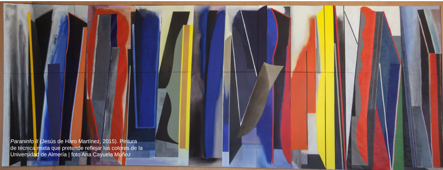
Paraninfo II (Jesús de Haro Martínez, 2015). Pintura de técnica mixta que pretende reflejar los colores de la Universidad de Almería