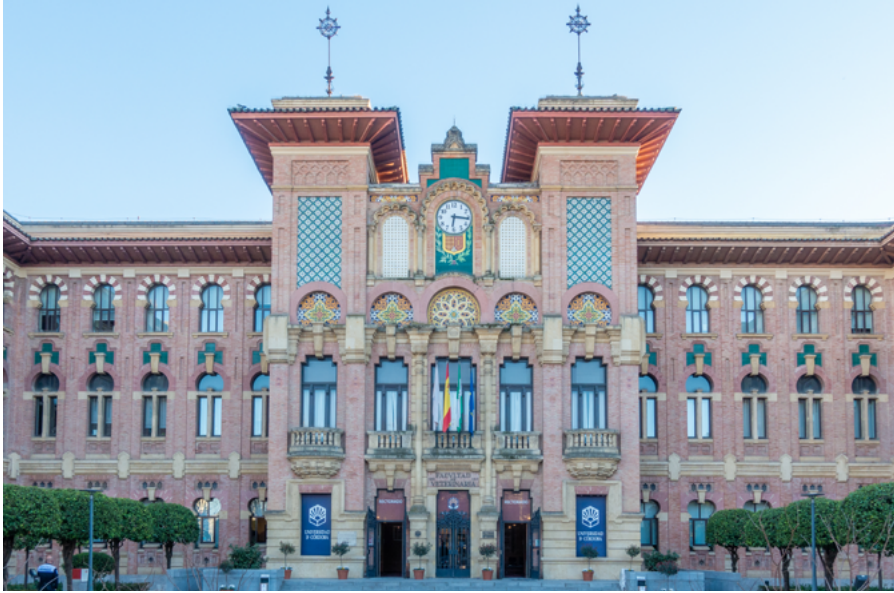
Fachada principal del Rectorado de la Universidad de Córdoba (antigua Facultad de Veterinaria)

Rodríguez-Aguilera y la del escultor Juan Moral, alcanzando casi 2.000 piezas entre pinturas, grabados, litografías y esculturas.