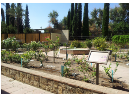
Real Jardín Botánico de Córdoba