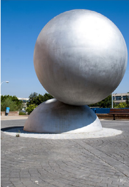
Sin título. Esferas. Universidad de Málaga

Y entre sus actividades destacan Contemporarte, un certamen internacional de fotografía, que comprende cada año la exposición de las obras presentadas, y Campus Cómic, enfocado hacia el cómic y la novela gráfica.