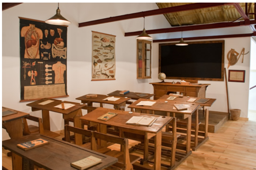
Aula de la escuela nacional católica. Museo Pedagógico de la Universidad de Huelva

tión, como en el caso de la Universidad de Granada, que elaboró un instrumento para garantizar el régimen de la gestión, conservación, restauración, fomento y difusión del patrimonio cultural de carácter mueble, así como del patrimonio cultural de carácter inmueble; un programa de difusión para dar a conocer su patrimonio como en el caso de Sevilla, Granada y Córdoba; o la creación de una política de documentación museística, con el inventariado y clasificación de su patrimonio, como es el caso de las universidades de Sevilla, Granada, Almería, Jaén y Cádiz.