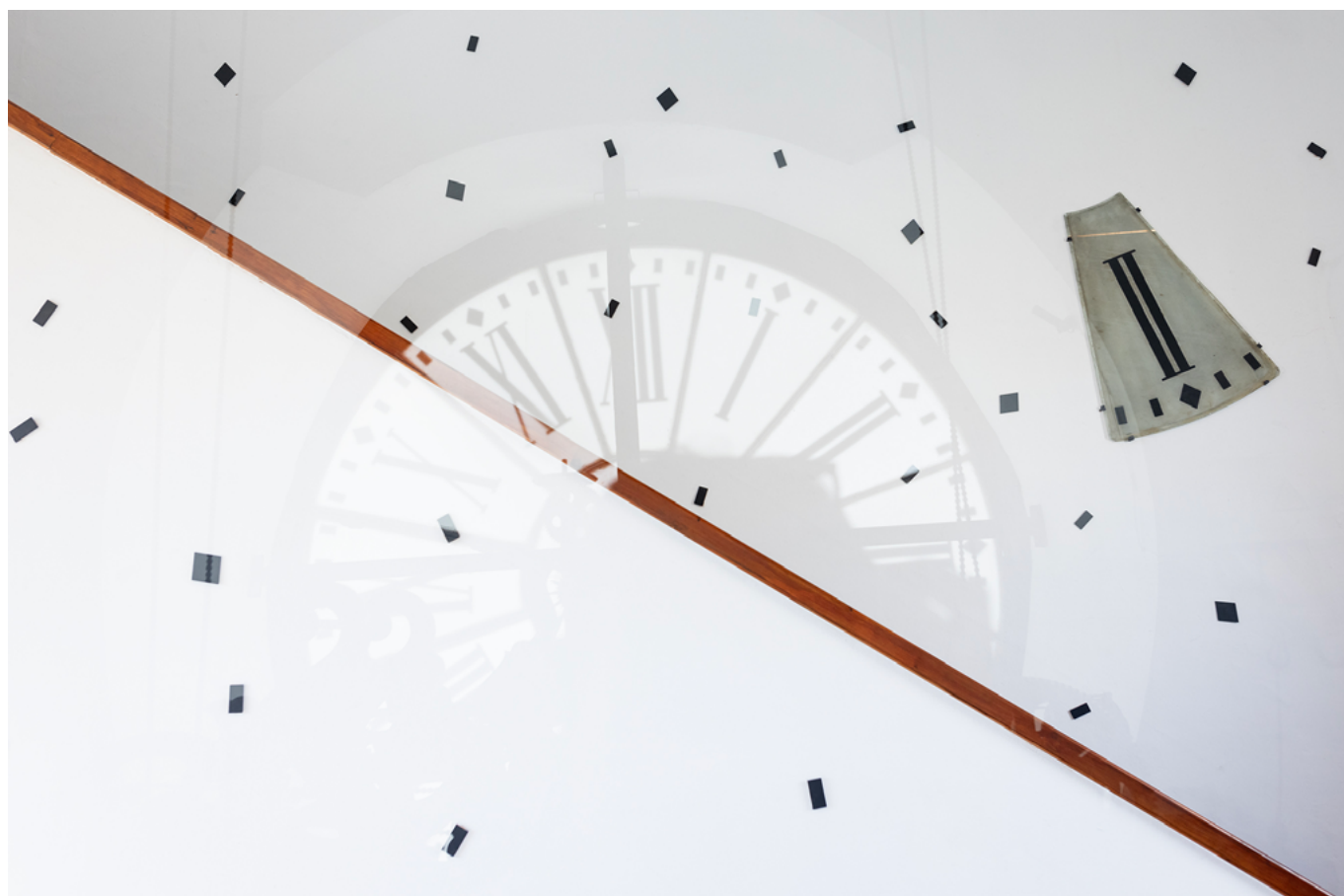
Àlex Nogué. El tiempo explosionado o Reloj cubista. Pare de la instalación La Torre del rellotge (2024)

de madera de acceso, además de la implementación de la señalética de seguridad y los respectivos elementos de protección. Además, cabe señalar cómo durante la ejecución de las obras se pudo constatar una nueva y grave patología, previamente indetectable, en las viguetas metálicas sustentantes de la cubierta, afectadas por el óxido y la corrosión, que tuvieron que ser tratadas y parcialmente sustituidas en sus extremos y apoyos.