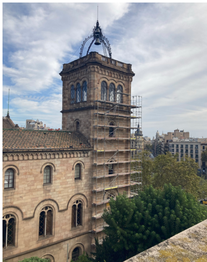
Torre del reloj del Edificio Histórico de la Universidad de Barcelona durante las obras de consolidación (2021)

Desde sus primeros proyectos en 1859, Elías Rogent pensó una nueva universidad con un reloj en la fachada principal integrado en una torre campanario, que debía marcar con su sonido el rigor y la disciplina propias de la vida académica. Sin embargo, pese a los proyectos presentados, esta nunca llegó a construirse, y se substituyó por una espadaña de hierro forjado, erigida en 1877 sobre una de las torres laterales. El 18 de junio de 1881 se inauguró el primer reloj de la Universidad, construido por la empresa de Vicente y Pere Cabanyac, que regía unas campanas construidas el año anterior en la fundición de Miquel Forcada de Vic, cuya inscripción reza Alumni et magistri academiae barcinonensis obtemperate sono , alumnos y profesores de la academia barcelonesa, obedeced el sonido. Este primer reloj estuvo en activo hasta marzo de 1938, cuando el intenso bombardeo fascista sobre Barcelona lo hizo estallar y tuvo que ser sustituido, junto con la espadaña, en los años cuarenta, con un nuevo mecanismo de la empresa Blasco & Liza. Este fue motorizado posteriormente, y en 1995 se