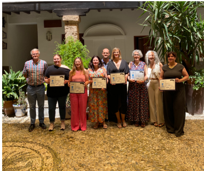
Primeras Jornadas sobre el sello de calidad celebradas el 3 de junio de 2024 en Granada

> Ser miembro de Aproha y, consecuentemente, aceptar y respaldar los estándares de calidad que defiende la asociación. Entre estos valores de calidad destacamos el reconocimiento de la competencia profesional de los historiadores e historiadoras del arte en relación con todas aquellas actividades desarrolladas sobre los bienes histórico-artísticos que impliquen una labor de conocimiento sobre los mismos (sea cual sea el nivel o finalidad) correspondiente al desarrollado (y, por tanto,