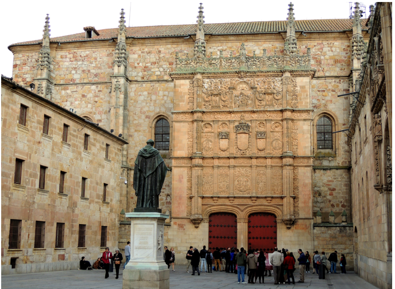
La fachada de la Universidad de Salamanca (1529) es una especie de resumen en piedra de la nueva perspectiva humanística sobre la relación entre el saber clásico, la enseñanza y los nuevos estados nación que surgen en la modernidad

serio pues vincula Bildung (formación) y Kultur , que no es otra cosa que la relación entre un proceso, un proyecto, y sus resultado y producto más significativo. La cultura va a adquirir en el Romanticismo un matiz de normatividad constitutiva de la persona y la comunidad. Esto explica por qué en los tiempos posteriores la cultura ocupa el lugar de piedra fundacional que sustenta los paramentos de la fábrica social, pues la cultura es para los románticos alemanes lo que expresa el espíritu del pueblo Volksggeist y su proyecto de educación de la humanidad a través de las producciones esenciales de la lengua, la sensibilidad artística y la creatividad científica. A partir del giro romántico la cultura comienza a expresar la diferencia de un pueblo en el marco del proyecto de “humanización” o civilización de la humanidad. Nombra lo que distingue, lo que ordena a pueblos y personas en rangos de jerarquía en el progreso general, en el paso del reino de la necesidad al de la libertad (tal como define la concepción kantiana de progreso).