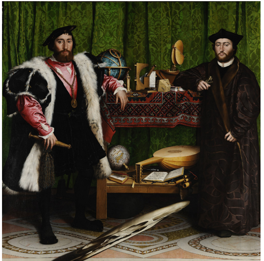
Los embajadores (1533), cuadro de Hans Holbein el Joven (1497-1543), representa simbólicamente los logros culturales del humanismo renacentista y la unión de las artes, los saberes, las técnicas y la nueva relación entre estados basada en el diálogo. La calavera anamórfica de la parte baja apunta al nuevo poder de representación realista o distorsionada del artista

Si la concepción normativa de la cultura conlleva la idea de que el ser humano es un proyecto que debe llevarse a cabo a través de la formación, que se enraíza en el pasado identitario y posibilita una transformación creativa de la realidad, la concepción descriptiva explica el por qué la realidad es para cada sociedad un mundo de sentido, una realidad interpretada que hace que las acciones y el pensamiento humanos adquieran significado y subjetividad y no sean meros impulsos reactivos a las demandas del medio. Por ello, explica también por qué cada sociedad y cada uno de sus componentes adquieren características identitarias que se manifiestan en los modos de vivir y de relacionarse emocional y cognitivamente entre sí y con el entorno físico, biológico y técnico. La cultura descriptiva explica cómo una sociedad se produce y se reproduce, cómo perseveran sus instituciones y cómo se hace posible el interminable flujo de materia, energía e información que la sociedad metaboliza en todo momento de su existencia, sin el cual no sería