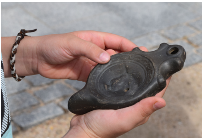
Reproducción arqueológica empleada en educación patrimonial (2016) | Andrés Sánchez-Clemente Ramos

herramientas y recursos digitales educativos y, en consecuencia, el resultado no es el deseado: no son eficaces ni eficientes con propósitos didácticos. Tomando en consideración el sexto principio de Tilden sobre interpretación del patrimonio, la clave para diseñar y desarrollar recursos didácticos eficaces y eficientes reside en su adaptación al público que lo recibirá/empleará y al contexto en el que se haga.