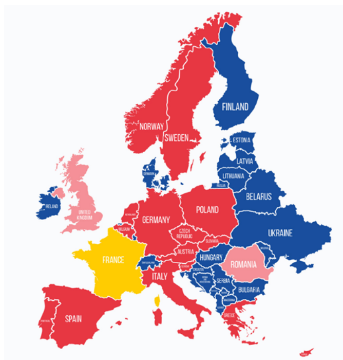
Mapa de socios (rojo) de ARCHE. Reino Unido y Rumanía son socios asociados. Francia coordina