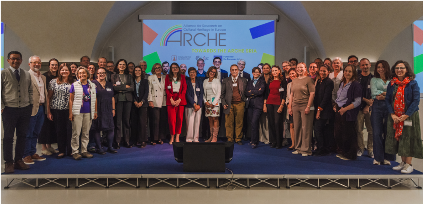
Participantes y miembros del equipo ARCHE en el taller Hacia la SRIA de ARCHE, 25 de septiembre de 2024

más de la SRIA, también está diseñando la estructura de gobernanza de la futura Asociación y creando conexiones y colaborando con la gran cantidad de partes interesadas necesarias para impulsar la SRIA hacia actuaciones de I+D de gran calado e impacto. La Asociación RCH responderá a dos retos principales: por un lado, estudiar el impacto de la crisis climática en el patrimonio cultural y, por otro, tratar de explorar el potencial del patrimonio cultural para ofrecer soluciones a la crisis climática e impulsar la resiliencia social y de la sociedad.