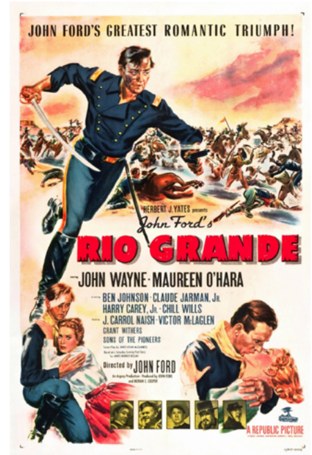
Carteles de Sombrero de copa, Qué bello es vivir y Río Grande

hace más de sesenta años en algunos casos y en las que me reconozco tal como era, tal como quería ser y también tal como he logrado o no he podido ser. Películas que, para mí, como para otros muchos puedan ser estas u otras, forman parte de nuestra unamuniana intrahistoria, esa “vida silenciosa de los millones de hombres sin historia que a todas horas del día y en todos los países del globo se levantan a una orden del sol (...) a proseguir la oscura y silenciosa labor cotidiana y eterna” ( En torno al casticismo ). Películas que, tengan la calidad que tengan, deben respetarse porque, como escribió Proust de la música popular en Los placeres y los días , nunca debe despreciarse porque “se ha llenado con los sueños y las lágrimas de los hombres” y solo por eso, aunque en algún caso “su lugar sea nulo en la historia del arte, es inmenso en la historia sentimental de las sociedades”. Películas que, también, cuando la realidad aprieta, son como las Canciones para después de una guerra de Basilio Martín Patino: “Canciones para sobrevivir, canciones con calor, con ilusiones, con historia; canciones para sobreponerse a la oscuridad, al vacío, canciones para tiempos de soledad”. O, como escribe Andrés Trapiello en Madrid 1945 : “Madrid también era el de los bares, las kermeses y las verbenas, los cines –el cine los salvó a todos– y el fútbol”.