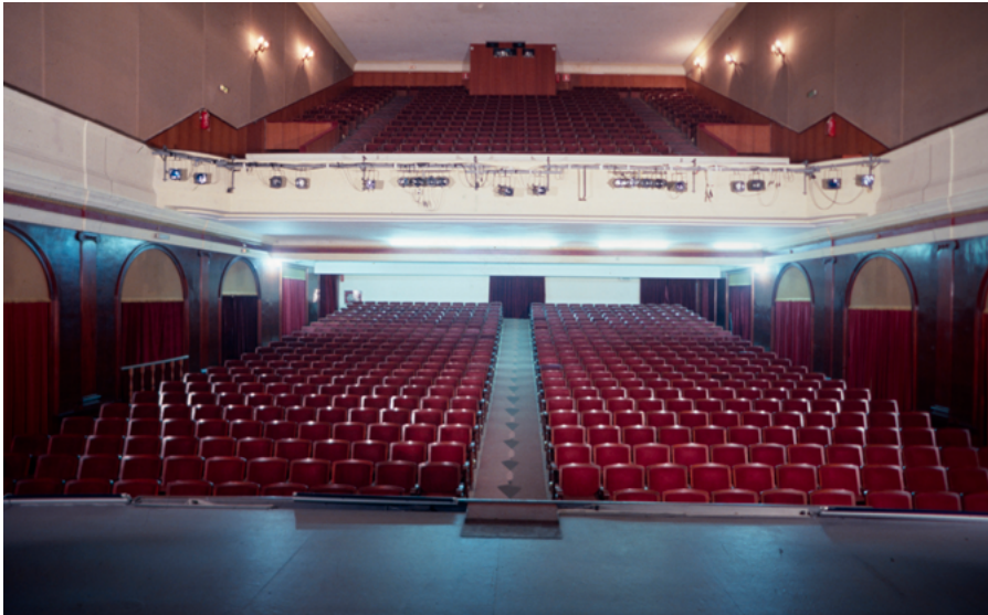
Sala del cine Imperial (Sevilla, 1989)