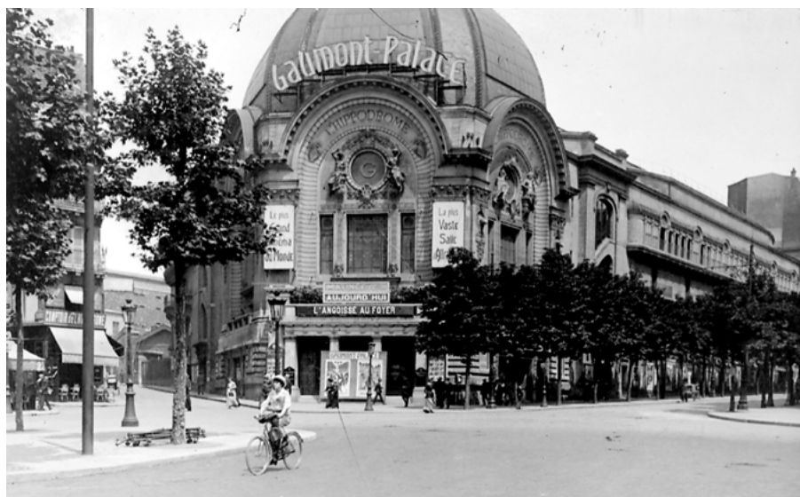
Palacio Gaumont, cine emblemático de París, durante la Primera Guerra Mundial