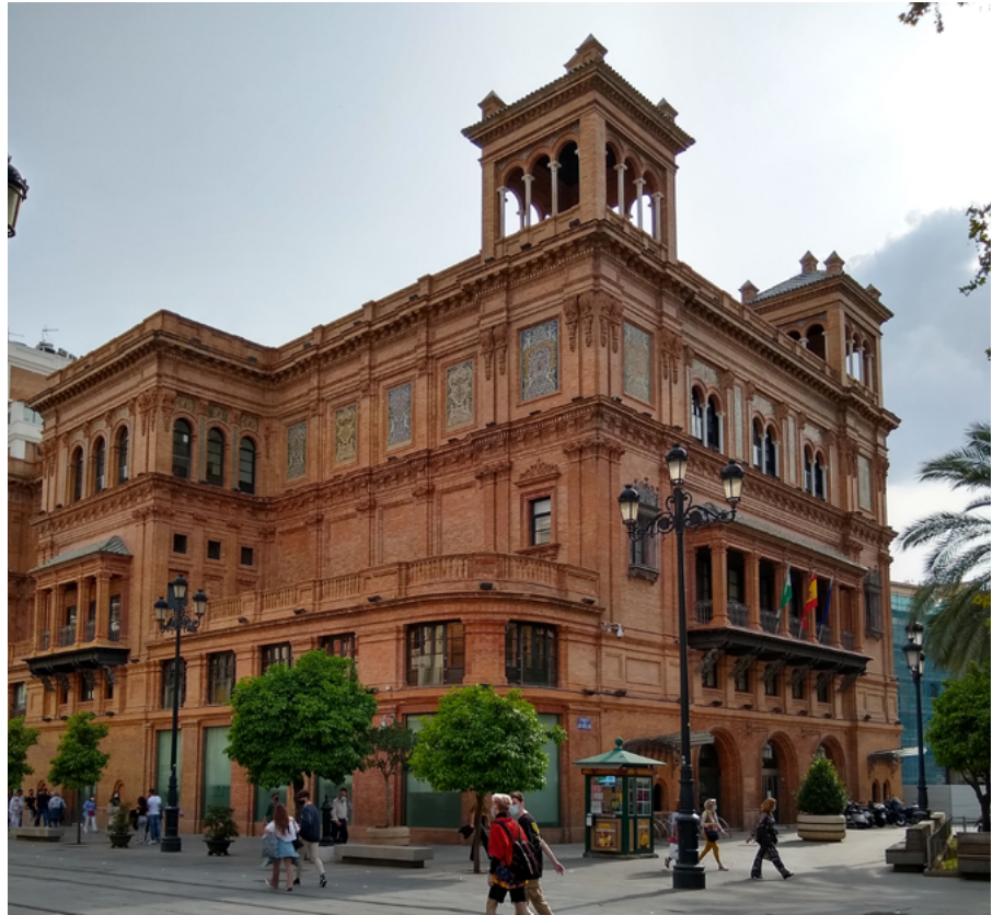
Edificio Coliseo (Sevilla) inaugurado en 1931 como Teatro Coliseo España, en la década de 1970 pasó a ser una sede del Banco de Vizcaya y en 2002 a albergar oficinas de la Junta de Andalucía

(Coliseo) a las inmediaciones de la Alameda (Trajano, Cervantes) atravesando el eje de Sierpes (Llorens, Imperial, Palacio Central) y las paralelas Tetuán (San Fernando) y Cuna (Pathè) con los cines fronterizos de Ponce de León (Rialto) y de las Rondas (Florida, Victoria, Alkázár, Andalucía). A los que se sumaban las salas de reestreno de los barrios: Goya, Nervión y Juncal en Nervión; Astoria, Emperador y Rocío en Triana; Delicias y Lux en Cruz Roja-Pío XII; Bécquer y Esperanza en Macarena... Cada una, además de su propia personalidad arquitectónica y decorativa, con sus propios caminos de ida y vuelta, sus entornos en los que tomar un café o una cerveza, según la hora, antes o después de ver la película. Los cines eran parte de la ciudad. No desprecies la nostalgia, imbécil. Porque ha habido pérdida.