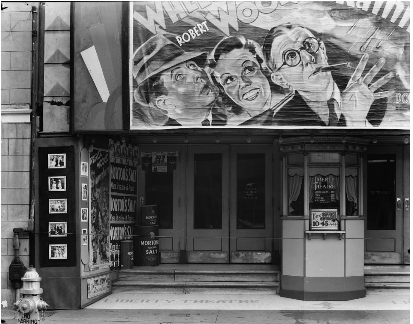
Liberty Theatre (New Orleans, Louisiana) | foto Biblioteca del Congreso (Walker Evans, 1935) (Dominio público)

ristas” –muchos, después, “autores”– considerando “autores” a directores despreciados porque trabajaron para la industria de Hollywood aceptando los marcos de los géneros. Es lo que Handke expresa cuando dice que lo maravilloso del cine, sobre todo de entre los años 30 y los 60, es que no era una cultura pura de corazón frío, sino una cultura mezclada.