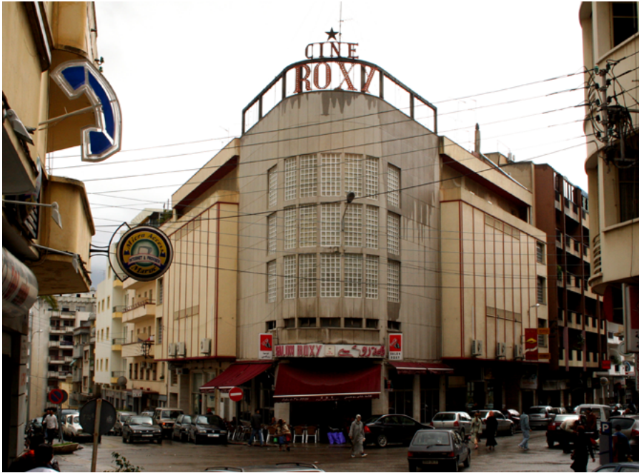
Cine Roxy en Tánger