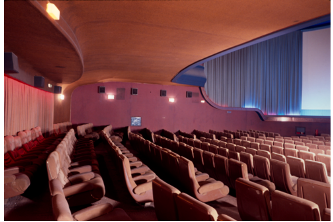
A la izquierda, sala del cine Imperial (Sevilla, 1989); a la derecha, patio de butacas del cine Bécquer (Sevilla, 1989)

descorren las cortinas o se alza el telón. Anuncios. Tráileres. Se vuelven a cerrar las cortinas o a caer el telón. Suena la obertura de la película, sin proyección, en una media luz. Quizás de Dimitri Tiomkin, quizás de Alfred Newman, quizás de Alex North, quizás de Maurice Jarre, quizás de Elmer Bernstein, quizás de Michel Legrand. Se descorren las cortinas o se alza el telón. Se oscurece del todo la sala. Aparece un león rugiendo, o quizás una bola del mundo en torno a la que giran unas letras o sobre la que se alza una antena despidiendo pequeños rayos, o quizás una montaña nimbada de estrellas, o quizás dos números y unas letras colosales rodeadas de reflectores que lanzan sus rayos de luz al cielo, o quizás la mismísima Columbia llevando la antorcha de la estatua de la Libertad.