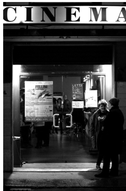
Cinema Café Lanteri, Pisa

“El que os está hablando en estos momentos tiene que reconocer una cosa: que le gusta salir de los cines. Al encontrarse en la calle iluminada y un tanto vacía (siempre va al cine por la noche, entre semana) y mientras se dirige perezosamente hacia algún café, caminando silenciosamente (no le gusta hablar, inmediatamente, del film que acaba de ver), un poco entumecido, encogido, friolero, en resumen, somnoliento: sólo piensa en que tiene sueño; su cuerpo se ha convertido en algo relajado, suave, apacible: blando como un gato dormido, se nota como desarticulado, o, mejor dicho, (...) irresponsable. En fin, que es evidente que sale de un estado hipnótico... (...) Así suele salirse del cine. Pero, ¿cómo se entra? Salvo en los casos –cada vez, cierto, más frecuentes– de una intención cultural muy precisa (película elegida, querida, buscada, objeto de una auténtica alerta precedente), se suele ir al cine a partir de un ocio, de una disponibilidad, de una vocación. (...) Hay una ‘situación de cine’, y esta situación es pre-hipnótica. (...) Conduce al individuo, de calle en calle, de cartel en cartel, hasta que éste se sumerge finalmente en un cubo oscuro en el que se producirá ese festival de los afectos que llamamos una película” 5 .