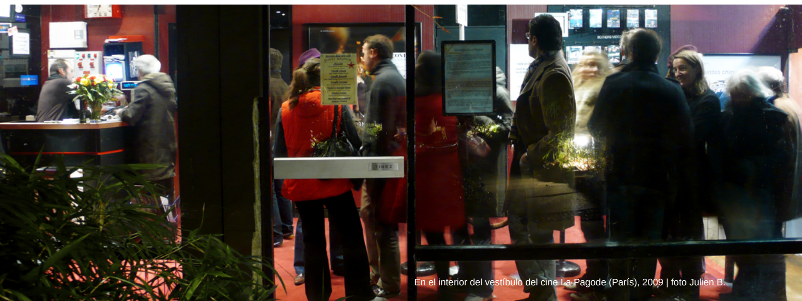
En el interior del vestíbulo del cine La Pagode (París), 2009