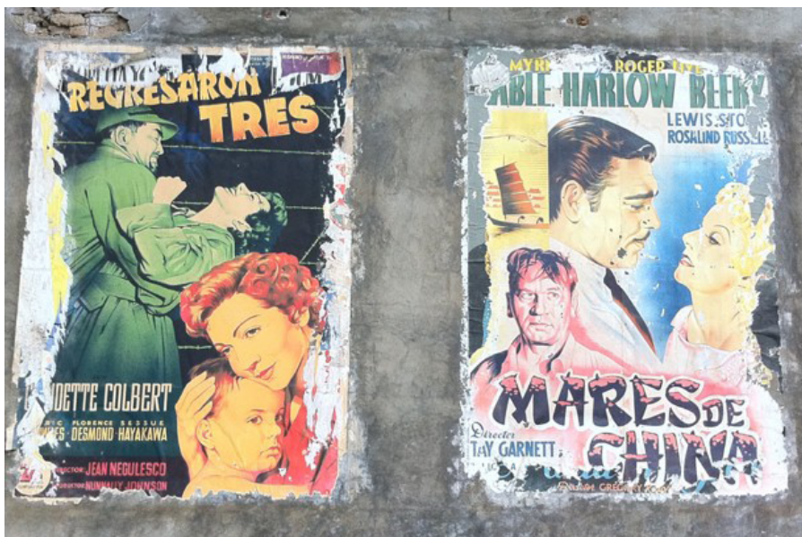
Vallas publicitarias de cine antiguo en La Vegueta, Las Palmas de Gran Canaria

Esta tensión entre “tenderos” y “artistas”, o productores y directores, es conatural al cine como el único universo que lo hizo y lo hace posible. Sin embargo, la condena de los productores –los “tenderos”– como groseros tiranos que sacrifican el arte al beneficio ha sido y es un tópico que ha vivido hasta hoy. Incluso cuando el desmantelamiento del sistema de los estudios demostró que, en su edad de oro, el cine americano alcanzó su mayor nivel medio de calidad y el más alto número de obras maestras rodadas por una asombrosa legión de creadores (no solo directores: actores, guionistas, diseñadores de producción, compositores) que trabajaban, no sin fricciones e incluso fuertes colisiones, para los estudios. Entre los que