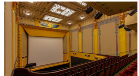
Cine Louxor (París)

Durante setenta años aproximadamente –de 1915 a 1982–, por decirlo en términos sevillanos a partir del nacimiento y muerte del Llorens, la sala de cine más longeva haciendo excepción de los teatros adaptados a proyecciones como el San Fernando o el Cervantes, hoy único superviviente, las películas se vieron en estas salas dotadas de su propia personalidad arquitectónica y decorativa, y de sus propios territorios que abarcaban toda la ciudad, desde el eje tradicional de los espectáculos del centro que iba de la Avenida