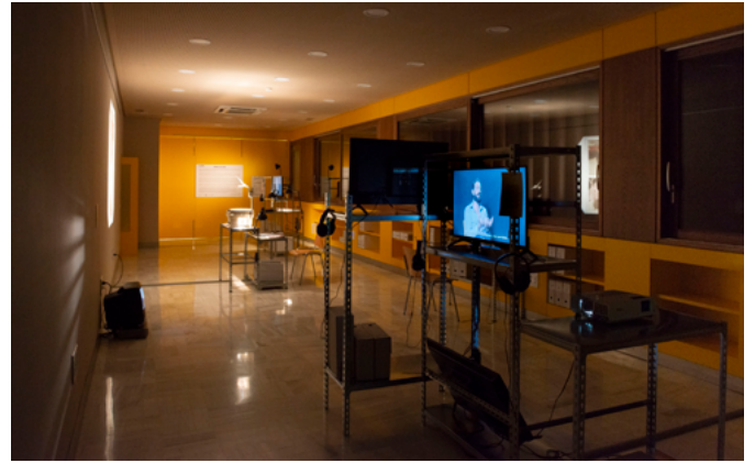
Aspecto de la instalación de la muestra Memorias del Cine: archivo (2023) , con las entrevistas del proyecto