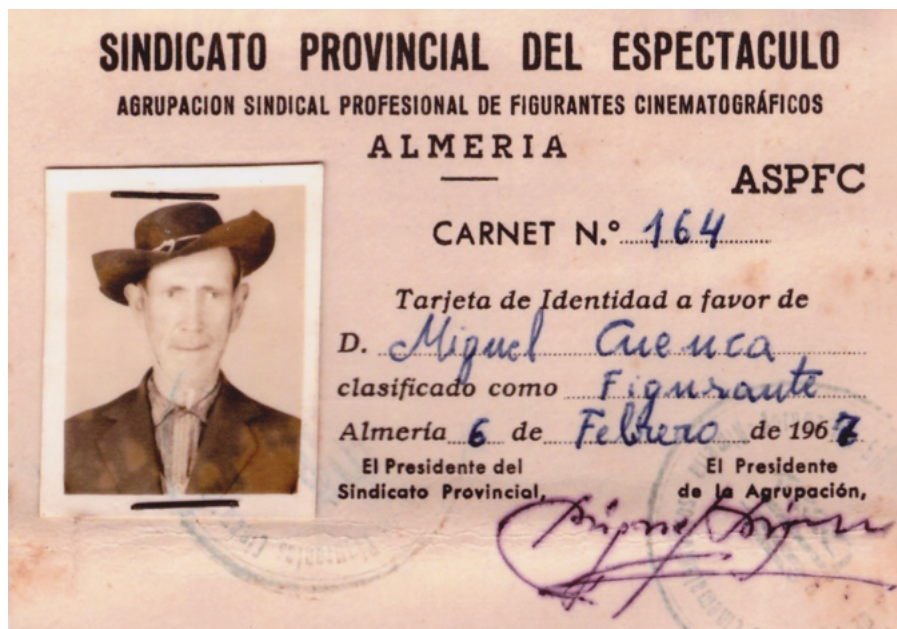
Carnet de la Agrupación Sindical Profesional de Figurantes Cinematográficos, en la categoría figurante, emitido en 1967