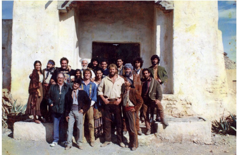
Grupo de trabajadores almerienses con el equipo de la película Trinidad y Bambino: tal para cual (1995)