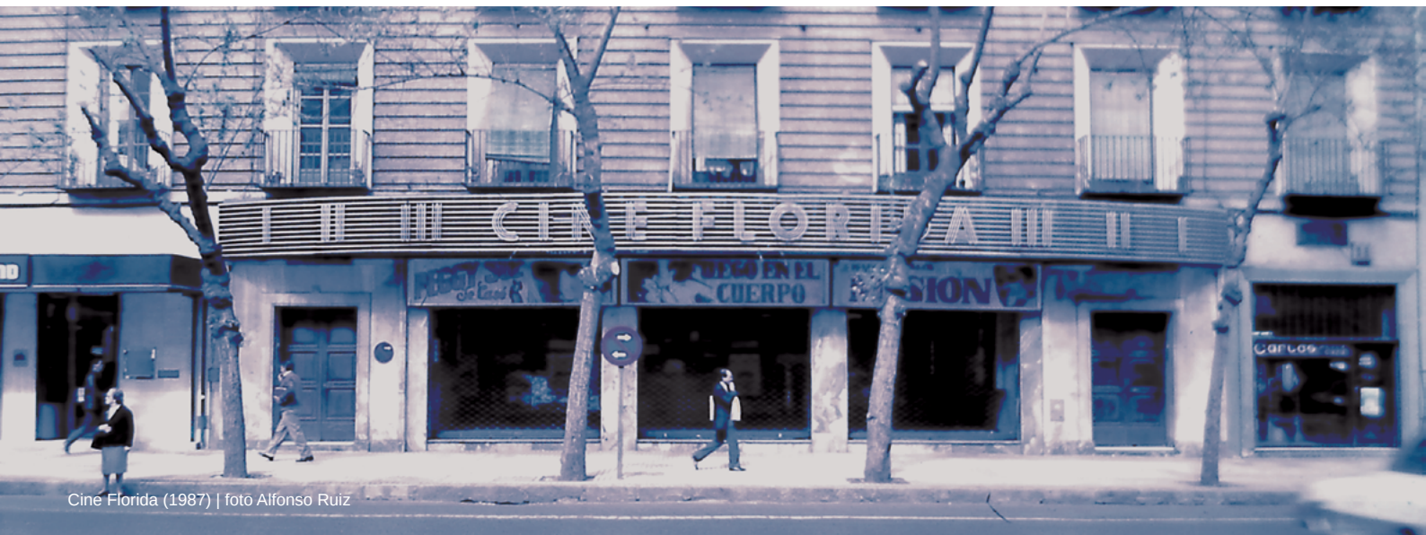
Cine Florida (1987)