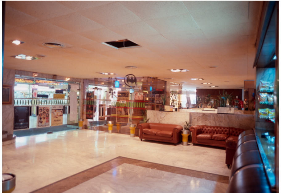
Antesala de sala de proyección del Alameda Multicines (1989)

Consumimos más rápidamente, sin necesidad de escenografías ni rituales que nos conciencien de la acción; nos movemos con unos tiempos distintos, artificiales e impuestos, difíciles de salvar; nos dirigimos a la sustitución de los universos personales por otros especializados por indiferenciados y, por ende, a la imposibilidad de reconocernos en la ciudad histórica; vemos los objetos como no esenciales; la vida social se hace impersonal y su carácter, que se pretende universal, no pertenece ya a un tiempo ni a un lugar concreto. Esta nueva actitud social pone su acento en favorecer el disfrute individual del tiempo de ocio.