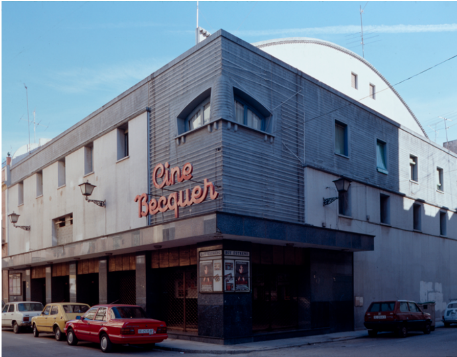
Cine Bécquer (1989)

El edificio resuelve de manera correcta su implantación. La escala de la calle donde se sitúa, trasera a la calle Resolana, y su posición en esquina serán las bases desde la que se dé respuesta volumétrica y compositiva al entorno. La disposición de los dos vestíbulos a las dos calles habla de la necesidad de colonizar los ámbitos urbanos a los que el edificio presenta fachada, jerarquizando no obstante sus respuestas, escalar y funcionalmente. La esquina y no el edificio se convierte en eje vertical de referencia desde el recorrido urbano habitual de la calle. Realizado en un corto espacio de tiempo, fue inaugurado en el mes de noviembre. La sala, diseñada con unas condiciones de acústica y visibilidad óptimas, estaba decorada en sus paredes laterales por frescos del pintor Juan Miguel Sánchez. La decoración interior responde a un racionalismo reinterpretado próximo al art decó; destaca la bella factura del bar. La mezcla de estos estilemas con ambientes extraídos de la denominada "arquitectura blanca" produce una sensación de ambigüedad estilística muy propia de las obras del periodo autárquico en Sevilla.