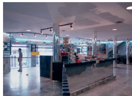
Florida Multicines (1989)

Parece que la ciudad, antes de ampliarse, de saltar los límites de su configuración secular, necesita anclarse en ámbitos de referencia claramente definidos. Sevilla ha aprovechado el acontecimiento del 29 para poner en marcha un plan de equipamientos que la ciudad venía demandando hacía tiempo. Aquí en la Puerta de la Carne, con un carácter diferencial, se construye por