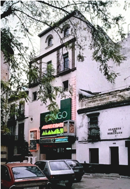
Exterior del edificio donde se ubicaba el Alameda Multicines (1989)