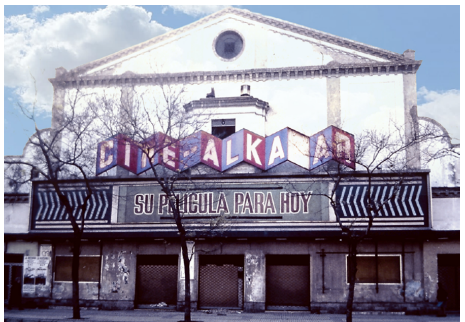
Cine Alkazar (1989)